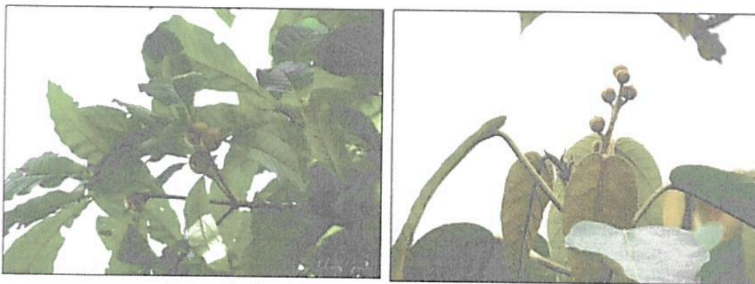
Fotografías 3 y 4. Árboles presentes en la RNSC Los Pomos.