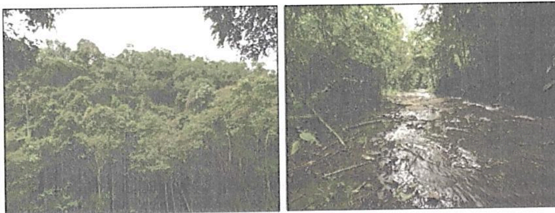
Fotografías 1 y 2. Vegetación presente en la RNSC Los Pomos

Los bosques que se encuentran ubicados sobre la cota de los 1000 msnm, hasta un límite que puede estar hacia los 4000 msnm aproximadamente, son denominados andino o subandino (Barbosa et al., 2013). Ver fotografías 1 y 2.