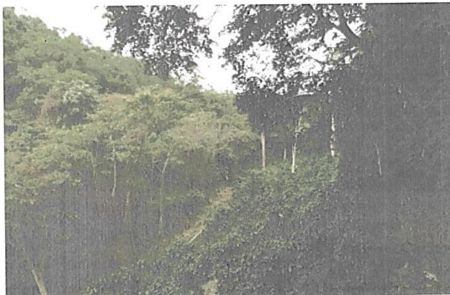
Fotografías 7. Bosque y agrosistemas.