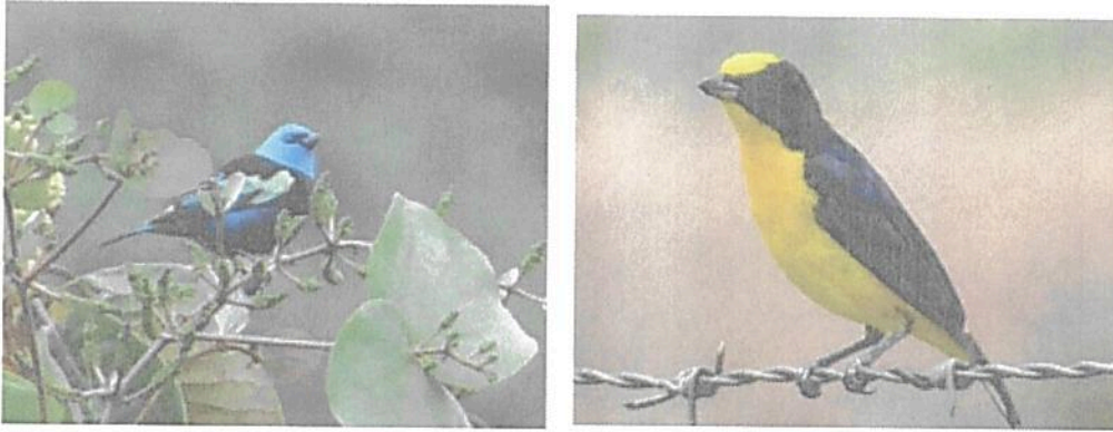
Fotografías 5 y 6. Aves presentes en la RNSC Los Pomos