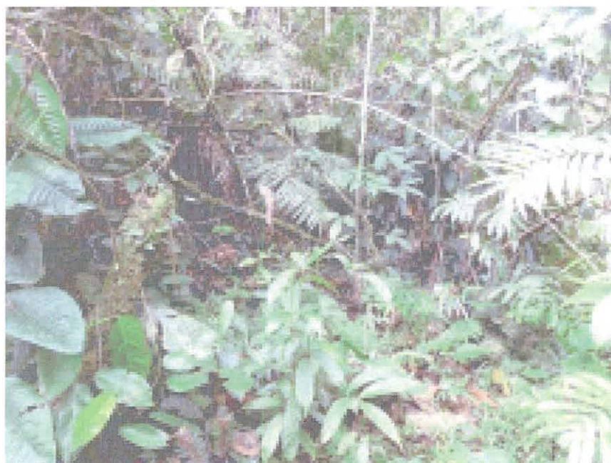
Figura 2 Composición de la flora en la RNSC "MAPORITA". Fuente: visita técnica realizada por CORNARE

Fuente: visita técnica realizada por CORNARE