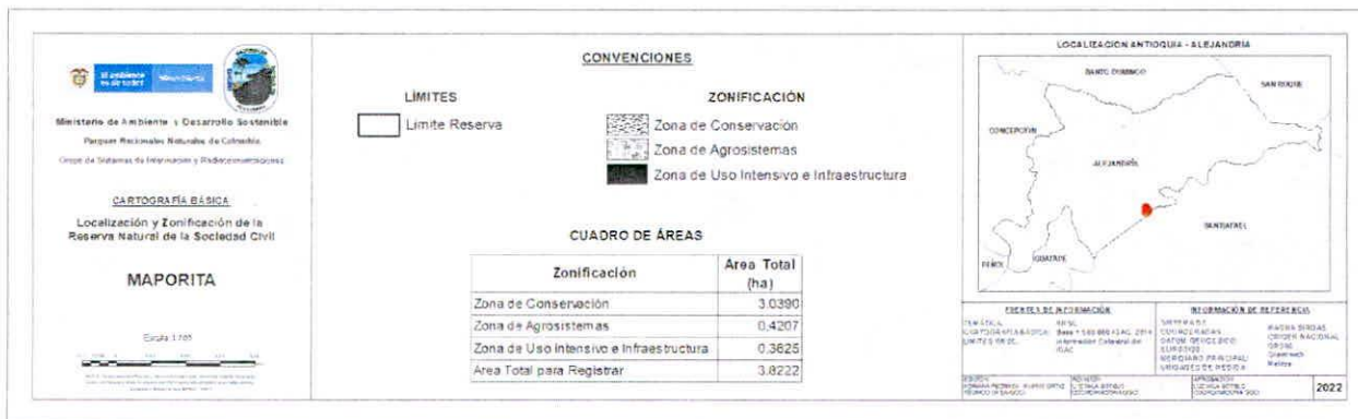
Figura 3: salida grafica de la zonificación de la RNSC MAPORITA