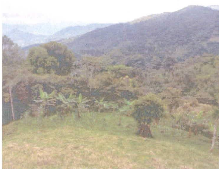
Figura 5 Zona de Agrosistemas presente en el predio "Piedras" inscrito bajo el folio de matrícula inmobiliaria No. 026-18974., que conforma la RNSC "MAPORITA".