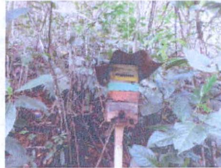
Meliponicultura en zona de conservación

Figura 4 Zona de Conservación presente en el predio "Piedras" inscrito bajo el folio de matrícula inmobiliaria No. 026-18974., que conforma la RNSC "MAPORITA".