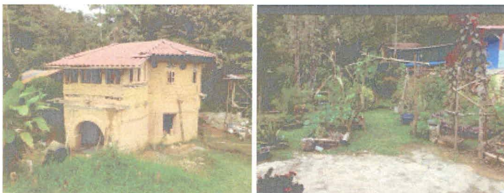
Figura 6 Zona de infraestructura y uso intensivo presente en el predio "Piedras" inscrito bajo el folio de matrícula inmobiliaria No. 026-18974., que conforma la RNSC "MAPORITA".

Comprende un área de 0,3625 ha equivalente al 10 % de la reserva, "... Construcción y mejoramiento de vivienda, bioconstrucción, habitación permanente, construcción de pozos sépticos y baños secos, manejo de huertos, incluyendo los de las demás zonas." ..."