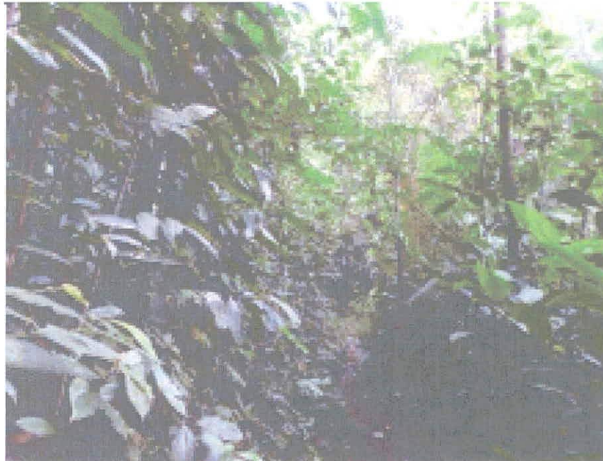
Figura 1 . Zona de Conservación

Por otro lado, al interior del predio visitado se resalta la presencia de dos nacimientos de agua que desembocan en el río Bizcocho. Así pues, el ecosistema boscoso de la reserva natural Maporita favorece la conservación del recurso hídrico en esta zona." ...".