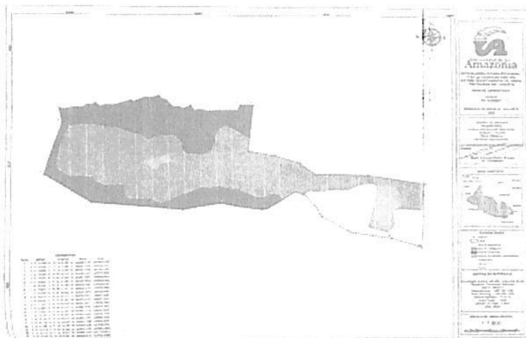
Figura 1. Mapa de zonificación allegado. Fuente: radicado No. 20204600054512 del 10/07/ 2020.