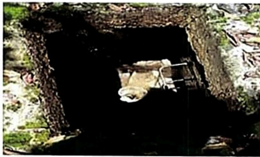
Vista Reducción Sistema Distribución