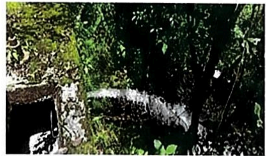
Vista Superior de Sobranante