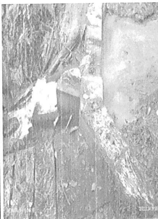
fotografía 10 muestra de quebrada "las vueltas" de la RNSC "Lote Mireya"