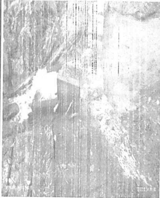
fotografía 11 Bocatoma acueducto el Jabón de la RNSC "Lote Mireya"

Figura 5. Zona de Amortiguación y Manejo Especial del predio "Lote Mireya" inscrito bajo el folio de matrícula inmobiliaria No. 206-59178 que conforma la