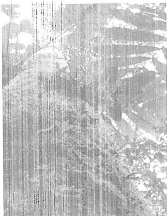
fotografía 9 muestra de árbol de la RNSC "Lote Mireya"

La zona protege 1 quebrada denominada "las vueltas" la cual abastecen más de 170 familias de la vereda el jabón, área donde además se ha favorecido la sucesión natural e impedido el desarrollo de actividades antrópicas, así dando cumplimiento a la normatividad ambiental vigente y conservando la integridad del territorio. ".." (Figura 1)