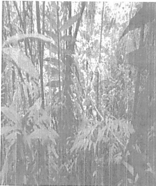
fotografía 10 muestra de bosque secundario RNSC "Lote Mireya"

secundario y rastrojos en proceso de regeneración. Esta zona a pesar de haber tenido una fuerte intervención en el pasado, en la actualidad presenta un buen estado conservación, es muy estratégica y de gran importancia debido a que en la zona se encuentra la bocatoma principal del acueducto que abastece a más de 170 familias de la vereda el Jabón. "..."