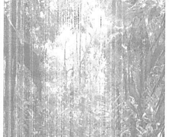
Fotografía (2) muestra de un ecosistema natural interior. RNSC "Lote Mireya", FMI No. 206-59178.