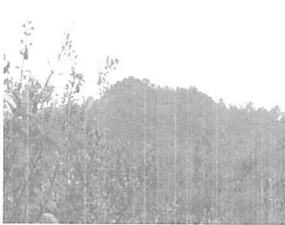
Fotografía (1) muestra el ecosistema natural exterior. RNSC "Lote Mireya", FMI No. 206-59178.