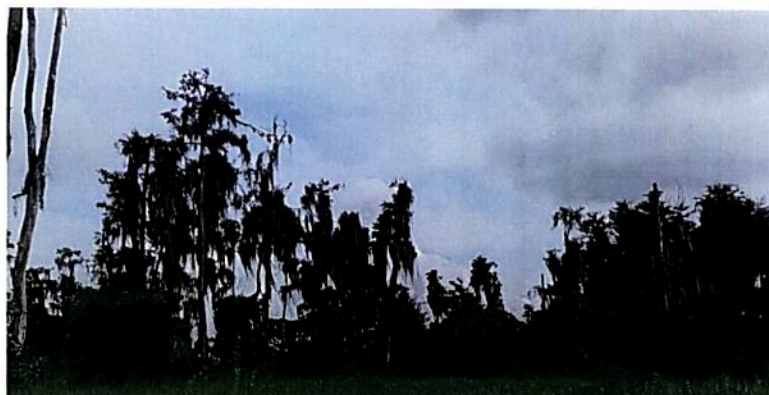
Figura 2. Muestra de ecosistema natural del predio Lote2B, a denominarse Reserva Natural de la Sociedad Civil "BOSQUE COLINDRES"

cobertura del ecosistema corresponde a un bosque mixto abierto de tierra firme 2 . Las especies herbáceas y vegetación nueva predominan sobre el sotobosque. Las especies arbóreas son de gran porte superando los diez metros de altura. Dado que se localiza sobre la planicie inundable del río Cauca, el bosque se caracteriza por presentar periodos de inundación.