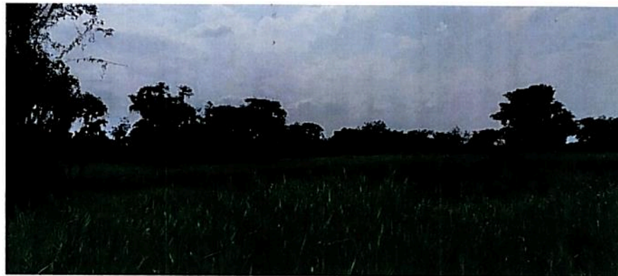
Figura 7. Zona de Restauración de la RNSC "BOSQUE COLINDRES"

Esta zona corresponde al 62,05%. Es decir, a 23,6985 ha del área total a registrar. Esta conformada por coberturas de pastos y rastrojo alto. Y está dedicada a la producción agropecuaria sostenible, tanto para el consumo doméstico como para la comercialización, favoreciendo de esta manera la seguridad alimentaria.