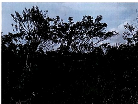
Figura 8. Zona de Uso intensivo e Infraestructura de la RNSC "BOSQUE COLINDRES"