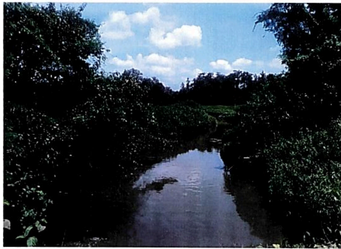
Figura 6. Zona de Restauración de la RNSC "BOSQUE COLINDRES"

Esta zona corresponde al 0,80 %. Es decir, a 0,3058 ha del área total a registrar. Se localiza en el margen izquierdo del canal de drenaje "Potrerillo" que atraviesa el predio Lote2B sobre su costado izquierdo. El área esta destinada a actividades de siembra de especies nativas para su restauración.