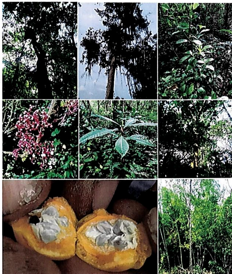
Figura 3. Flora presente en el predio Lote2B, a denominarse Reserva Natural de la Sociedad Civil "BOSQUE COLINDRES"