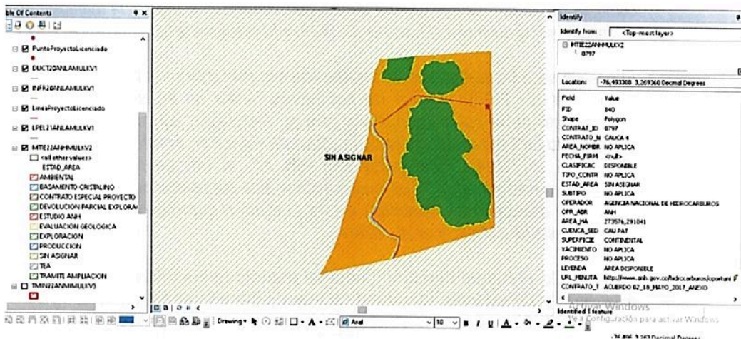
Figura 10. Traslape del predio Lote2B objeto de registro a denominarse RNSC "BOSQUE COLINDRES" con el contrato Cauca 4, operado por la ANH

Teniendo en cuenta la verificación cartográfica realizada por el Grupo de Trámites y Evaluación Ambiental – GTEA, el predio Lote2B presenta traslape con el contrato Cauca 4, el cual se encuentra en estado, sin asignar y es operado por la Agencia Nacional de Hidrocarburos, según lo consultado con la capa de la ANH (2022). Figura 10