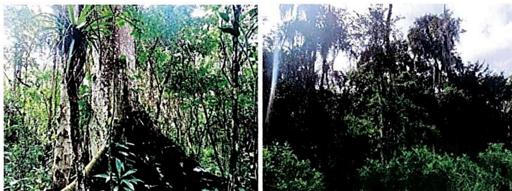
Figura 4. Zona de Conservación de la RNSC "BOSQUE COLINDRES" Bosque Seco Tropical (bs-T)

Esta zona corresponde al 34,40 %. Es decir, a 13,1372 ha del área total a registrar. Esta conformada por la muestra de ecosistema natural de Bosque seco Tropical (bs-T) y Humedales, que se han recuperado naturalmente. Esta área se encuentra destinada a la conservación del mismo.