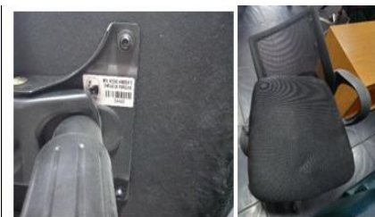
PLACA DE INVENTARIO: 54443 | FECHA DE INGRESO: 23-07-2018 ESTADO: Malo JUSTIFICACIÓN PARA DAR DE BAJA: Daños en su estructura soporte del espaldar