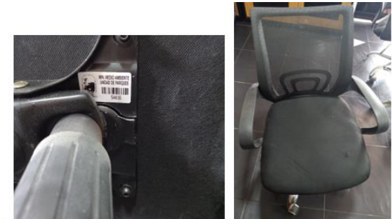
PLACA DE INVENTARIO: 54416 | FECHA DE INGRESO: 23-07-2018 ESTADO: Malo JUSTIFICACIÓN PARA DAR DE BAJA: Daños en su estructura soporte y salida de tornillos en el asiento