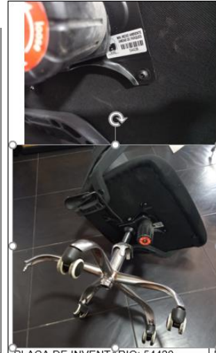
PLACA DE INVENTARIO: 54420 | FECHA DE INGRESO: 23-07-2018 ESTADO: Malo JUSTIFICACIÓN PARA DAR DE BAJA: Daños en su estructura soporte y espaldar