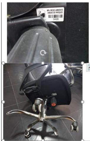
PLACA DE INVENTARIO: 54428 | FECHA DE INGRESO: 23-07-2018 ESTADO: Malo JUSTIFICACIÓN PARA DAR DE BAJA: Daños en su estructura soporte y espaldar