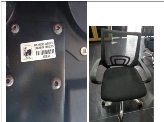
PLACA DE INVENTARIO: 45990 | FECHA DE INGRESO: 20/12/2011 ESTADO: Malo JUSTIFICACIÓN PARA DAR DE BAJA: Daños en su estructura soporte y espaldar