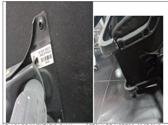
PLACA DE INVENTARIO: 54444 | FECHA DE INGRESO: 23-07-2018 ESTADO: Malo JUSTIFICACIÓN PARA DAR DE BAJA: Daños en su estructura soporte y rompimiento en la unión del soporte del espaldar