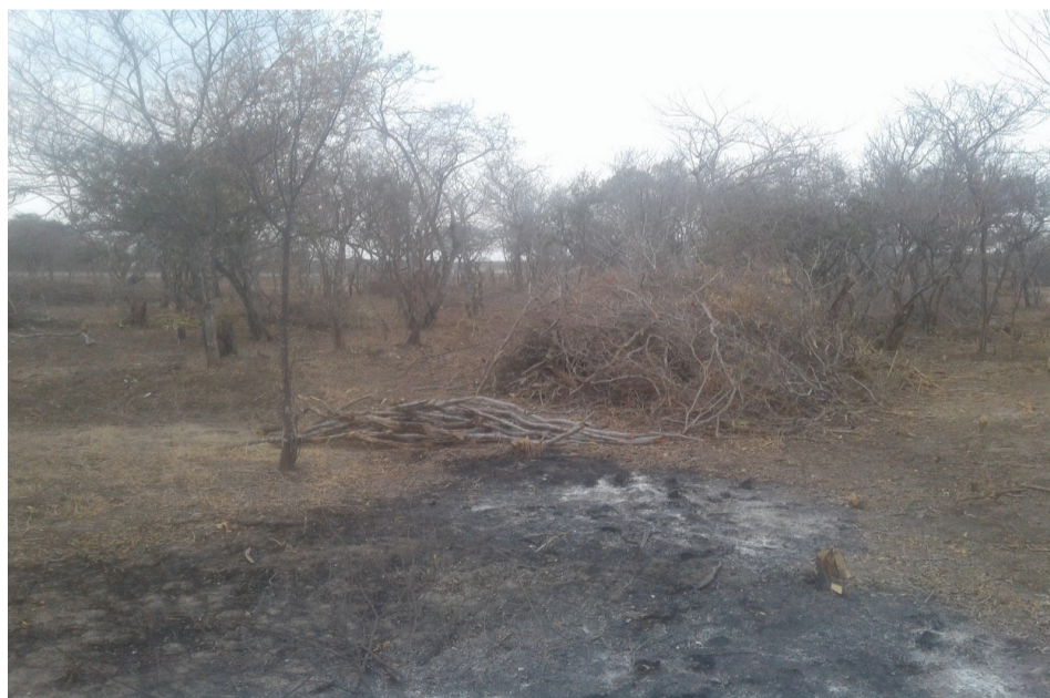
Fotografía 1 zona de tala y quema.

Por otra parte, del informe técnico No. 20196660012246 se recata el siguiente registro fotográfico: