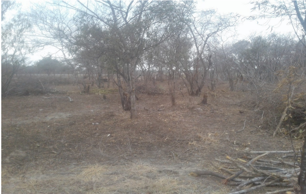
Fotografía 2. Zona de tala.

“Por la cual se ordena el archivo de la indagación preliminar No. 029/20 adelantada contra INDETERMINADOS y se adoptan otras determinaciones”