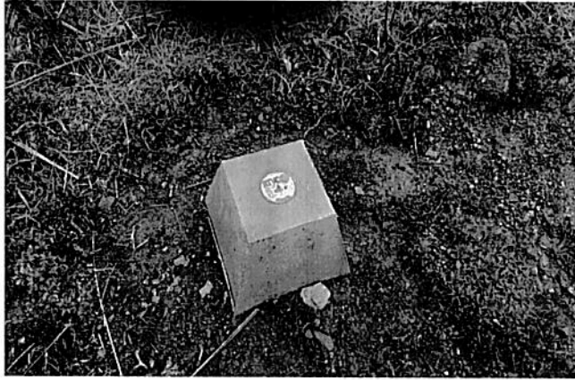
Fotografía 2. Instalación de los mojones en concreto para monitoreo satelital de posibles desplazamientos de la infraestructura.