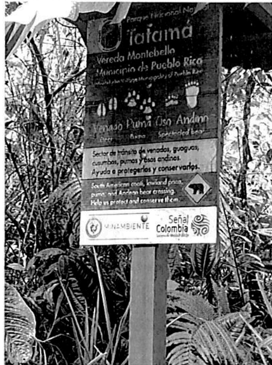
Fotografía 9. Registro del estado de deterioro acelerado de algunas de las vallas instaladas en el PNN Tatamá.

En lo relacionado con la señalización, se verifico el estado actual de las vallas y letreros instalados y se halló que estas señales registran un grado de deterioro acumulado, debido a la pérdida paulatina de la capa de barniz y de pintura sobre la madera, lo que ha comprometido la duración de las vallas por las condiciones de intemperie (lluvia – sol) a las que se encuentran expuestas. Estos son los registros fotográficos: