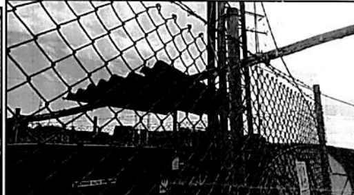
Fotografía 3, 4 y 5. Deterioro de tejas de cuarto de plantas, malla de cerramiento de tanque y falta de cobertura para el transformador.