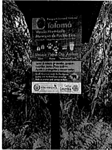
Fotografía 1. Registro del estado de deterioro acelerado de algunas de las vallas instaladas en el PNN Tatamá.