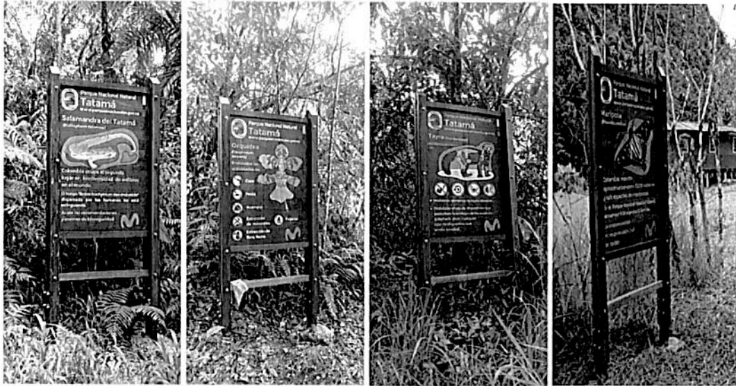
Imagen 1,2,3,4. Vallas – letreros de conservación de Fauna y Flora del PNN Tatamá por parte de Telefónica – Movistar.