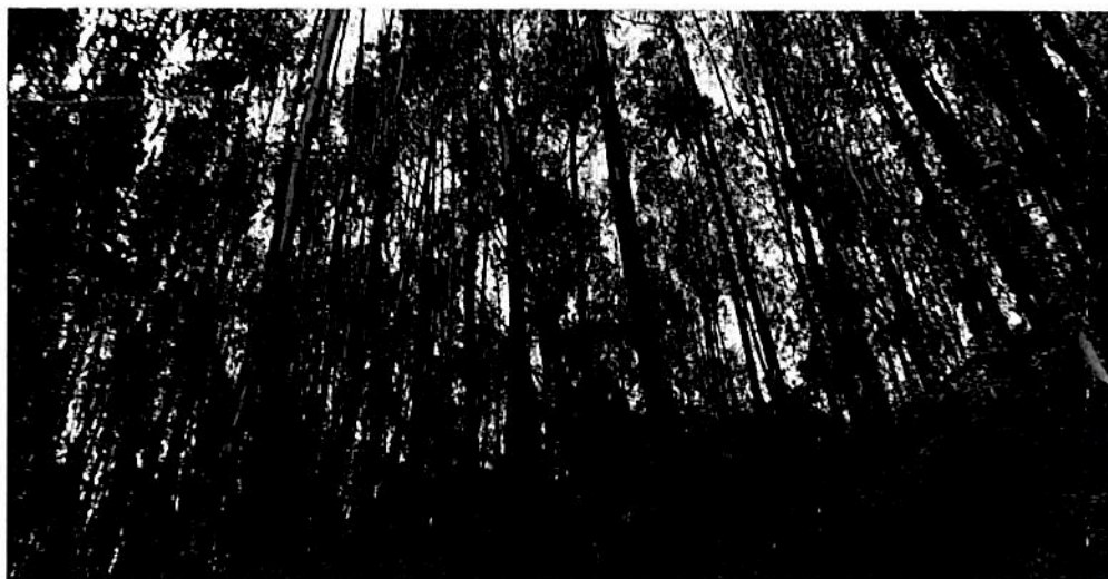
Figuras 1. Presencia de árboles de eucalipto en la parte coincidente con la zona de conservación registrada por medio de la Resolución 052 del 9 de abril de 2019.

Por lo tanto, la porción del predio recorrido y coincidente con el polígono registrado para el predio "SIN DIRECCIÓN LOTE 4", no cumple con los requisitos mínimos exigidos para continuar con el registro como Reserva Natural de la Sociedad Civil citados en el artículo 2.2.2.1.17.1, dado que no contiene una muestra de ecosistema natural.