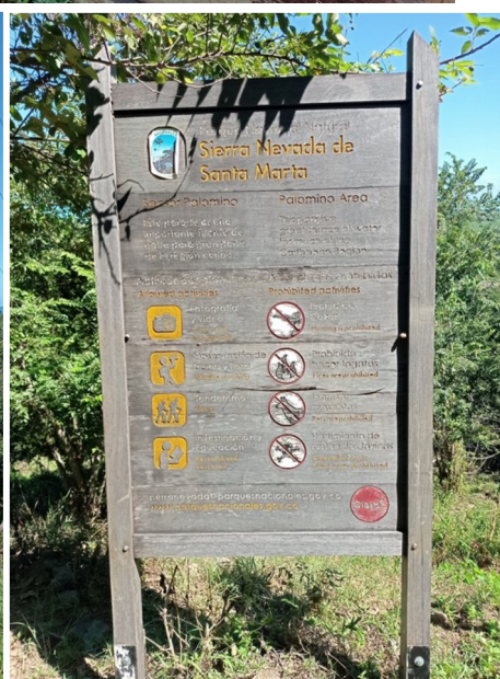
Imágenes 6, 7 y 8. Señales instaladas en el predio Palomino con alto grado de deterioro por intemperie