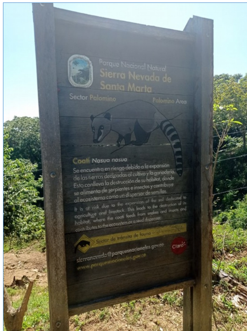
Imagen 1. Valla educativa sobre cuidado de especies de fauna con deterioro por la radiación solar y la lluvia

Se evidenció en campo que las señales y vallas informativas instaladas, que hacen alusión a la conservación de especies de fauna residente y/o migratoria se encuentran fuertemente deterioradas por la intemperie y el sol a que están expuestas (ver imagen 1.). Por lo anterior se requiere un mantenimiento correctivo urgente para frenar el deterioro o en su defecto la reposición de la señalización afectada.