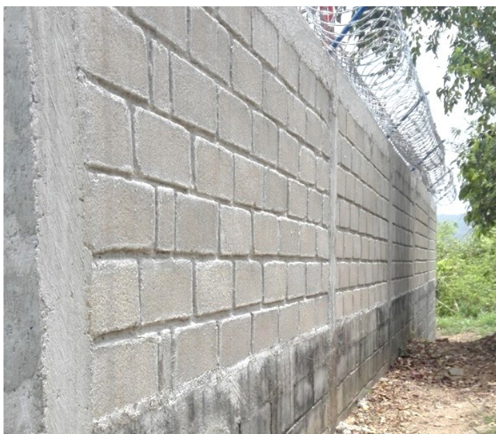
Imagen 3. Muro de cerramiento de la Estación Palomino.

Durante la salida de campo a las instalaciones (estación Palomino), se pudo evidenciar que el cerramiento de la estación, consistente en un muro en concreto con columnas fundidas en el mismo material, aparentemente buen estado y no ha sido objeto de vandalismo o de intento de daño para hurto de equipos. En la diligencia de campo no se registran eventos asociados al incumplimiento de esta ficha, que ameriten un requerimiento de parte de esta Autoridad Ambiental diferente al de acreditar los registros de esta ficha de manejo ambiental.