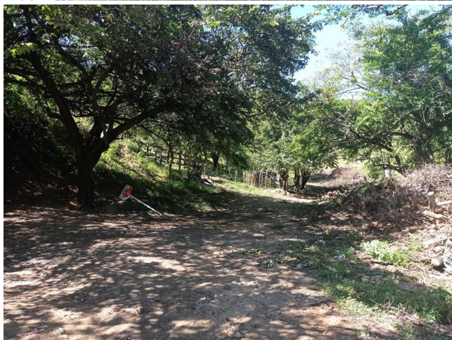
Imágenes 4 y 5. Hallazgos de siembra de cerca viva (limoncillo), corrales, así como madera talada y apilada - Estación Palomino