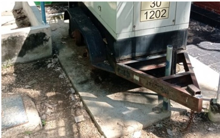
Imagen 2. Deterioro por oxidación de una planta (fuera de servicio) que puede generar contaminación por óxidos de la corrosión del material.

Se evidenció en la visita que varios equipos en desuso y partes de las obras civiles, así como del cuarto de equipos, presentan deterioro ya sea por oxidación o desgaste de la pintura de la superficie, lo que ocasiona la generación de vertimientos de agua con trazas metálicas producto de la lluvia, también se evidenció en la visita que no se tenían disponibles los registros de las acciones de monitoreo de los registros generados en el seguimiento ambiental de la estación. En la diligencia de campo no se registran eventos asociados al incumplimiento de esta ficha de manejo ambiental, que ameriten un requerimiento de parte de esta Autoridad Ambiental diferente al de acreditar los registros de esta ficha de manejo ambiental.