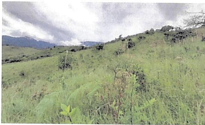
Imagen 4. Zona de Agrosistemas RNSC "LAS NUBES 4".

5.3. Zona de Agrosistemas: Esta zona corresponde a 4,7307 ha, equivalentes al 39,52% del área objeto de registro. Esta zona está conformada por coberturas de pastos, con algunas especies arbustivas, en ella se realizan principalmente actividades de ganadería de cría.