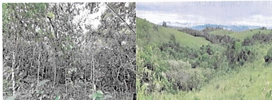
Imagen 1. Muestra de ecosistema natural presente en la RNSC "LAS NUBES 4".

De acuerdo con la visita técnica realizada a la RNSC "LAS NUBES 4", cuenta con una muestra de ecosistema natural representativa de Bosque Subandino y Bosque Ripario en un rango altitudinal de 1200 y 1390 metros de elevación sobre el nivel del mar aproximadamente. En la RNSC, se protege un tramo de la ronda de la quebrada La Chonta, importante fuente hídrica de la zona.