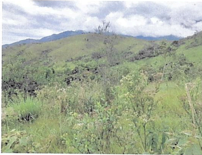
Imagen 3. Zona de Amortiguación y Manejo Especial RNSC "LAS NUBES 4".

5.2. Zona de Amortiguación y Manejo Especial: Esta zona corresponde a 0,1445 ha equivalentes al 1,21% área objeto de registro. Esta zona corresponde a una franja de transición entre la zona de conservación y la zona de agrosistemas, está conformada por herbazales y vegetación arbustiva.