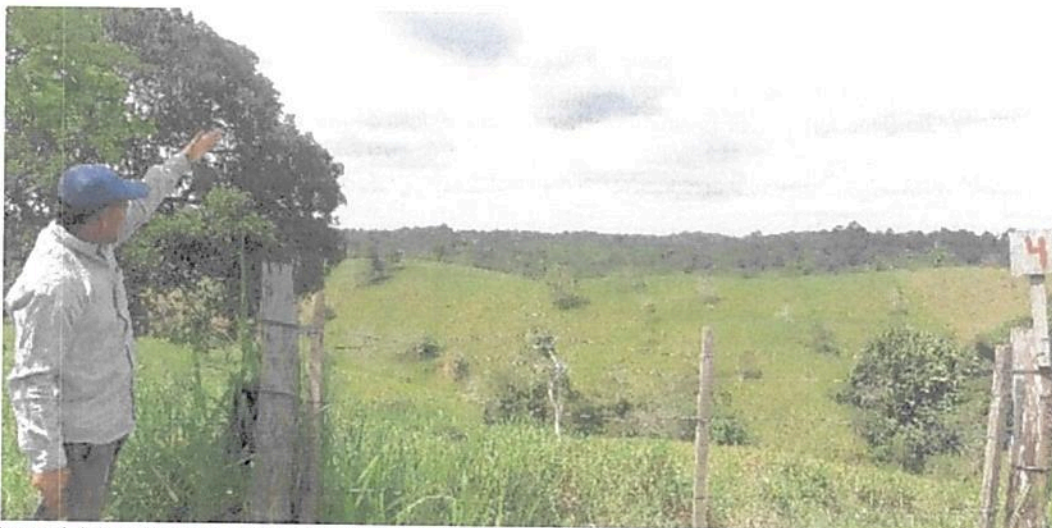
Figura 1. Vista General RNSC 101-21 LA ESPERANZA 1.