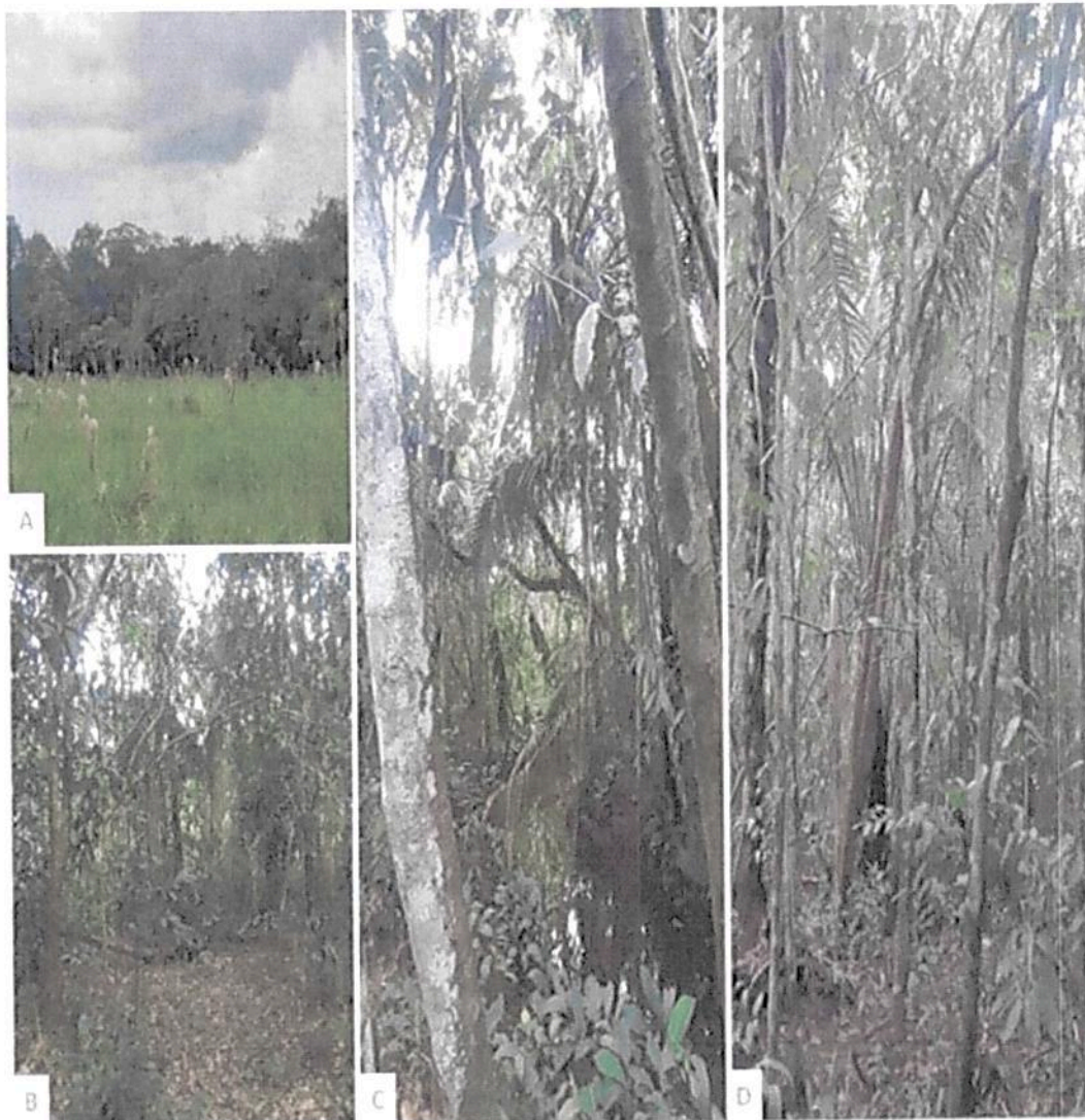
Figura 3. Zona de Conservación de la RNSC 101-21 LA ESPERANZA 1. A. Vista General de la zona de conservación. B. Borde de bosque. C. Cuerpo de agua presente en zona de conservación. D. Estructura del bosque en zona de conservación.

El área de conservación presenta una extensión de 8,8653 ha, correspondiendo al 17,7476% del total del área bajo registro. De acuerdo con lo evidenciado durante la visita técnica y los presentado por el usuario en la solicitud de registro, esta zona está conformada por bosque alto heterogéneo de tierra firme presente dentro del Bioma Bosque Húmedo Tropical (bh-T) inmerso en una matriz heterogénea de culturas y pastos, principalmente. El bosque corresponde a un estadio avanzado de regeneración presenta en general buen estado de conservación y mantiene gran parte de su composición, estructura y función (Figura 3). Es posible observar cuatro estratos en la vegetación, con predominio de árboles con DAP superior a 32cm.