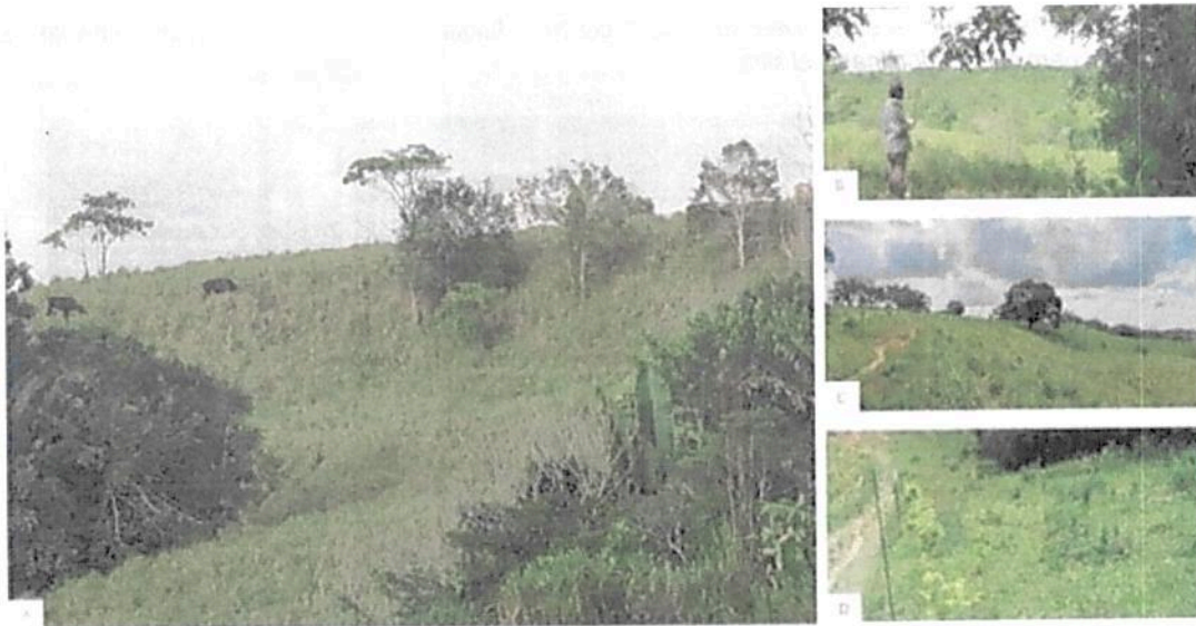
Figura 5. Zona de Agrosistemas de la RNSC 101-21 LA ESPERANZA 1. A. Vista General de la zona de Agrosistemas. B. Borde de pasturas con zona de bosque. C. Presencia de árboles aislados en potreros. D. Siembra de árboles para implementación de cercas vivas. Fuente: Visita Técnica realizada por Grupo de Trámites y Evaluación Ambiental – GTEA el 17/06/2022.