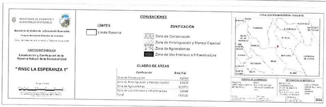
Figura 2. Zonificación de la RNSC 101-21 LA ESPERANZA 1. Fuente de información: Información técnica producto de la visita técnica por el GTEA, verificada y ajustada por PNN nivel central (Origen Único Nacional CTM12 2020).