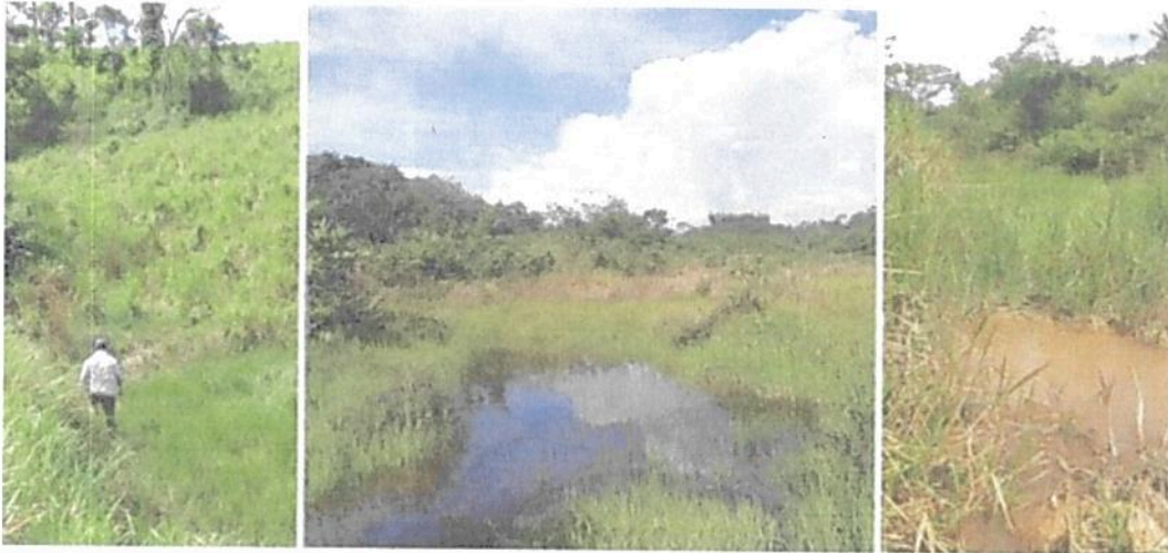
Figura 4. Zona de Amortiguación y Manejo Especial de la RNSC 101-21 LA ESPERANZA 1.

superficie aproximada de 2 Ha 5506,1 m 2 , y que albergan una gran cantidad de agua, así mismo el recurso hídrico de los caños (Figura 4) es aprovechado para el consumo humano, la recreación y el mantenimiento del sistema ganadero que predomina en el sitio.