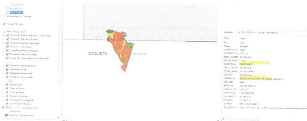
Figura 7. Verificación de traslapes del predio "Sin Dirección LA ESPERANZA 1" con área disponible.

El Grupo de Gestión del Conocimiento e Innovación, mediante correo electrónico del 13 de junio de 2022 informó que el predio denominado "Sin Dirección LA ESPERANZA 1" inscrito bajo el FMI 420-5263 no presenta traslapes con otras áreas del SINAP, con títulos Mineros, Comunidades Negras ni Resguardos Indígenas; sin embargo, presenta traslape con un área disponible para la exploración y/o explotación de hidrocarburos (Figura 7), de acuerdo con el Mapa de Tierras de la Agencia Nacional de Hidrocarburos 2022.