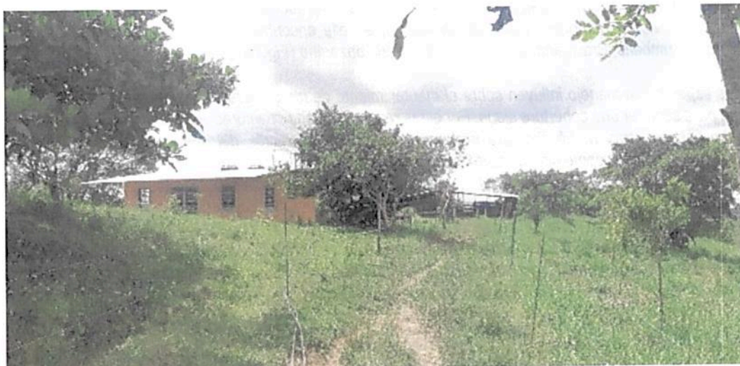
Figura 6. Zona de Uso Intensivo e infraestructura de la RNSC 101-21 LA ESPERANZA 1.

Esta zona presenta una extensión de 0,0988 ha y equivale al 0,1578% del total del área bajo registro. Esta área corresponde a la vivienda y la infraestructura asociada al manejo del ganado (corral) (Figura 6).