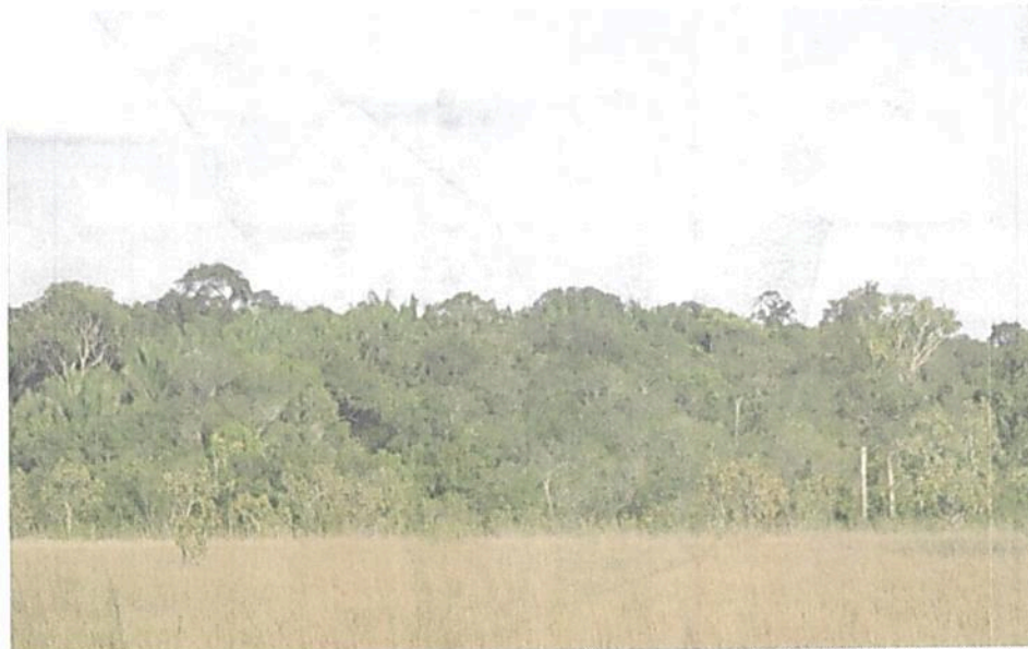
Figura 8. Zona de conservación presente en la RNSC "NÚCLEO DE RESERVAS PROYECTO AKAE - EL COCUY".

Por otra parte, la zona de conservación presente en la reserva contiene una gran biodiversidad, la cual es fácil de observar debido a que no existen presiones antrópicas fuertes que alteren o perturben el grado de conservación, lo cual lo hace un ecosistema estratégico único a nivel local, que conecta con otros relictos de bosque de galería aledaños al predio, lo que aumenta su nivel de importancia ambiental al ser un excelente corredor biológico.