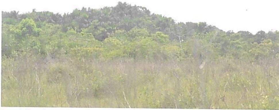
Figura 9. Zona de amortiguación y manejo especial presente en la RNSC "NÚCLEO DE RESERVAS PROYECTO AKAE - EL COCUY"