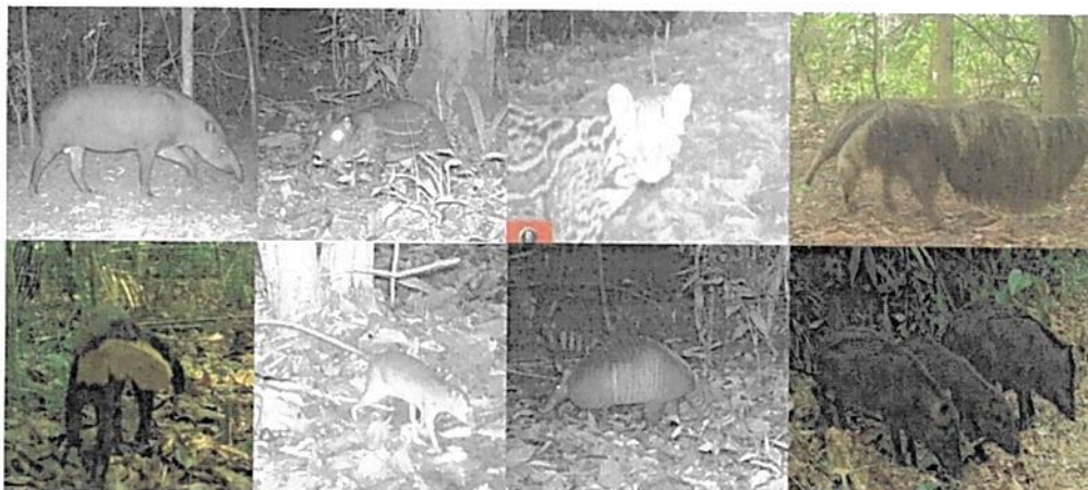
Figura 7. Especies de fauna registradas en la RNSC "NÚCLEO DE RESERVAS AKAE".