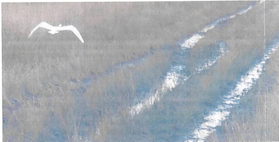
Figura 11. Zona de Uso Intensivo e Infraestructura presente en la RNSC "NÚCLEO DE RESERVAS PROYECTO AKAE - EL COCUY"

Esta zona corresponde al 1,56 % del total del área a registrar, presentando una extensión total de 19,5647 ha; sobre esta zona se encontraron diferentes caminos que pasan a otros predios de los mismos propietarios, además, de la presencia de pozos, y zonas que van a ser destinadas para diferentes construcciones como por ejemplo casas y zonas de pancoger.