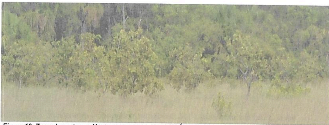
Figura 10. Zona de restauración presente en la RNSC "NÚCLEO DE RESERVAS PROYECTO AKAE - EL COCUY"

Esta zona corresponden al 26,26 % del total del área a registrar, presentando una extensión total de 328,5331 ha; en esta área se viene adelantando un proceso de restauración natural no asistida donde básicamente se ha dejado crecer la vegetación, la cual al cabo de 30 años ha logrado crecer, al punto de lograr reducir los espacios destinados para uso de agrosistemas, se espera que al cabo de varios años más esta zona se convierta en parte de la zona de conservación.