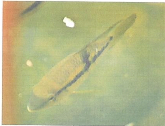
Figura 4. Peces observados en la RNSC "NÚCLEO DE RESERVAS AKAE".

Aves: "...Se registraron 168 especies de aves correspondientes a 22 órdenes y 50 familias (...). Por medio de observaciones y cantos se registraron 152 especies, de las cuales 110 fueron registradas exclusivamente por avistamientos, 10 especies por vocalizaciones y 145 tanto por observaciones como por vocalizaciones. Por medio de las redes de niebla se capturaron 20 especies..." 5 (Tabla 4)