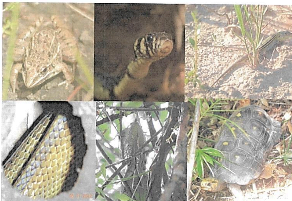
Figura 6: Anfibios y reptiles registrados en la RNSC "NÚCLEO DE RESERVAS AKAE".

Mamíferos: De acuerdo con el estudio adelantado por TNC Colombia y Fundación La Palmita (2022), en los predios que conforman el Núcleo de reservas AKAE "...En la reserva AKAE registramos un total de 11 órdenes de mamíferos, 21 familias y 63 especies (...). El mayor número de especies registradas correspondió a los murciélagos (Chiroptera) con 37 especies seguido de los roedores (Rodentia) con 6 especies, mientras que el resto de los órdenes estuvo representado por menos de 5 especies..." (Tabla 6)