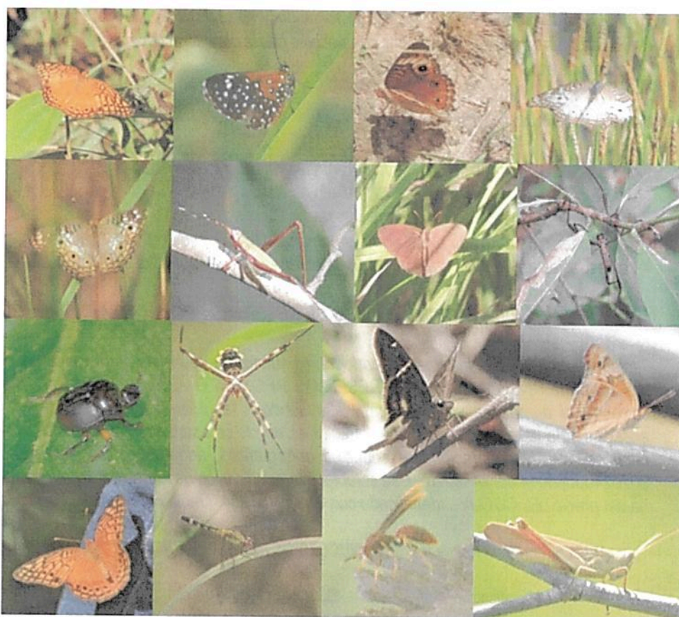
Figura 8: Artrópodos registrados en la RNSC "NÚCLEO DE RESERVAS AKAE".