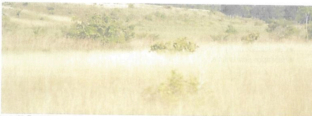
Figura 11. Zona de agrosistemas presente en la RNSC "NÚCLEO DE RESERVAS PROYECTO AKAE - EL COCUY"

Esta zona corresponde al 48,63 % del total del área a registrar, presentando una extensión total de 608,3809 ha; esta zona se está aprovechando para el pastoreo de algunos animales.