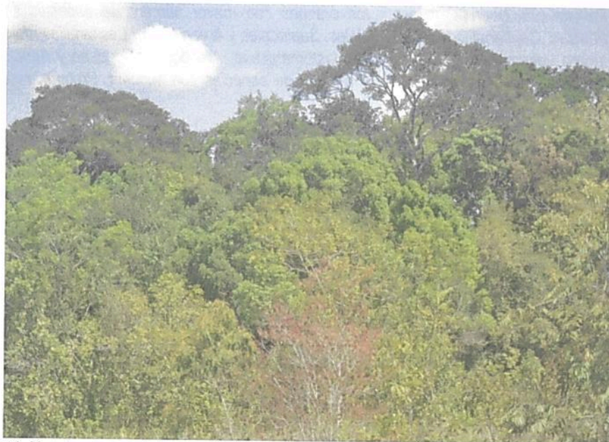
Figura 1. Muestra de ecosistema natural presente en la RNSC "NÚCLEO DE RESERVAS PROYECTO AKAE - EL COCUY".

De acuerdo con el estudio adelantado por TNC (2022) 2 en el núcleo de reservas proyecto Akae, se muestrearon las coberturas de bosque de galería, bosque de tierra firme, sabana, sabana inundable, morichal, saladillal y diferentes ecotonos.