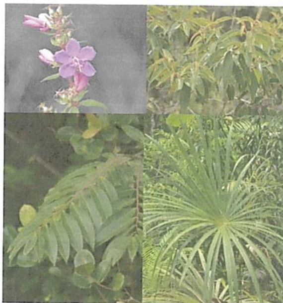
Figura 2. Flora observada en la RNSC "NÚCLEO DE RESERVAS AKAE".