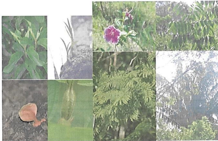
Figura 3. Flora observada en la RNSC "NÚCLEO DE RESERVAS AKAE".