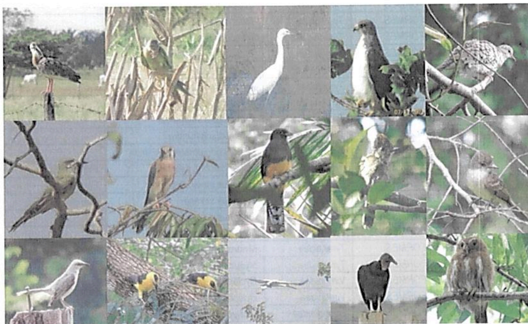
Figura 5: Aves registradas en la RNSC "NÚCLEO DE RESERVAS AKAE".

Anfibios y reptiles: De acuerdo con el estudio adelantado por TNC Colombia y Fundación La Palmita (2022), en los predios que conforman el Núcleo de Reservas AKAE, se realizaron varios muestreos en zonas naturales de los predios encontrándose 15 especies de reptiles (4 de lagartos, 7 serpientes, 2 tortugas y una especie del orden Crocodylia) y 13 especies de anfibios, todas del orden Anura. En el inventario se registraron 12 especies de anfibios. (Tabla 5)