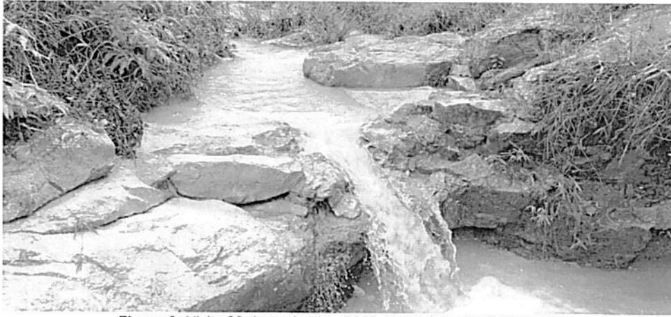
Figura 2: Visita 29 de noviembre 2022 ANU LOS ESTORAQUES.

Desarenador: Es una estructura que, en el momento de la visita, se encuentra suspendida hasta no se autorice la concesión por Parques Nacionales Naturales de Colombia, de igual manera, se determinó que está adecuado para pretratamiento mediante una reducción de la velocidad, la cual retira del agua, arenas y material flotante. El desarenador cuenta con las siguientes dimensiones: 1,30 m de largo y 0,70 m de ancho. Además, cuenta con una entrada de diámetro de 2 pulgadas, la cual corresponde a la línea de aducción entre bocatoma y desarenador, cuenta con un vertedero de excesos del cual sale para una tubería de diámetro de 1 pulgada, lo observado en la visita, está estructura tiene riesgo de que interrumpa el servicio del recurso, ya que se encuentra en una ladera, donde el material granular se desprende y cubre el compartimiento de la restitución de sobrantes y desarenador.