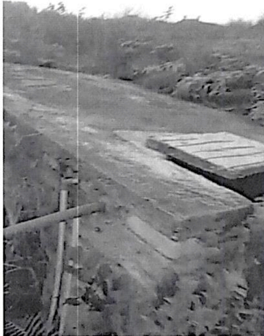
Figura 4: Primer tanque de almacenamiento.

2. El segundo tanque de almacenamiento y distribución está ubicado dentro del predio “FINCA VISTA HERMOSA”, el cual informo el solicitante, se está adecuando para su puesta en marcha.