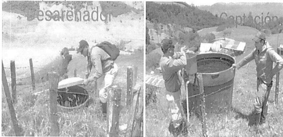
Imagen 1: Desarenador y tanque de captación.

Actualmente, en las visitas de seguimiento remitidas al Grupo de Trámites y Evaluación Ambiental se evidencia el cumplimiento de la adecuación de obras, se debe tener registro fotográfico del funcionamiento del micromedidor el cuál fue retirado por ocasionar taponamiento en los tubos de conducción del agua, autorizado anteriormente por Parques Nacionales Naturales de Colombia.