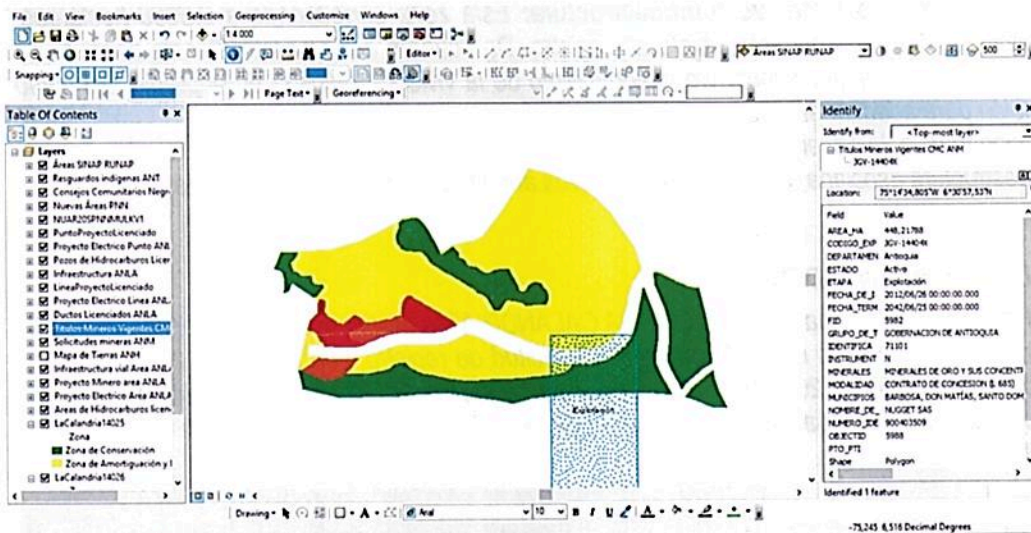
Figura 1. Traslape de los predios "La Eme" identificado con FMI No. 026-14025 y "La Eme" identificado con FMI No. 368-31526.

La profesional de apoyo cartográfico del Grupo de Trámites y Evaluación Ambiental -GTEA, mediante correo electrónico de fecha 01 de julio de 2022 informó que los predios denominados "La Eme" identificado con FMI No. 026-14025 y "La Eme" identificado con FMI No. 026-14026 no se traslapan con Comunidades Negras, áreas SINAP, Solicitudes Mineras a la fecha; no obstante, presenta traslape con Título Minero vigente a cargo de la empresa Nugget S.A. (Figura 1)