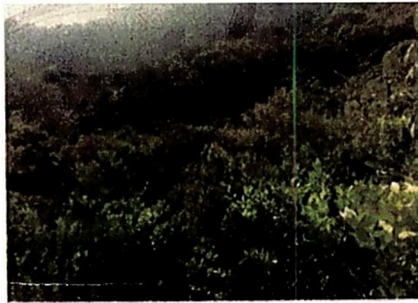
Figura 1. Muestra de ecosistema natural presente.

De acuerdo con la información suministrada por CORNARE: "... La reserva "La Calandria" se encuentra en la zona de vida de Bosque muy Húmedo – Premontano (bmh-PM). El lugar se encuentra a una altitud de 1300 msnm, cuenta con una precipitación media anual promedio entre 2000 y 4000 mm, una temperatura promedio de 24 °C..."