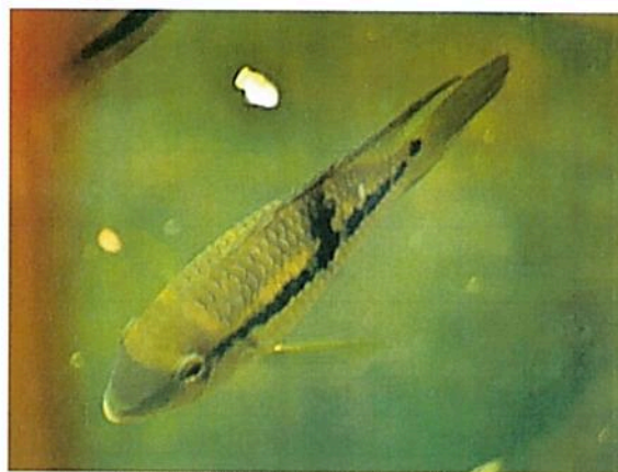
Figura 4. Peces observados en la RNSC "NÚCLEO DE RESERVAS AKAE".

Aves: "...Se registraron 168 especies de aves correspondientes a 22 órdenes y 50 familias (...). Por medio de observaciones y cantos se registraron 152 especies, de las cuales 110 fueron registradas exclusivamente por avistamientos, 10 especies por vocalizaciones y 145 tanto por observaciones como por vocalizaciones. Por medio de las redes de niebla se capturaron 20