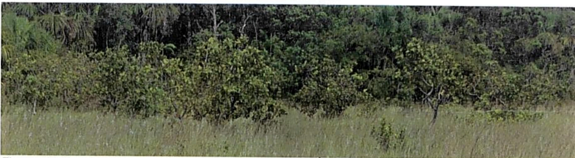
Figura 10. Zona de restauración presente en la RNSC "NÚCLEO DE RESERVAS PROYECTO AKAE - EL HORMIGUERO"

Esta zona corresponden al 19,83 % del total del área a registrar, presentando una extensión total de 249,2965 ha; en esta área se viene adelantando un proceso de restauración natural no asistida donde básicamente se ha dejado crecer la vegetación, la cual al cabo de 30 años ha logrado crecer, al punto de lograr reducir los espacios destinados para uso de agrosistemas, se espera que al cabo de varios años más esta zona se convierta en parte de la zona de conservación.