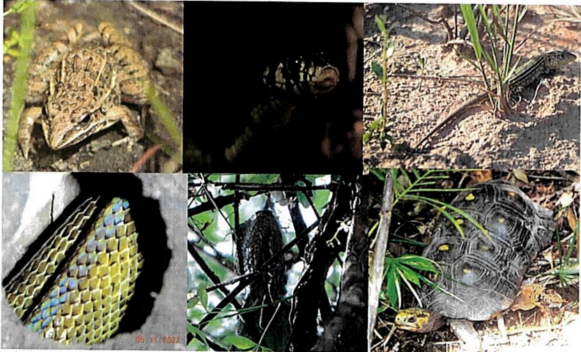
Figura 6: Anfibios y reptiles registrados en la RNSC "NÚCLEO DE RESERVAS AKAE".

Mamíferos: De acuerdo con el estudio adelantado por TNC Colombia y Fundación La Palmita (2022), en los predios que conforman el Núcleo de reservas AKAE "...En la reserva AKAE registramos un total de 11 órdenes de mamíferos, 21 familias y 63 especies (...). El mayor número de especies registradas correspondió a los murciélagos (Chiroptera) con 37 especies seguido de los roedores (Rodentia) con 6 especies, mientras que el resto de los órdenes estuvo representado por menos de 5 especies..." (Tabla 6)