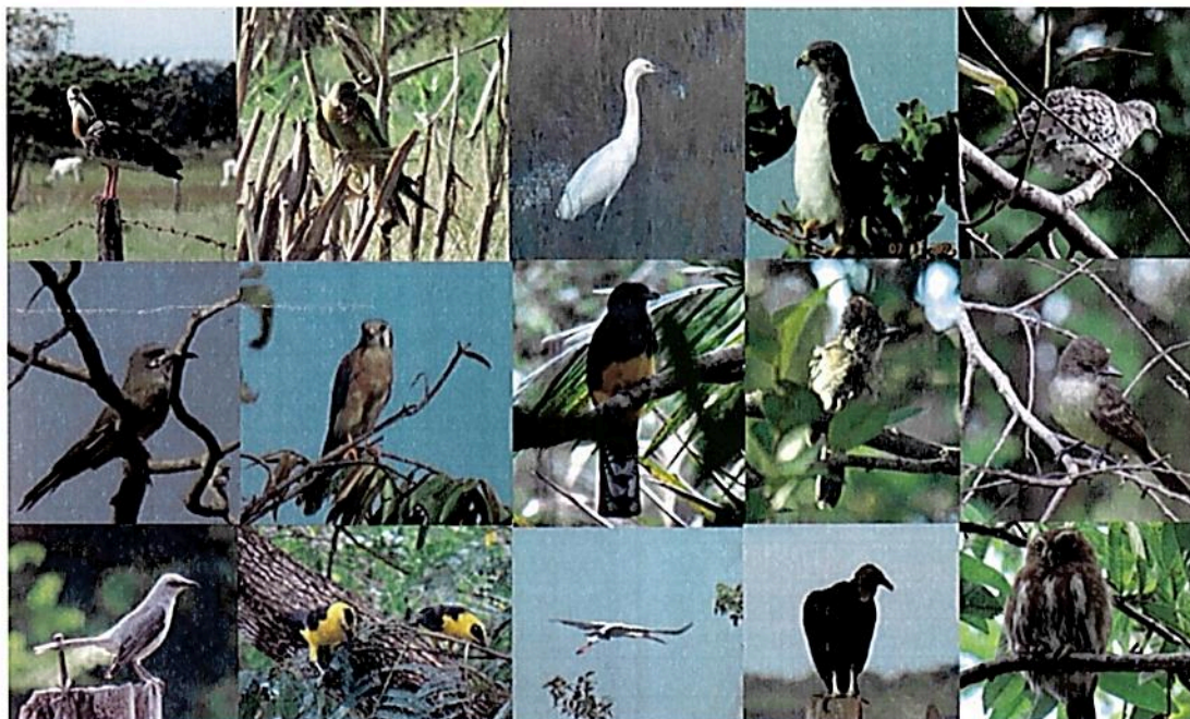
Figura 5: Aves registradas en la RNSC "NÚCLEO DE RESERVAS AKAE".

Anfibios y reptiles: De acuerdo con el estudio adelantado por TNC Colombia y Fundación La Palmita (2022), en los predios que conforman el Núcleo de Reservas AKAE, se realizaron varios muestreos en zonas naturales de los predios encontrándose 15 especies de reptiles (4 de lagartos, 7 serpientes, 2 tortugas y una especie del orden Crocodylia) y 13 especies de anfibios, todas del orden Anura. En el inventario se registraron 12 especies de anfibios. (Tabla 5)