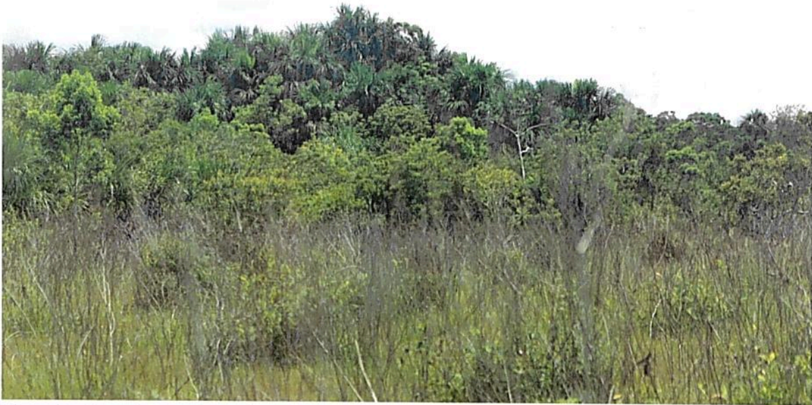
Figura 9. Zona de amortiguación y manejo especial presente en la RNSC "NÚCLEO DE RESERVAS PROYECTO AKAE - EL HORMIGUERO"