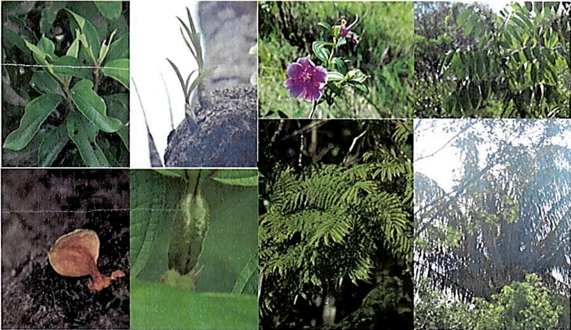
Figura 3. Flora observada en la RNSC "NÚCLEO DE RESERVAS AKAE".