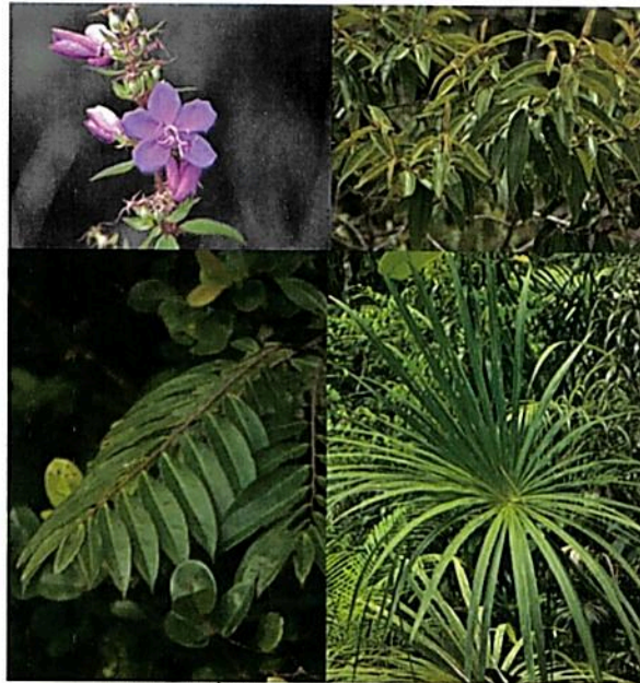
Figura 2. Flora observada en la RNSC “NÚCLEO DE RESERVAS AKAE”.