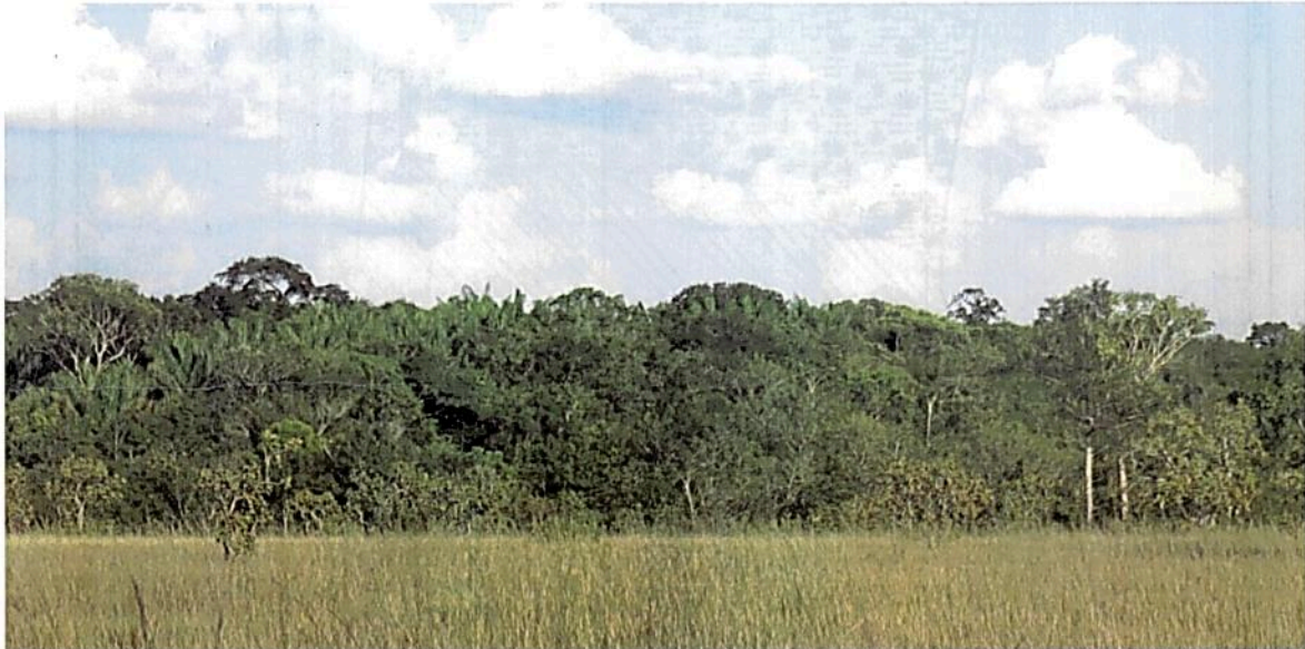
Figura 8. Zona de conservación presente en la RNSC "NÚCLEO DE RESERVAS PROYECTO AKAE - EL HORMIGUERO".

Por otra parte, la zona de conservación presente en la reserva contiene una gran biodiversidad, la cual es fácil de observar debido a que no existen presiones antrópicas fuertes que alteren o perturben el grado de conservación, lo cual lo hace un ecosistema estratégico único a nivel local, que conecta con otros relictos de bosque de galería aledaños al predio, lo que aumenta su nivel de importancia ambiental al ser un excelente corredor biológico.