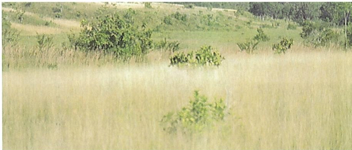
Figura 11. Zona de agrosistemas presente en la RNSC "NÚCLEO DE RESERVAS PROYECTO AKAE - EL HORMIGUERO"