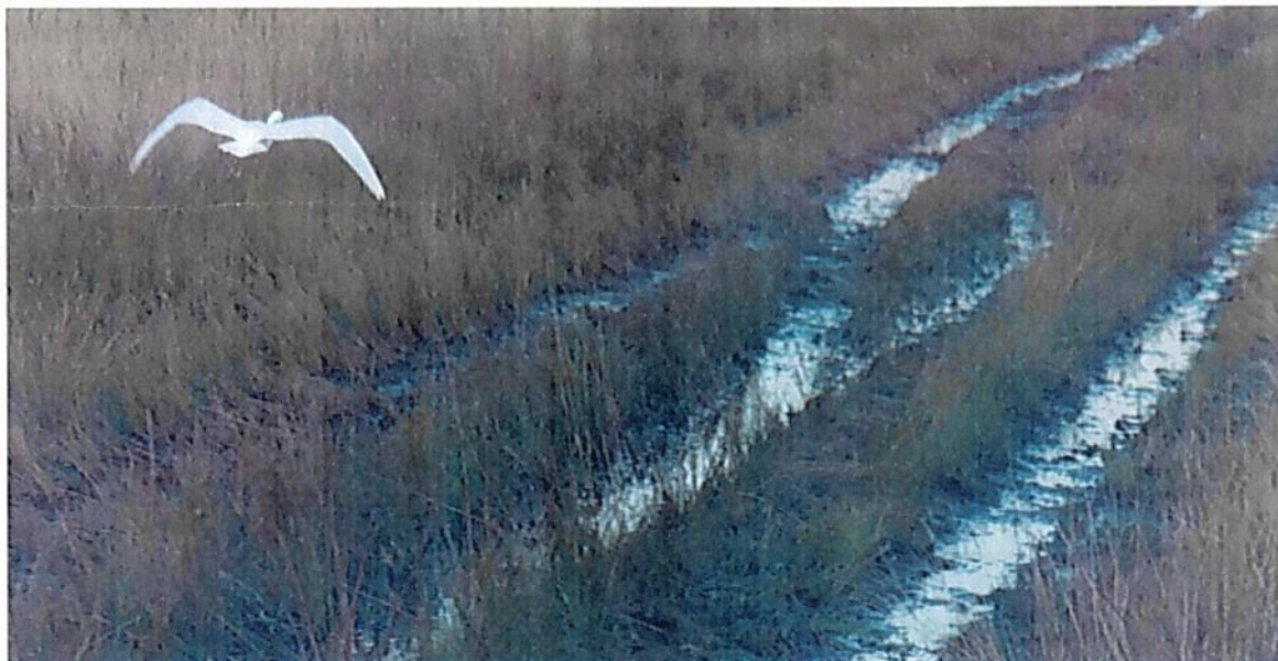
Figura 11. Zona de Uso Intensivo e Infraestructura presente en la RNSC "NÚCLEO DE RESERVAS PROYECTO AKAE - EL HORMIGUERO" Fuente: visita técnica PNNC 4 al 12/10/2022.

Esta zona corresponde al 1,46 % del total del área a registrar, presentando una extensión total de 18,3990 ha; sobre esta zona se encontraron diferentes caminos que pasan a otros predios de los mismos propietarios, además, de la presencia de pozos, y zonas que van a ser destinadas para diferentes construcciones como por ejemplo casas y zonas de pancoger.