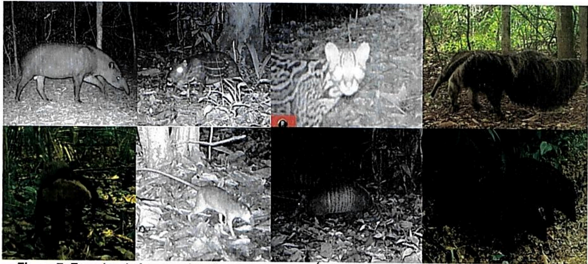
Figura 7. Especies de fauna registradas en la RNSC "NÚCLEO DE RESERVAS AKAE".