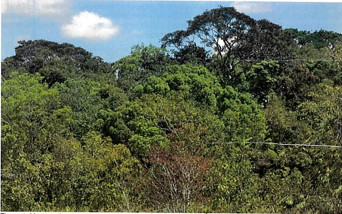
Figura 1. Muestra de ecosistema natural presente en la RNSC "NÚCLEO DE RESERVAS PROYECTO AKAE - EL HORMIGUERO".

De acuerdo con el estudio adelantado por TNC (2022) 2 en el núcleo de reservas proyecto Akae, se muestrearon las coberturas de bosque de galería, bosque de tierra firme, sabana, sabana inundable, morichal, saladillal y diferentes ecotonos.