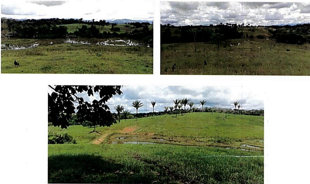
Figura 3. Fuentes de agua presentes en la Finca Villanueva - La Esmeralda

Se ha propuesto una zona amortiguación y de manejo especial de 8,2098 ha, conformada por caños, cananguchales y humedales. Se identifican 5 humedales (sin nombre), 5 nacimientos de agua, se ha organizado 3 represas - reservorios de agua. Se evidencia la apuesta por la protección de fuentes hídricas y recuperación de humedales, junto con la implementación de 6 franjas de recuperación de 6 m de ancho, que favorece la conectividad entre el bosque y las fuentes hídricas en estas secciones del predio, con especies maderables de la región, esto se ha venido trabajando en los últimos 8 años por parte del propietario, existen zonas sin vegetación protectora, por lo que se recomienda continuar con las medidas para el enriquecimiento y recuperación de las rondas. Las quebradas La Peneya y Agua Azúl que pasan por el predio son afluentes de la quebrada Agua Caliente que desemboca en el río Bodoquero. De estas fuentes se capta el agua para el consumo en la finca. Esta zona contempla franjas de protección a cada lado de las vías presentes en la reserva, con el propósito de reducir los impactos asociados al flujo de vehículos.