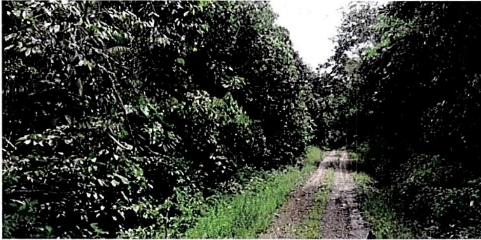
Figura 4. Zona Amortiguación vía aledaño a la vía terciaria. Fuente: Visita técnica PNN Alto Fragua Indi Wasi.