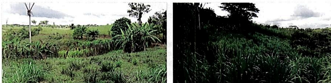
Figura 6. Zona de Agrosistemas. Fuente: Visita técnica PNN Alto Fragua Indi Wasi.