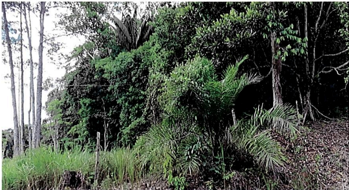
Figura 2. Zona de conservación de la Finca Villanueva La Esmeralda y fuentes hídricas.

De acuerdo al ejercicio de caracterización realizado por el Comité de Ganaderos del Caquetá en el marco del Programa Conservación y Gobernanza en el Piedemonte Amazónico, en el predio se encontraron 56 especies de aves y 13 de herpetos, 17 mamíferos (voladores y no voladores); en flora se han identificado 38 géneros agrupados en 25 familias de especies arbustivas.