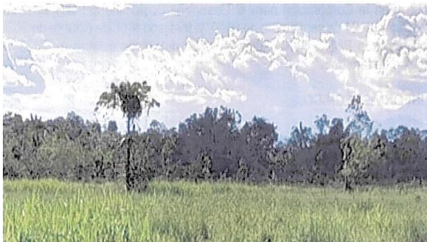
Imagen 1. Muestra de ecosistema natural presente.