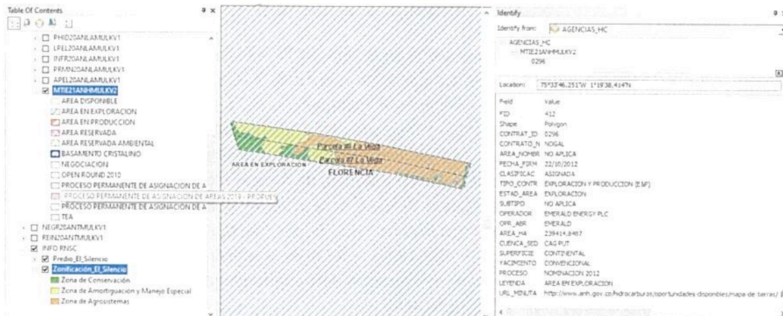
Figura 2. Traslape de los predios "Parcela No.8" identificado con FMI No. 420-60884 y "Parcela #7" identificado con FMI No. 420-49011 con área en exploración y producción Nogal. Fuente: Agencia Nacional de Hidrocarburos – ANH (Mapa de tierras 2022).

Por lo anterior, mediante radicado No. 20222300097821, de fecha 28 de septiembre de 2021, el Grupo de Trámites y Evaluación Ambiental, solicitó información a la empresa EMERALD ENERGY PLC COLOMBIA, sobre si se tiene contemplada la realización de las actividades asociadas a la exploración y/o producción de hidrocarburos, al interior de los predios objeto de registro como RNSC. De dicha comunicación no se cuenta con respuesta a la fecha.