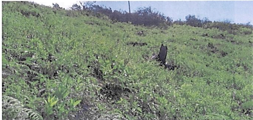
Figura 5. Evidencia de tala y presencia de plantas herbáceas rastreras y helechos pioneros en la parte destinada a la zona de conservación del predio "Lucitania".

Por tanto, el área del predio recorrido y coincidente con el polígono catastral del predio "Lucitania" y el polígono suministrado por el usuario no cumple con los requisitos mínimos exigidos para el registro como Reserva Natural de la Sociedad Civil citados en el artículo 2.2.2.1.17.1, dado que no contiene una muestra de ecosistema natural.