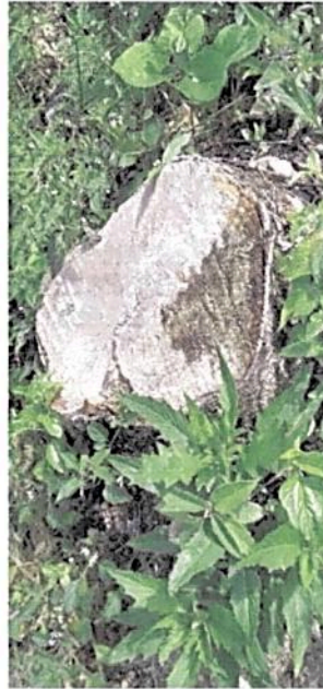
Figura 4. Evidencia de tala en la parte destinada a la zona de conservación del predio "Lucitania".