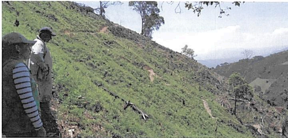
Figura 2. Presencia de tala en la parte destinada a la zona de conservación del predio "Lucitania".

Ahora bien, y de acuerdo con lo observado en campo para el área visitada, se evidenció que ésta no contiene una muestra de ecosistema natural. Dado que se encontró evidencia de tala de los árboles de roble y arrayán que formaban parte de la cobertura boscosa destinada a la zona de conservación; así como una composición de plantas de café, plátano, helechos y plantas pioneras ubicados en esta parte del predio, cabe mencionar que los cultivos son objeto de limpiezas o retiros de malezas (Figuras 1, 2, 3, 4 y 5).