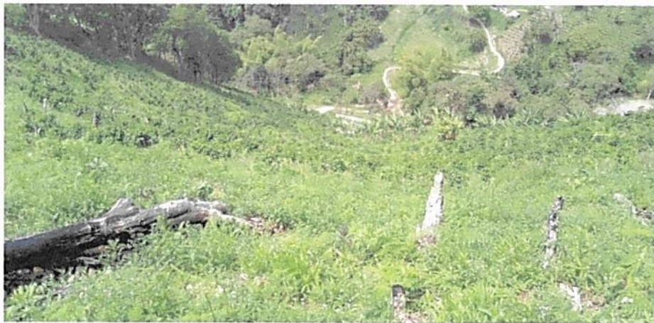
Figura 3. Detalle de la presencia de helechos y plantas pioneras, así como de las plantas de plátano y café sembradas en la zona talada de la parte destinada a la zona de conservación del predio "Lucitania". Fuente: visita técnica PNNC 23 de agosto de 2022.