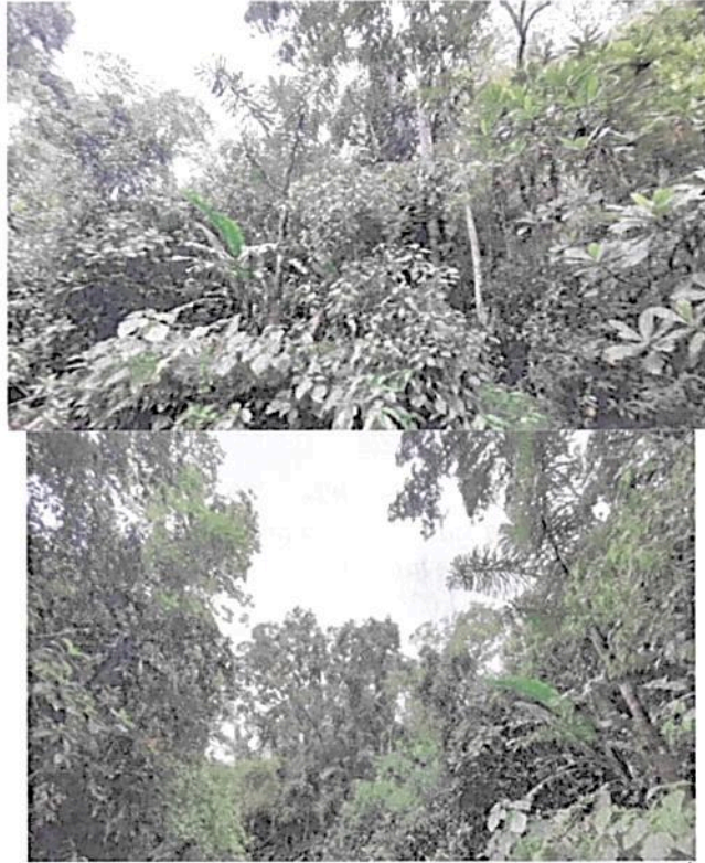
Imagen 1. Muestra de ecosistema natural presente en la RNSC "JERUSALEN".

La RNSC, protege parte de la ronda de la quebrada La Honda, importante fuente hídrica de la región; así mismo, dada su topografía ondulada, posee zonas de alta recarga hídrica cuya vegetación se encuentra en proceso de regeneración natural.