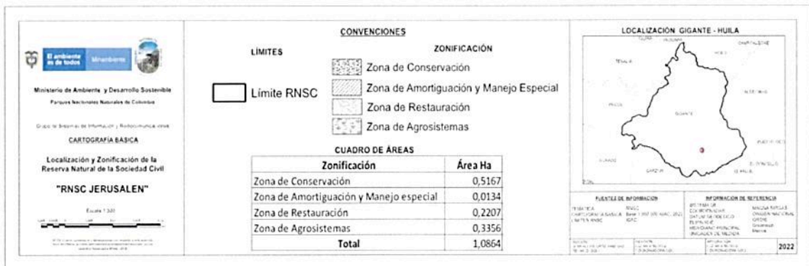
Figura 1. Zonificación propuesta para la RNSC "JERUSALEN" de acuerdo con la sección 17 del Decreto 1076 de 2015.