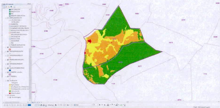
Tabla de áreas de zonificación.