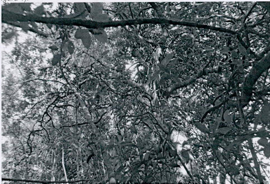
Figura 1. Muestra ecosistémica de bosque seco montano bajo (bs-MB) para el predio objeto de modificación del registro.

De acuerdo con lo anterior y con la visita técnica efectuada al predio identificado con 50C-1828277, se verificó que actualmente mantienen la muestra de ecosistema natural propia del bosque seco Montano bajo (bs-MB) identificado en el artículo segundo de la Resolución de registro No 214 del 28 de diciembre de 2018 (Figura 1).