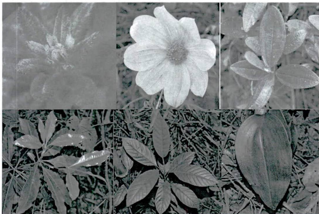
Figura 3. Muestra de vegetación presente en la RNSC.