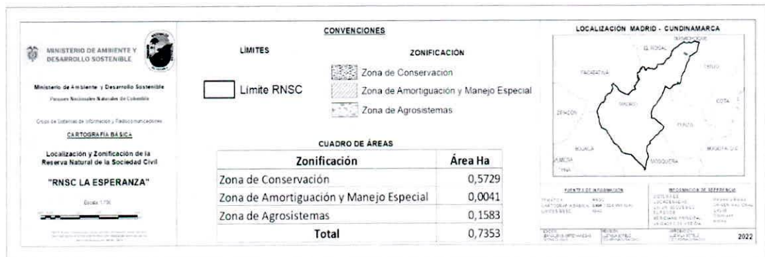
Figura 7. Nueva zonificación de la Reserva Natural de la Sociedad Civil "LA ESPERANZA".