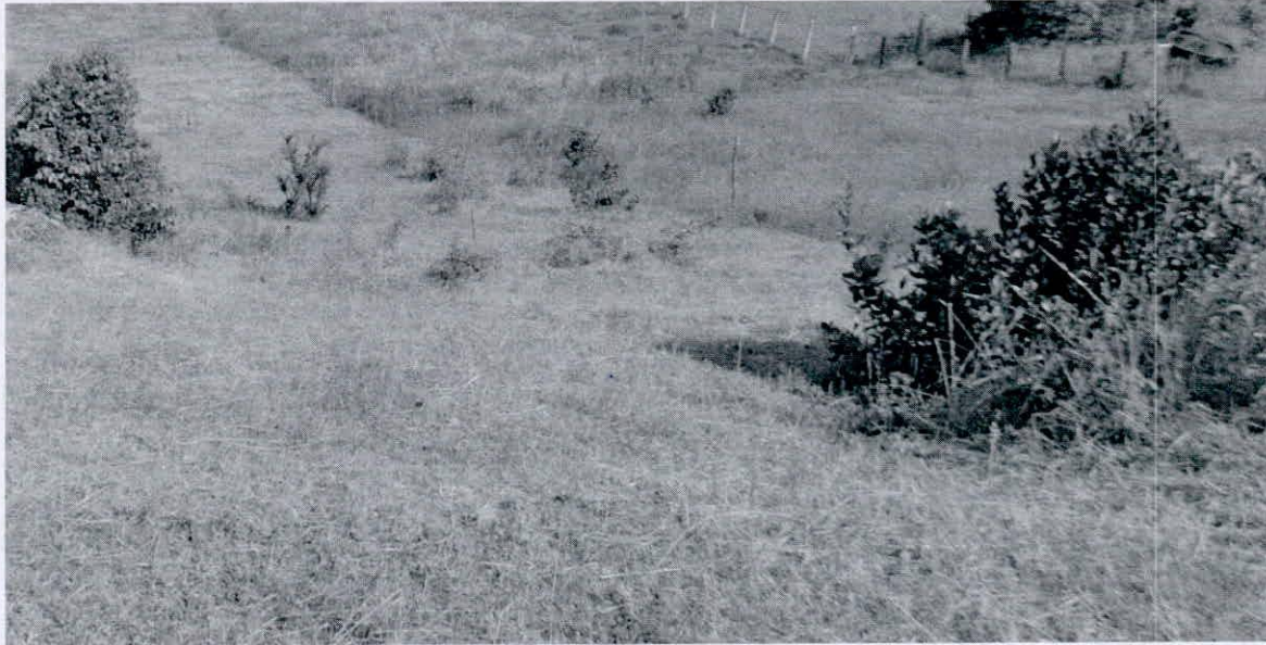
Figura 4. Vista general de uno de algunos sectores del área de agrosistemas en la RNSC "LA ESPERANZA".