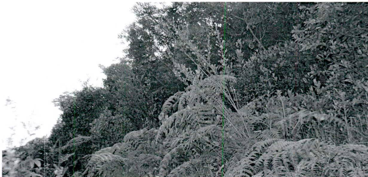
Figura 4. Vista general de uno de algunos sectores del área de conservación en la RNSC "LA ESPERANZA".

Esta zona corresponde al 77,91 % del total del área a registrar, presentando una extensión total de 0,5729 ha. Conformada por una muestra de ecosistema natural de bosque seco montano bajo (bs-MB) en un muy buen grado de conservación, sin embargo, se recomienda que sobre esta no se realicen actividades de aprovechamiento de madera para usos comerciales. Además, es importante mencionar que se debe realizar el control de especies invasoras como el retamo liso, eucalipto, acacia y otras especies.