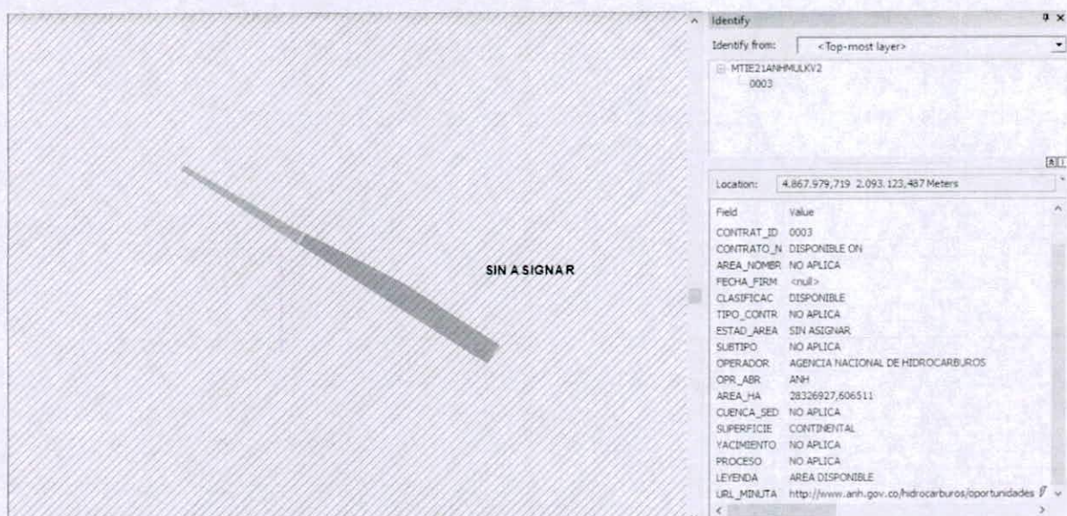
Figura 8. Traslape de la reserva "LA ESPERANZA" con un área sin asignar.

Por lo tanto, se considera viable continuar con el registro de la Reserva Natural de la Sociedad Civil "LA ESPERANZA"