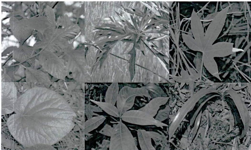
Figura 2. Muestra de vegetación presente en la RNSC.