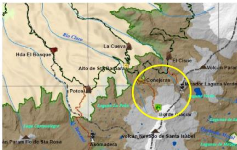
Mapa 3. Ruta para realizar al interior del PNN Los Nevados.

El trayecto establecido para realizar el proyecto al interior del Parque será en el centro de visitantes El Cisne - Laguna Verde- Sendero Conejeras-Cumbre Nevado Santa Isabel. Estos sectores se encuentran clasificados bajo la categoría de Zona de Recreación General Exterior; de acuerdo con la zonificación establecida en el Plan de Manejo del Parque Nacional Natural Los Nevados 2017 – 2022 y el Plan de Ordenamiento Ecoturístico del Área Protegida. La realización de actividades de alta montaña, escalada, fotografía y video son compatibles para la Zona de Recreación General Exterior, zonificación que vincula el sector Nevado Santa Isabel en el cual se pretende realizar el proyecto.