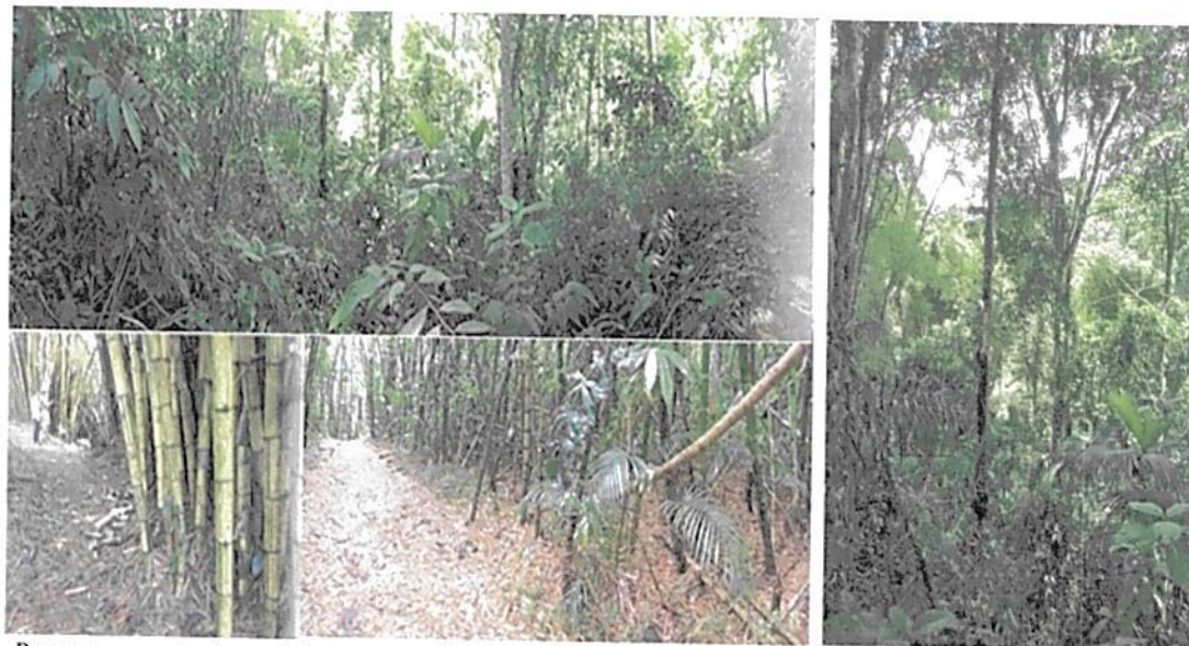
Bosque con estratos arbóreos y guaduales en la zona de conservación del Club Campestre Pereira

En las áreas de pastos con presencia de árboles se demarcarán áreas para restauración que permitan la conectividad con la zona de conservación. Las áreas para restauración se definirán posteriormente en el marco de la planeación de los próximos años del Club Campestre.