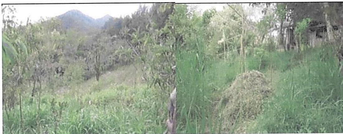
Figura 6. Zona de Amortiguación y Manejo Especial RNSC "LA BUENAVENTURA, GRANJA ESCUELA".

Esta zona corresponde al 15% del área total a registrar, es decir a 0,2576 ha y está compuesta por la presencia y la mezcla de especies introducidas y nativas para conformar cercas vivas; también se encuentran acá coberturas relacionadas con la delimitación de algunas zonas del bosque y también para la recuperación de los retiros de cuerpos de agua. Esta zona se destinará para: la siembra de especies maderables, la extracción de madera, la siembra de especies de plantas no nativas (frutales, ornamentales), adecuación para el manejo de guadua y bambú, restauración de zonas de retiros de agua y establecimiento de estanques.