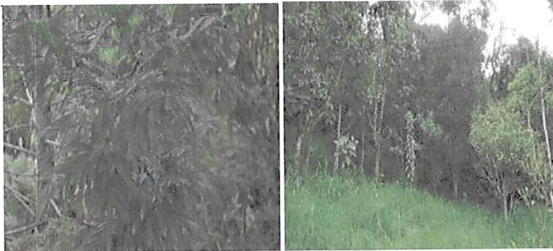
Figura 4. Zona de conservación RNSC "LA BUENAVENTURA, GRANJA ESCUELA".

Esta zona corresponde a 0,6409 ha del predio "LOTE." identificado con FMI No. 020-180026, es decir 39% del área objeto de registro y corresponde a la muestra ecosistémica Bosque Muy Húmedo – Montano Bajo (bmh-MB) representado por una cobertura de vegetación secundaria alta, donde busca proveer refugio para la fauna, permitir su sano esparcimiento y monitoreo de fauna nativa.