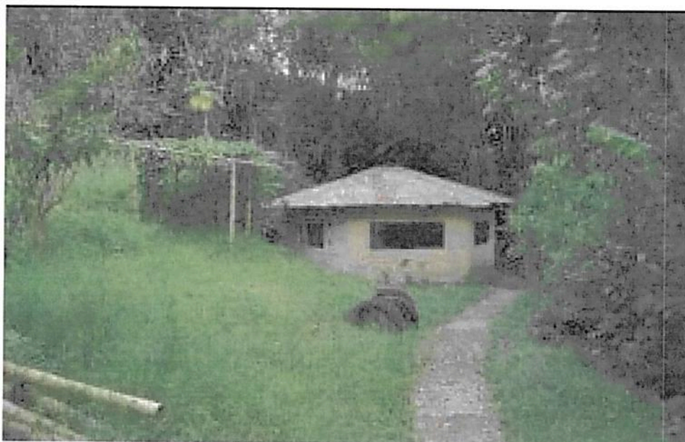
Figura 7. Zona de Uso Intensivo e Infraestructura RNSC "LA BUENAVENTURA, GRANJA ESCUELA".

Esta zona corresponde al 6% del área total a registrar, es decir a 0,1002 ha y está compuesta por una vivienda, donde se busca impulsar técnicas de bioconstrucción, adecuación y mantenimiento de vías de acceso, construcción y mejora de infraestructura dura, cultivo y desarrollo de jardines orgánicos.