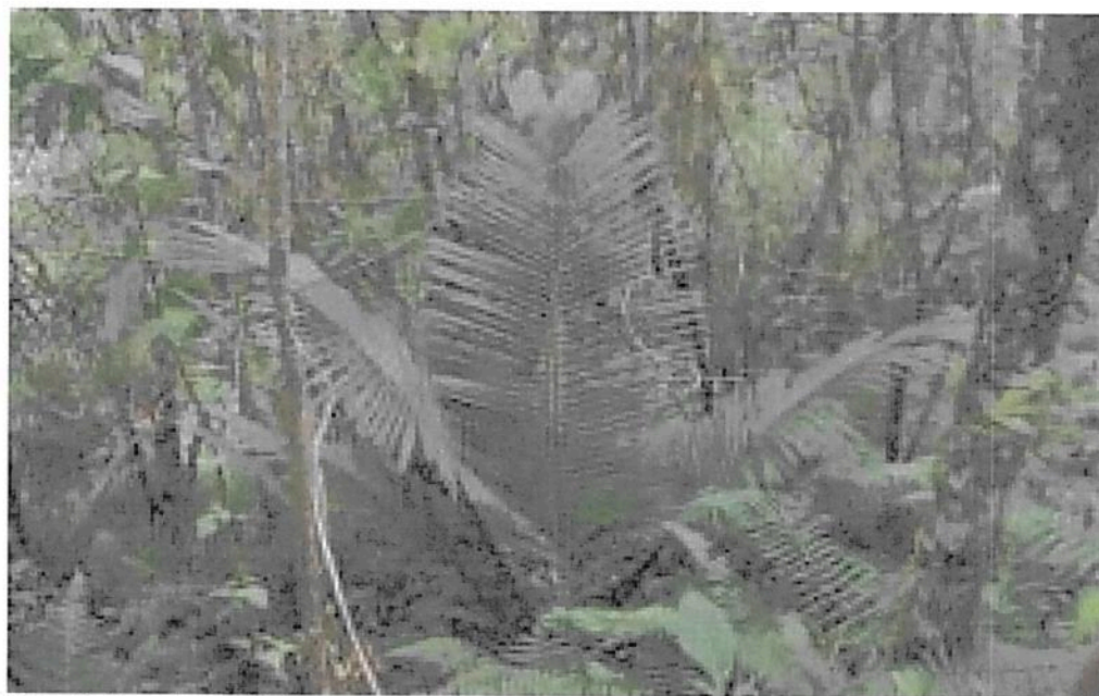
Figura 2. Flora observada de conservación RNSC "LA BUENAVENTURA, GRANJA ESCUELA".