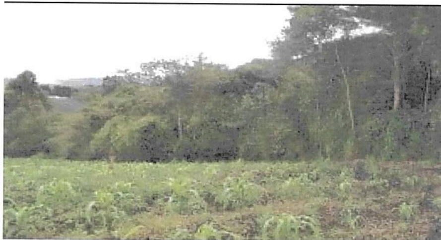
Figura 5. Zona de Agrosistemas RNSC "LA BUENAVENTURA, GRANJA ESCUELA". Fuente: Visita técnica CORNARE.