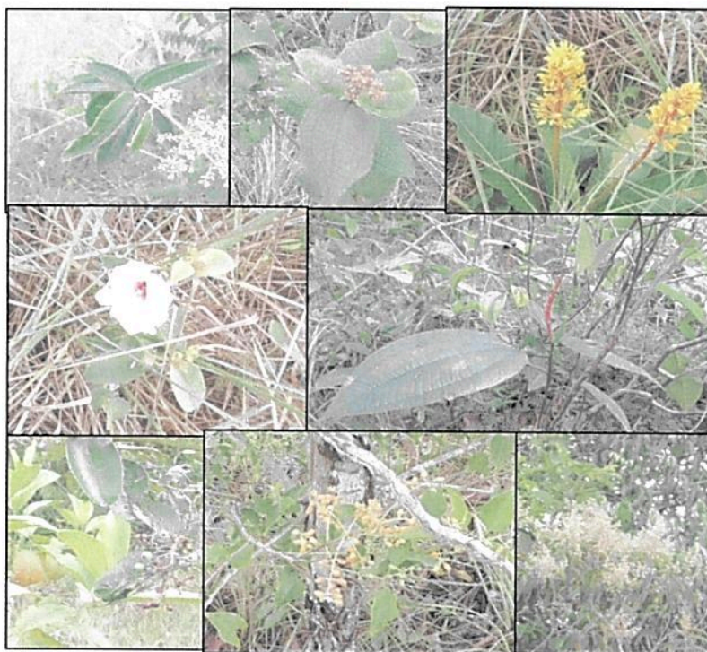
Figura 2. Parte de la vegetación encontrada en los recorridos al predio "El Siare # 2".

De acuerdo con la información suministrada en la reseña descriptiva, los recorridos realizados y lo comentado por el propietario, se encuentran especies como teca, ceiba, guatero, saladillo, algarrobo, caraño, aceite, chaparro, cadicaro, moriche, yarumo, ñopo, entre otros. Se observan amplia variedad de melastomatáceas y rubiáceas, principalmente en las zonas transicionales a las zonas de Agrosistemas.