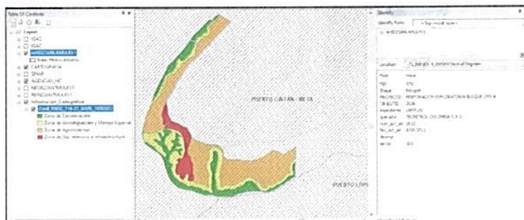
Figura 9. Traslape del área objeto de registro como RNSC, con bloque de perforación exploratoria.

Por otro lado, presenta traslape con un bloque de perforación exploratoria (CPO-6) a cargo de la operadora Tecpetrol Colombia SAS (Figura 9), por lo anterior se solicitó mediante oficio No. 20222300265381 del 07/09/2022 a la mencionada empresa si se tenían actividades tales como adecuación de servidumbres, excavaciones y/o rellenos entre otras, al interior del área solicitada en registro como RNSC "SIARE"