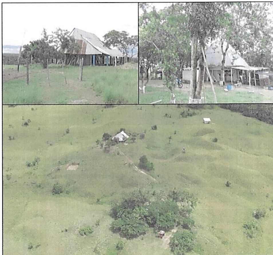
Figura 7. Aspecto de la zona de uso intensivo e infraestructura en la RNSC "SIARE".

5.4. ZONA DE USO INTENSIVO E INFRAESTRUCTURA: Esta zona corresponde a 21,8156 ha. y cubre el 9,06% del área objeto de registro, está conformada principalmente por las zonas de vivienda y un sector proyectado para el establecimiento de miradores y zonas de hospedaje para los turistas que se considera recibir en la Reserva, incluye unas pequeñas parcelas de cultivos de pancoger de yuca, plátano y algunos cítricos.