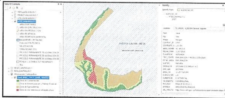
Figura 10. Traslape de área del predio "El Siare # 2" identificado con FMI No.234-8249 con bloque de exploración y producción.

Igualmente, se identificó un traslape con bloque de exploración y producción de hidrocarburos a cargo de la operadora Geopark Colombia S.A.S. por lo que se envió comunicación con radicado No. 20222300266561 del 08/09/2022 solicitando información acerca de realizar actividades en el área objeto de registro.