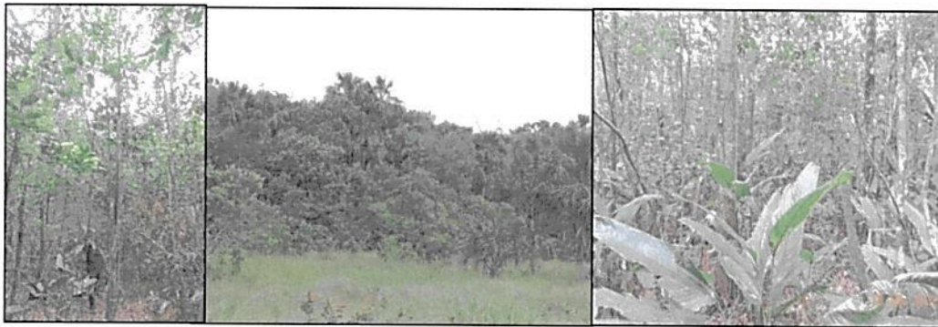
Figura 4. Zona de conservación identificada en la RNSC "SIARE".

5.1. ZONA DE CONSERVACIÓN: Esta zona corresponde a 54,1880 ha, equivalentes al 22,52% del área objeto de registro. Se encuentra conformada por la muestra de ecosistema natural de bosque de galería y representado en coberturas de bosques abiertos altos, con estrato herbáceo en buen estado de desarrollado.