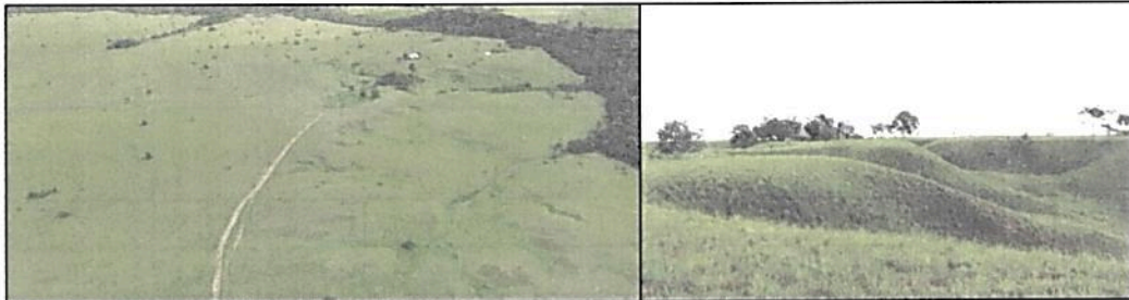
Figura 6. Aspecto de un sector de Agrosistemas de la RNSC "SIARE". Fuente visita técnica PNNC

5.4. ZONA DE AGROSISTEMAS: Con una superficie de 115,2125 ha, correspondientes al 47,87 % del área objeto de registro. Esta zona se compone de zonas de pastos y herbazales naturales para la alimentación del ganado que actualmente es la principal actividad productiva. Teniendo en cuenta el alto grado de disección propio de este sector de la Orinoquia, se encuentran paisajes alomados con algunos sectores con fuertes pendientes.