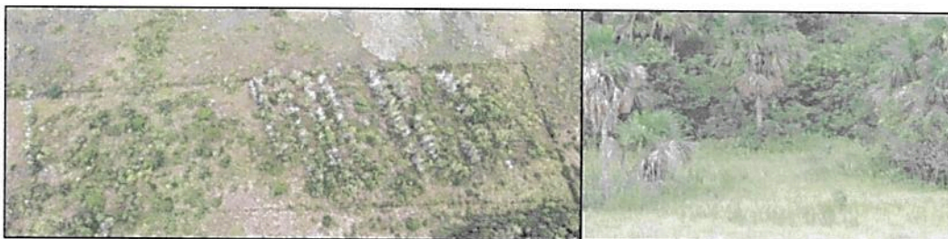
Figura 5. Aspecto de la zona de amortiguación para la RNSC "SIARE".

5.3. ZONA DE AMORTIGUACIÓN: Con una extensión de 49,4437 ha. y cubriendo el 20,55% del área objeto de registro, corresponde a una franja de ancho variable que se ubica en la transición de la zona de conservación y la de Agrosistemas. Al sur del área de registro la conforman sectores de herbazales y vegetación secundaria baja, y al occidente por parcelas sembradas con especies nativas como ñopo, leucaena, guásimo, machaco, pan de año, samán, flor morado, nispero, entre otros, los cuales tienen por objeto favorecer procesos de sucesión y conectividad con las áreas de conservación.