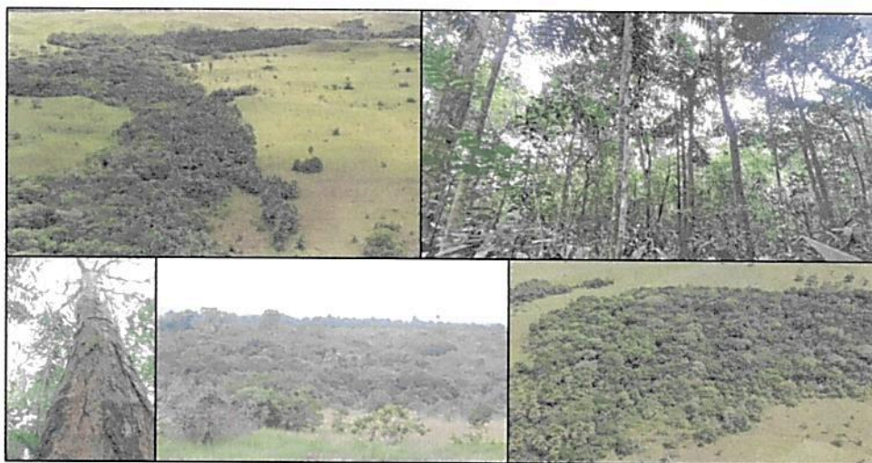
Figura 1. Muestra de ecosistema natural identificada en la RNSC "SIARE".

periódicos y zonas mezcladas con parches de morichales, se presentan alturas promedio de 15 metros con algunos individuos de 30 metros, algunos individuos arbóreos presentan DAP 2 superior al metro.