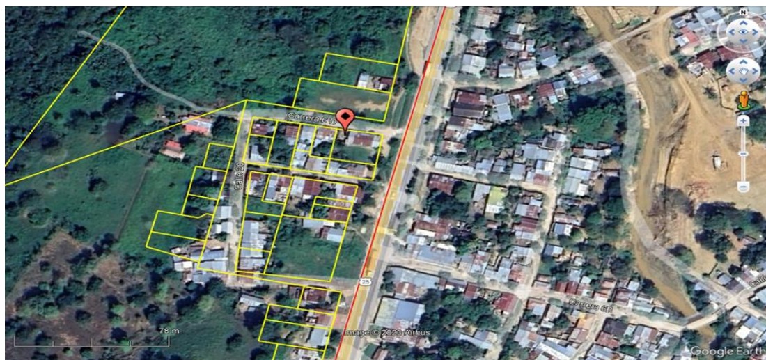
Figura 1. Georreferenciación del punto de intervención: El icono rojo marca el punto de ubicación de la construcción, la línea amarilla corresponde a la capa de predios urbanos asociada al sector Barrio Palmira y la línea roja corresponde al límite del SFF Los Colorados con la carretera troncal de occidente.”

De acuerdo a la coordenada referenciada en el informe de campo, es posible ratificar que el sector intervenido se ubica en la zona de Recuperación Natural IV, específicamente en el sector Barrio Palmira (Figura 1).