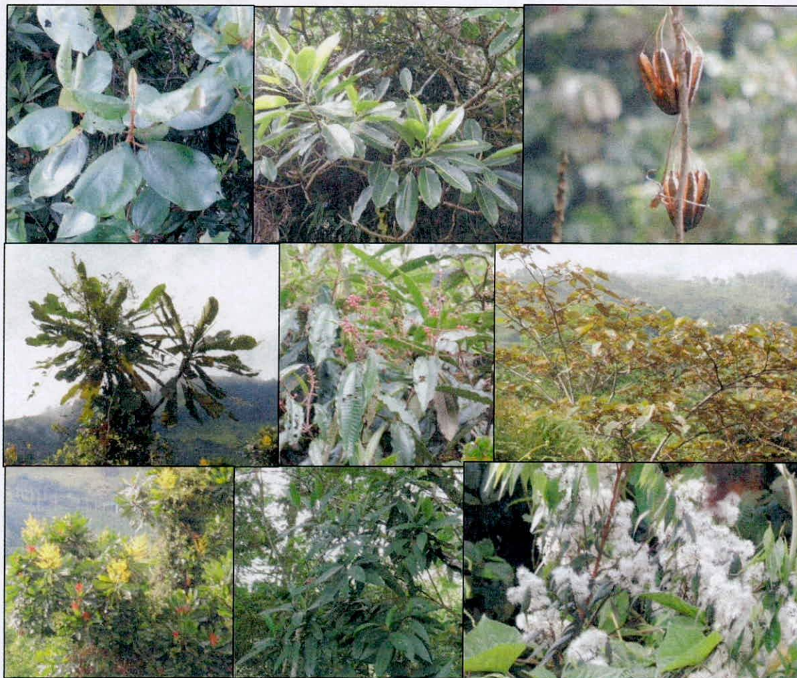
Figura 2. Parte de la vegetación encontrada en los recorridos al área objeto de registro.