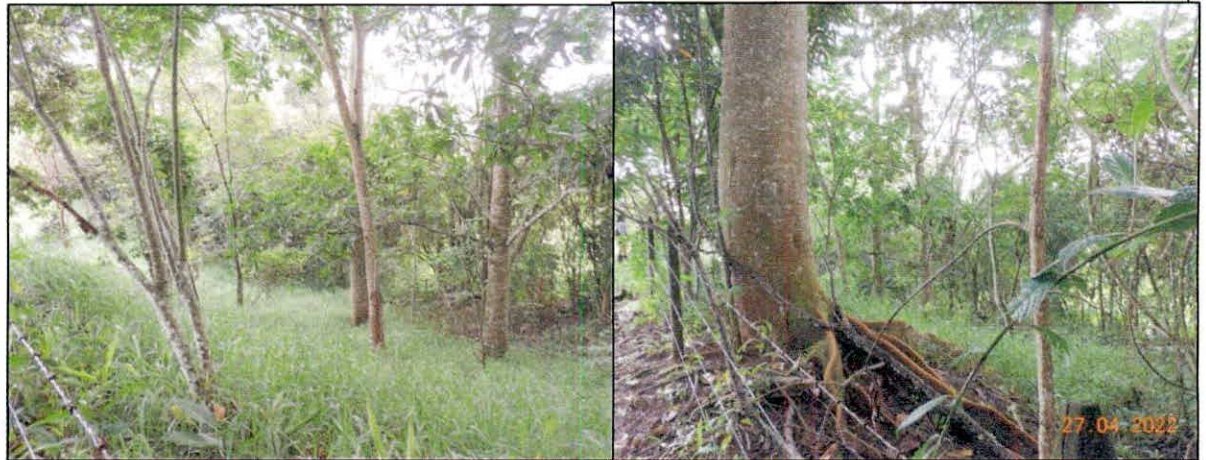
Figura 6. Aspecto de un sector de Restauración de la RNSC "NATURA MADRIGAL 1".

5.3. ZONA DE RESTAURACIÓN: Con una superficie de 0,5168 ha, correspondientes al 3,96 % del área objeto de registro, se compone de un sector de árboles nativos sembrados con pastos limpios a enmalezados. Esta área se encuentra cercado con el fin de proteger el crecimiento de la vegetación. Los arboles presentes oscilan entre 5 y 10 metros, se evidencia una limpia periódica en algunos sectores.