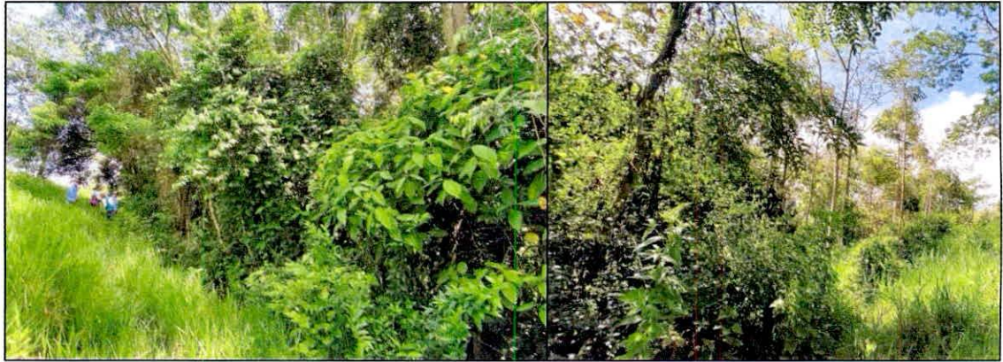
Figura 5. Aspecto de la zona de amortiguación para la RNSC "NATURA MADRIGAL 1".

5.3. ZONA DE RESTAURACIÓN: Con una superficie de 0,5168 ha, correspondientes al 3,96 % del área objeto de registro, se compone de un sector de árboles nativos sembrados con pastos limpios a enmalezados. Esta área se encuentra cercado con el fin de proteger el crecimiento de la vegetación. Los arboles presentes oscilan entre 5 y 10 metros, se evidencia una limpia periódica en algunos sectores.