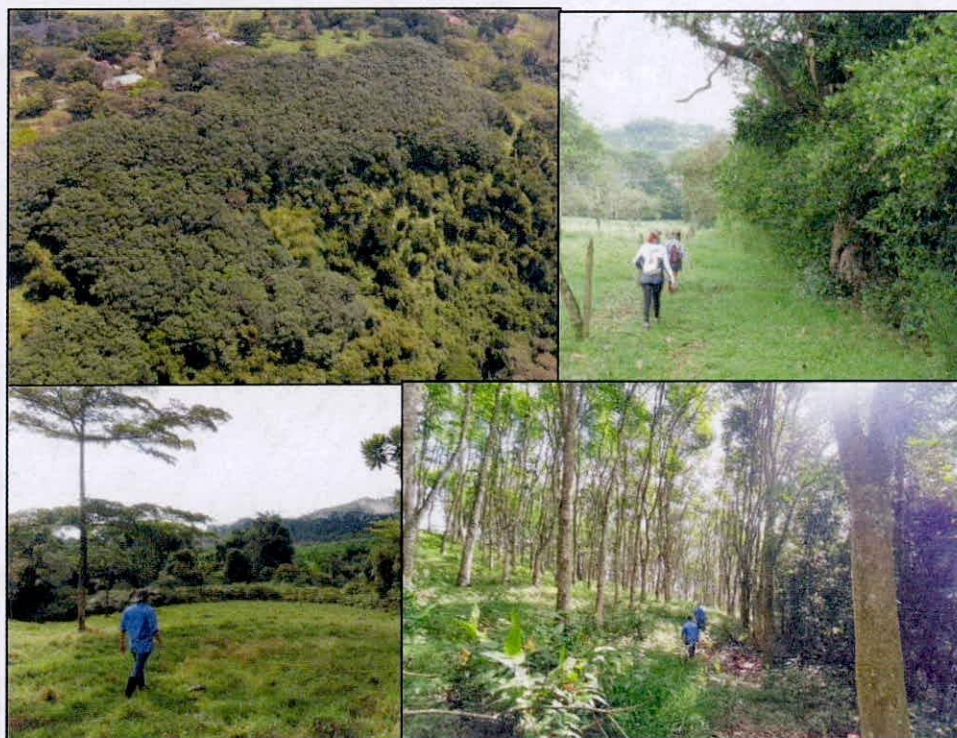
Figura 7. Aspecto de la zona de uso intensivo e infraestructura en la RNSC "NATURA MADRIGAL 1".