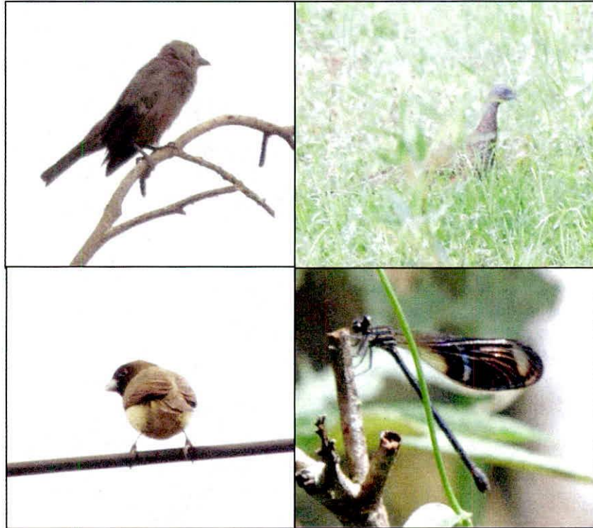
Figura 3. Parte de la fauna registrada en los recorridos del área objeto de registro.