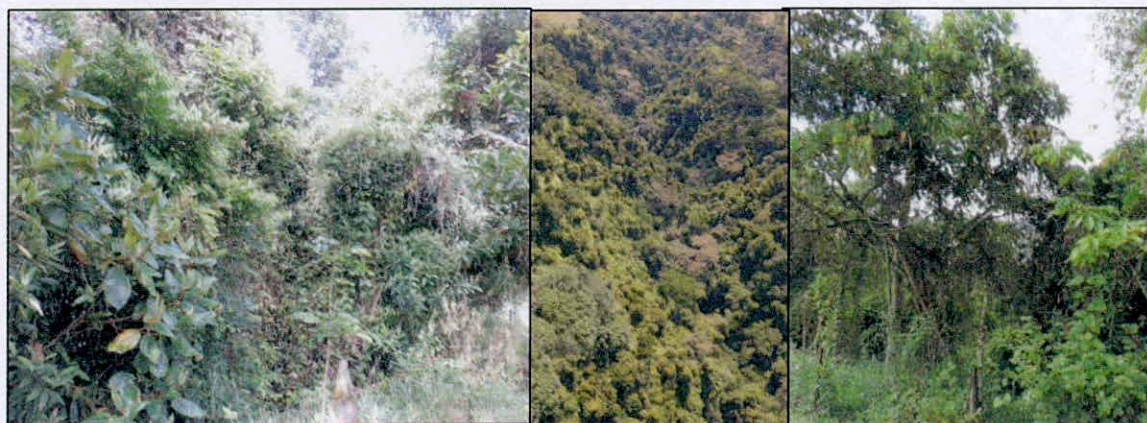
Figura 4. Zona de conservación identificada en la RNSC "NATURA MADRIGAL 1".

5.1. ZONA DE CONSERVACIÓN: Esta zona corresponde a 4,4759 ha, equivalentes al 34,33% del área objeto de registro. Se encuentra conformada por la muestra de ecosistema natural de bosque de galería y algunos remanentes de bosque húmedo premontano, representado en coberturas de bosques abiertos bajos, con estrato arbustivo en buen estado de desarrollado. Estas áreas se encuentran cercadas para la protección de los bosques y evitar el paso del ganado vacuno que pastorea en las zonas de Agrosistemas vecinas.