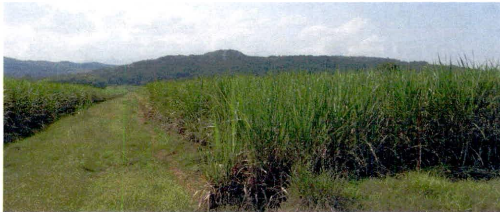
Figura 9. Zona de Agrosistemas de la Reserva Natural de la Sociedad Civil "SAN VICENTE"

Esta zona corresponde a 17,8203 ha, es decir, al 10,17% del área total a registrar. Está conformada por coberturas de pastos, y está destinada para llevar a cabo actividades de cultivo de caña, y ganadería sostenible