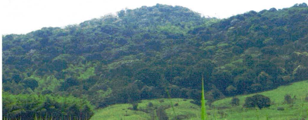
Figura 1. Muestra de ecosistema natural presente en los predios "Loma de San Vicente" y "Loma de San Pablo"

La Reserva Natural de la Sociedad Civil "SAN VICENTE" que será registrada a favor de los predios "Loma de San Vicente" y "Loma de San Pablo" se encuentra dentro del Orobioma Subandino Cauca medio 1 , con un ecosistema natural presente de Bosque Seco Tropical (Bs -T). (Figura 1)