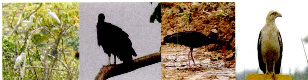
Figura 5. Fauna observada durante el recorrido realizado en los predios "Loma de San Vicente" y "Loma de San Pablo"