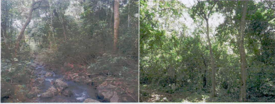
Figura 3. Bosque ripario presente en los predios "Loma de San Vicente" y "Loma de San Pablo"