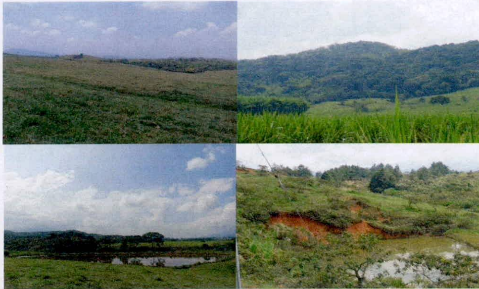
Figura 7. Zona de Amortiguación y Manejo Especial de la Reserva Natural de la Sociedad Civil "SAN VICENTE"

Esta zona corresponde a 4,5483 ha, es decir, al 2,6% del área total a registrar. Está conformada por humedales, los cuales son considerados áreas especiales para la protección 3 y de manejo especial por lo tanto se incluyen dentro de la zona de amortiguación.