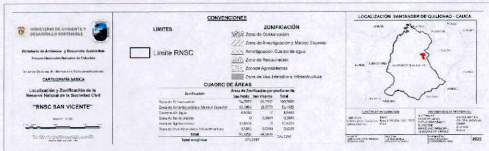
Figura 10. Zonificación de la Reserva Natural de la Sociedad Civil "SAN VICENTE"