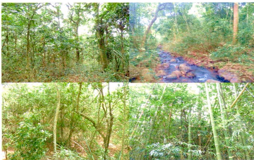
Figura 6. Zona de Conservación de la Reserva Natural de la Sociedad Civil "SAN VICENTE"

Esta zona corresponde a 100,5009 ha, es decir, al 57,36% del área total a registrar. Está conformada por una muestra de ecosistema natural de Bosque Seco Tropical (Bs-T) y Bosque ripario, y algunas áreas aisladas de Bosque Seco Tropical. Esta área está destinada para ser conservada.