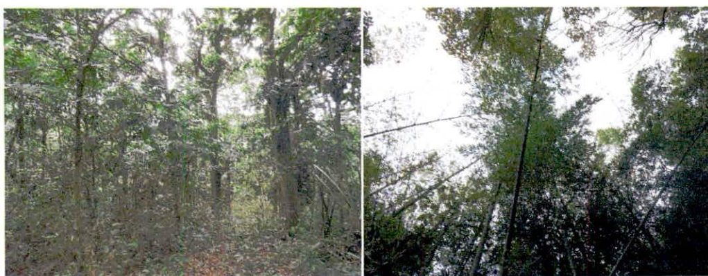
Figura 2. Ecosistema de Bosque seco Tropical presente en los predios "Loma de San Vicente" y "Loma de San Pablo"

En su interior, sobre el sotobosque se observa principalmente la vegetación herbácea y otras de hábitos arbóreos en estados juveniles, su dosel es discontinuo y se aprecia la vegetación arbórea con alturas entre 10 a 15 metros aproximadamente. (Figura 2 y 3).