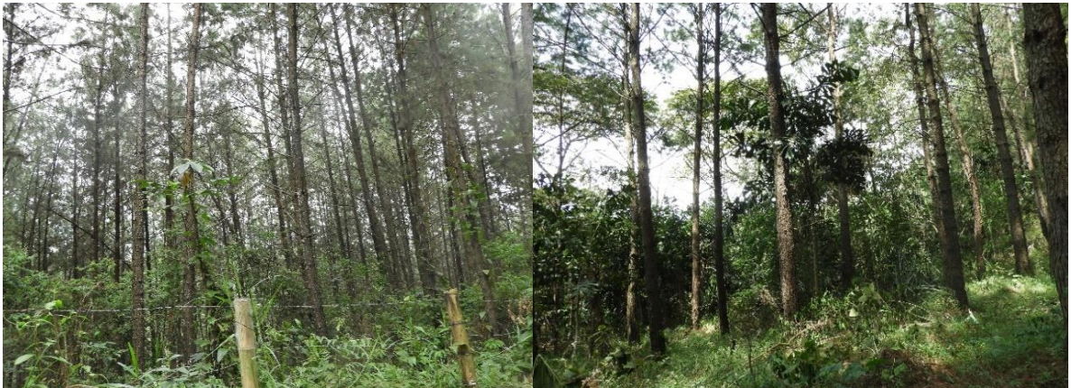
Figura 8. Zona de Amortiguación y Manejo Especial de la Reserva Natural de la Sociedad Civil "JAPIO GARCES Y CIA S.C.A"

Esta zona corresponde a 237,6998 ha. Es decir, al 51,09% del área total a registrar. Está conformada por algunos potreros arbolados y un bosque con plantaciones de pinos con presencia de vegetación nativa, actualmente se encuentra en regeneración natural y por decisión de la SOCIEDAD JAPIO GARCES Y CIA S.C.A y representante legal el bosque se encuentra destinado para restauración pasiva.