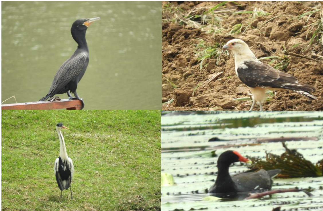
Figura 6. Fauna observada durante el recorrido realizado a los predios “Hacienda Japio Caloto y Hacienda Japio Santander”