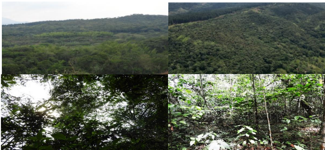
Figura 7. Zona de Conservación de la Reserva Natural de la Sociedad Civil “JAPIO GARCES Y CIA S.C.A”

Esta zona corresponde a 169,4928 ha, es decir, al 36,43% del área total a registrar. Está conformada por un ecosistema de Bosque Seco Tropical (Bs-T), y Bosque ripario. Estas áreas están destinadas para ser conservadas.