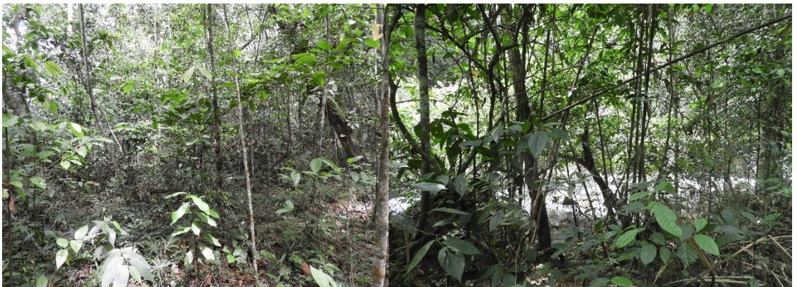
Figura 3. Bosque ripario presente en el predio "Hacienda Japio Caloto" y "Hacienda Japio - Santander"