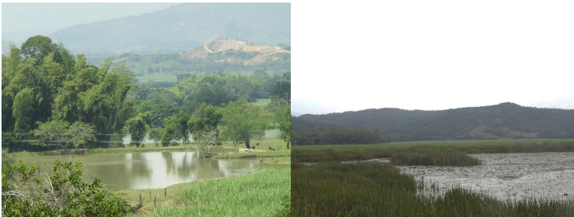
Figura 9. Humedales presentes en la Reserva Natural de la Sociedad Civil "JAPIO GARCES Y CIA S.C.A"

Esta zona corresponde a 6,136 ha. Es decir, al 1,32% del área total a registrar. Está conformada por humedales, los cuales son considerados áreas especiales para la protección 5 y de manejo especial por lo tanto se incluyen dentro de la zona de amortiguación.