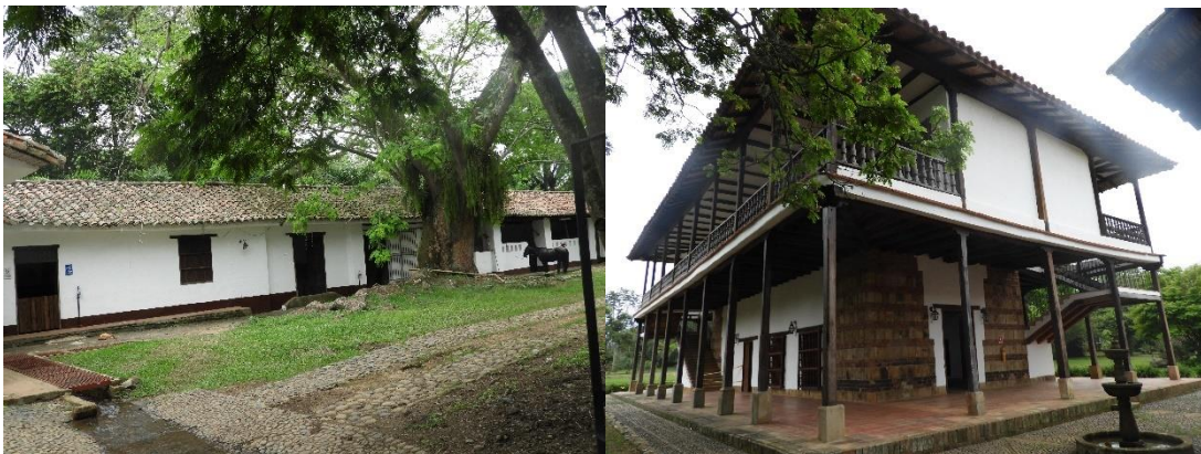
Figura 12. Zona de Uso Intensivo e Infraestructura de la Reserva Natural de la Sociedad Civil “JAPIO GARCES Y CIA S.C.A”

Esta zona corresponde a 8,8418 ha. Es decir, al 1,90% del área total a registrar, en la que se ubica una casa de interés histórico-cultural al ser conocida como una de las casas de paso de Simón Bolívar. Adicionalmente se encuentra una escuela de primaria que hace parte de la hacienda. Y las vías de acceso a la hacienda.