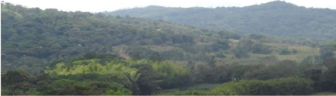
Figura 10. Zona de Restauración de la Reserva Natural de la Sociedad Civil “JAPIO GARCES Y CIA S.C.A”