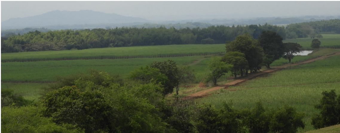
Figura 11. Zona de Agrosistemas de la Reserva Natural de la Sociedad Civil “JAPIO GARCES Y CIA S.C.A”

Esta zona corresponde a 20,3686 ha. Es decir, al 4,38% del área total a registrar. Está conformada por coberturas de pastos y está destinada para llevar a cabo actividades de cultivo de caña, y ganadería sostenible