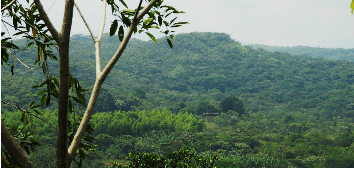
Figura 1. Muestra de ecosistema natural presente en el predio "Hacienda Japio Caloto" y "Hacienda Japio - Santander"

La muestra de ecosistema natural corresponde a un Bosque secundario que se encuentra en un proceso de sucesión vegetal, presenta una cobertura de Bosque abierto y está asociado a otras coberturas de bosque ripario, humedales naturales y artificiales presentes en la reserva (Figura 2 y 3).