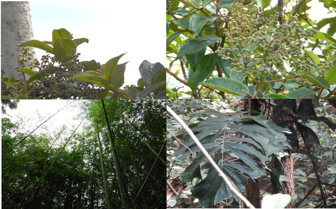
Figura 4. Flora presente en el predio "Hacienda Japio Caloto y Hacienda Japio Santander"