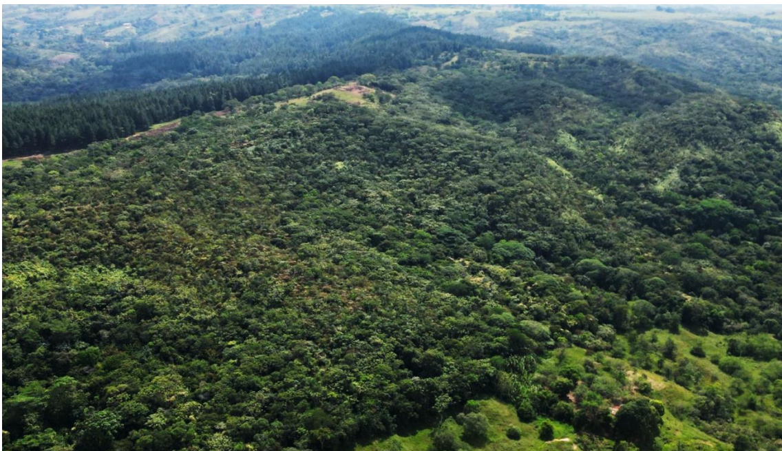
Figura 2. Muestra de ecosistema natural presente en el predio "Hacienda Japio Caloto" y "Hacienda Japio - Santander"

La muestra de ecosistema natural corresponde a un Bosque secundario que se encuentra en un proceso de sucesión vegetal, presenta una cobertura de Bosque abierto y está asociado a otras coberturas de bosque ripario, humedales naturales y artificiales presentes en la reserva (Figura 2 y 3).