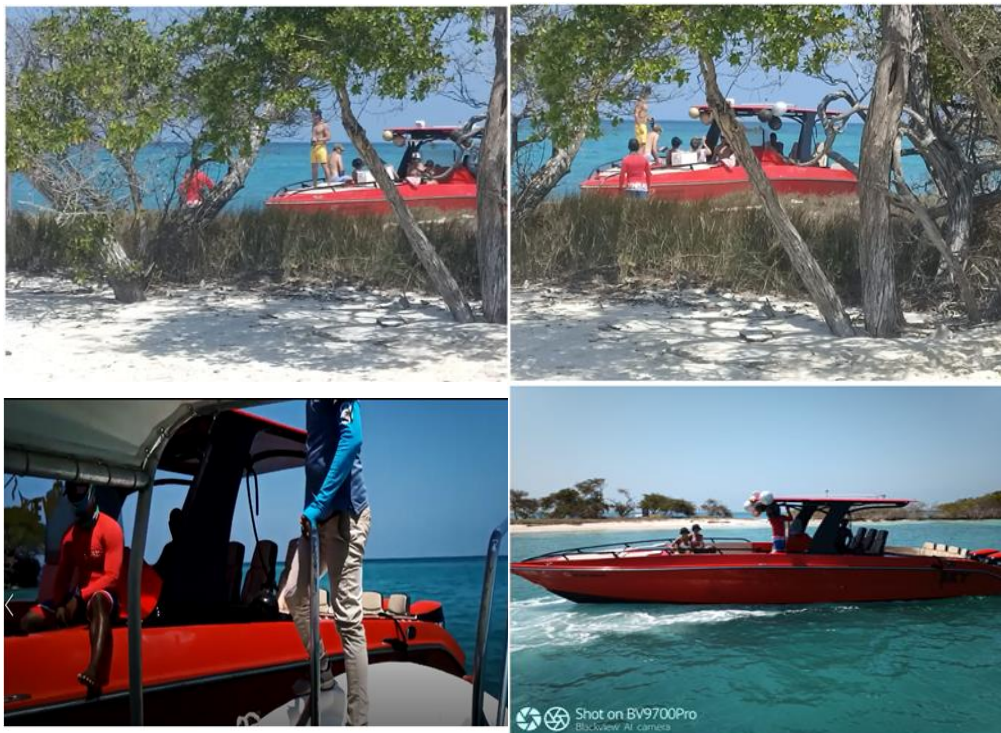
Embarcación y pasajeros en zona intangible con globos para festejos (elementos de un solo uso y perjudicial para el ecosistema marino)

festivos, siendo estos, elementos de un solo uso y perjudicial para el ecosistema marino. Incumpliendo lo dispuesto conforme a la resolución 1558 del 09/10/2019 " Por la cual se prohíbe el ingreso de plásticos de un solo uso en las áreas del sistema de Parques Nacionales Naturales de Colombia y se adoptan otras determinaciones". Así mismo la resolución 0160 del 15/05/2020 "Por la cual se adopta el Plan de Manejo del Parque Nacional Natural Los Corales del Rosario y de San Bernardo" Y la Resolución 0273 del 06/12/2007 "Por medio de la cual se reglamentan los canales de navegación y sitios permitidos para buceo y amarre de embarcaciones en el Parque Nacional Natural Los Corales del Rosario y de San Bernardo"