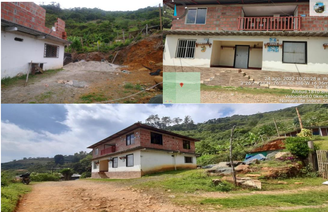
Fotografías por medio de las cuales se evidencia la obra desarrollada

Con fundamento en lo expuesto a lo largo del presente Auto, esta administración considera que las presuntas infracciones ambientales desarrolladas por el Sr. Luis Olover Villota se encuentran relacionadas con la reconstrucción de un segundo piso, tipo habitacional, con dimensiones aproximadas de 12 metros por 8 metros, para un área total de 96 metros cuadrados.