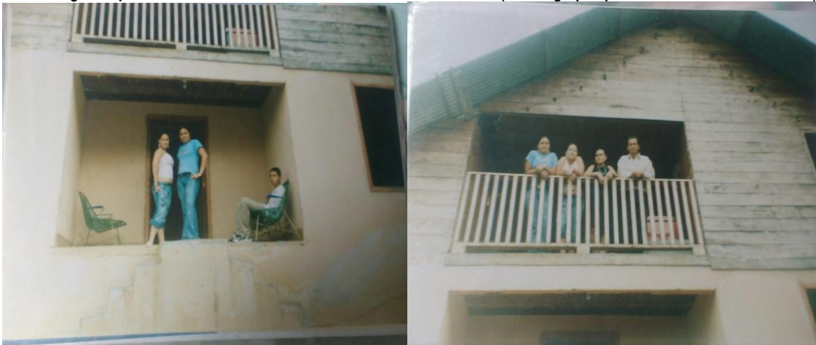
Fotografías aportadas por el investigado por medio de las cuales evidencia la existencia de un segundo nivel años atrás

En este orden de ideas, y partiendo de la definición consagrada en el artículo 5 de la Ley 1333 de 2009 en la cual se estima que la inobservancia de los actos administrativos emanados por la autoridad competente también podrá ser considerada como una infracción de carácter ambiental, la reconstrucción del segundo nivel ya descrito podría vulnerar lo dispuesto en el artículo tercero de la Resolución 470 de 2018 y el artículo