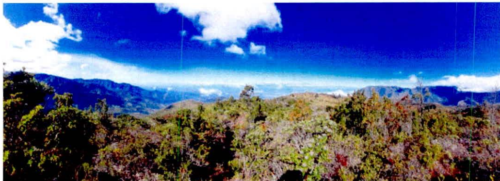
Figura 6. Zona de conservación presente en la RNSC "CHAMICERO DE PERIJA".