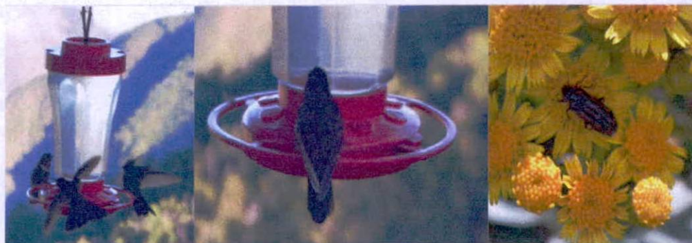
Figura 4: Fauna registrada en la RNSC "CHAMICERO DE PERIJA". Fuente: Visita técnica PNNC. 23 de noviembre de 2022

Cabe resaltar, que el predio presenta una muy buena muestra de ecosistema natural, lo cual hace que el servicio ecosistémico de hábitat para especies sea uno de los más representativos, e importante para las especies de fauna mencionadas anteriormente y las reportadas en el plan de manejo de la reserva