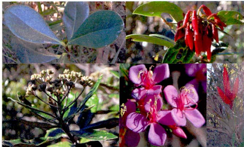
Figura 2. Flora observada en la RNSC "CHAMICERO DE PERIJA".

En la reserva, el páramo se caracteriza por la presencia de bosques densos altos y pastizales densos altos, siendo las especies arbóreas más representativas para este ecosistema los siete cueros nativos ( Tibouchina sp.), tuno esmeraldo ( Melastomataceae ), gaques ( Clusia multiflora ), uva camarona ( Macleania rupestris ), fucsia boliviana, Symplocos sp., cajeto, mano de oso ( Oreopanax sp.) de tres especies diferentes, roble, chusque, mortiño, hayuelo, laurel, frailejones, lirios, kalanchoe, tréboles, mora silvestre. Algunas especies de líquenes del género Usnea sp., Parmotrema sp., musgos de diversas especies al igual que helechos, bromelias con aproximadamente cinco (5) especies, orquídeas de 6 especies algunas pertenecientes al género Pleurothallis sp., Epidendrum sp., y otras no identificadas.