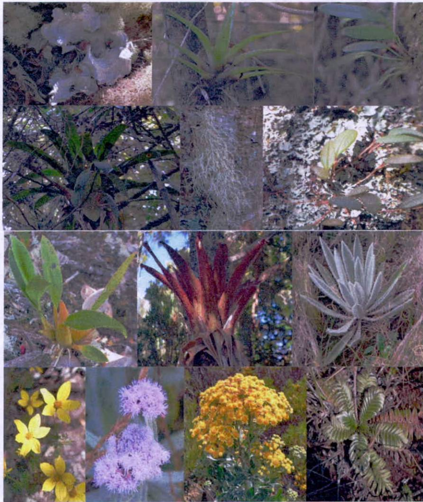
Figura 3. Flora observada en la RNSC "CHAMICERO DE PERIJA".