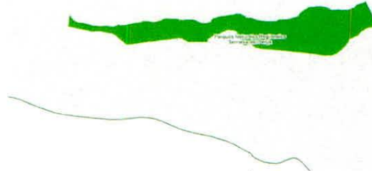
Figura 8. Traslape del predio FMI 190-57292 con el Área Protegida Parques Natural Regional Serranía del Perijá de acuerdo con la capa SINAP.

El Grupo de Trámites y Evaluación Ambiental - GTEA informó que la Reserva Natural de la Sociedad Civil RNSC "CHAMICERO DE PERIJA" presenta traslape con el Área Protegida Parques Natural Regional Serranía del Perijá de acuerdo con la capa SINAP.