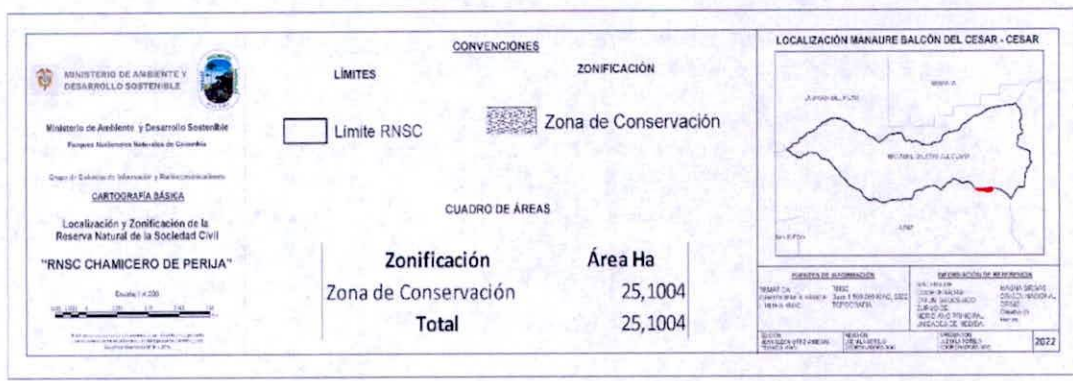
Figura 7. Zonificación propuesta para la RNSC "CHAMICERO DE PERIJA" de acuerdo con la sección 17 del Decreto 1076 de 2015.