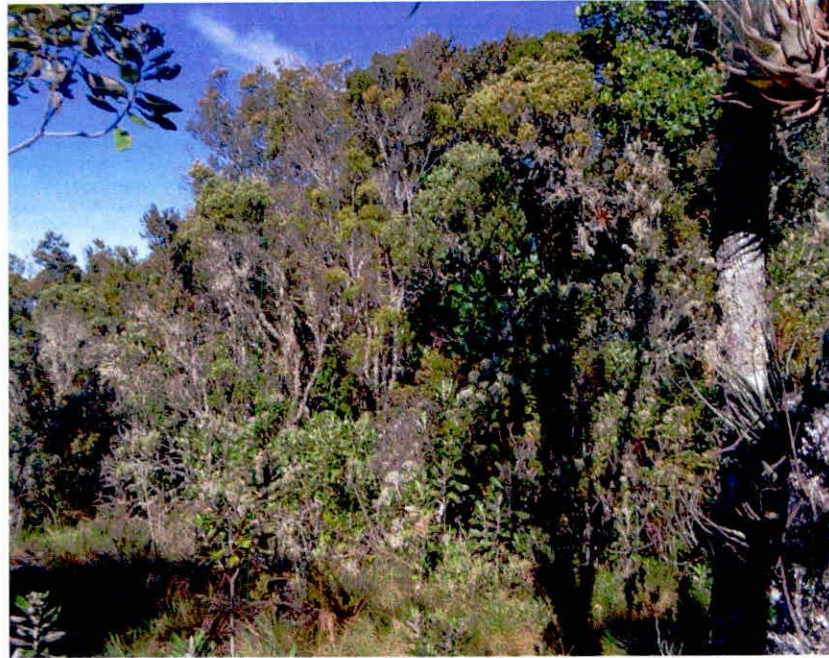
Figura 1. Muestra de ecosistema natural presente en la RNSC "CHAMICERO DE PERIJA".