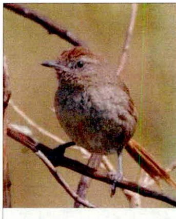
Chamicero de Perijá ( Asthenes perijana )

De acuerdo con la reseña descriptiva presentada a través de los documentos de inicio del trámite de registro como reserva natural de la sociedad civil "CHAMICERO DE PERIJÁ", en la reserva se registró "(...) Chamicero de Perijá ( Asthenes perijana ). Endémica, EN (...) y el "(...) Colibrí de perijá ( Metallura iracunda ). Endémica, EN..(...)" como especies con algún grado de amenaza dentro del territorio, lo que los convierte en valores objeto de conservación de vital importancia para este tipo de ecosistema. Se resalta que estas dos especies son endémicas de esta región.