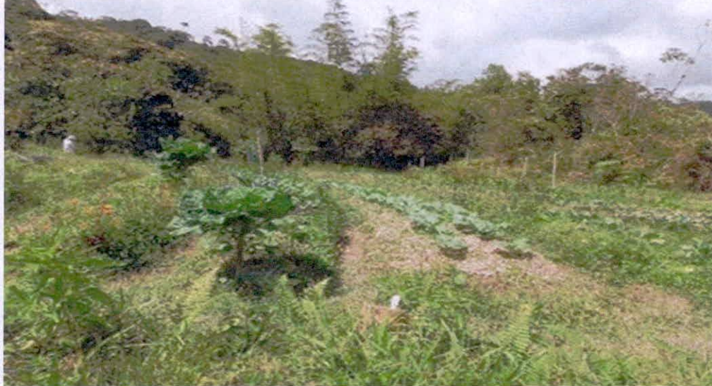
Figura 7. Zona de Agroecosistemas del predio "SIN DIRECCION LA LILA" de la RNSC "FINCA AGROECOLOGICA SAN MARTIN".