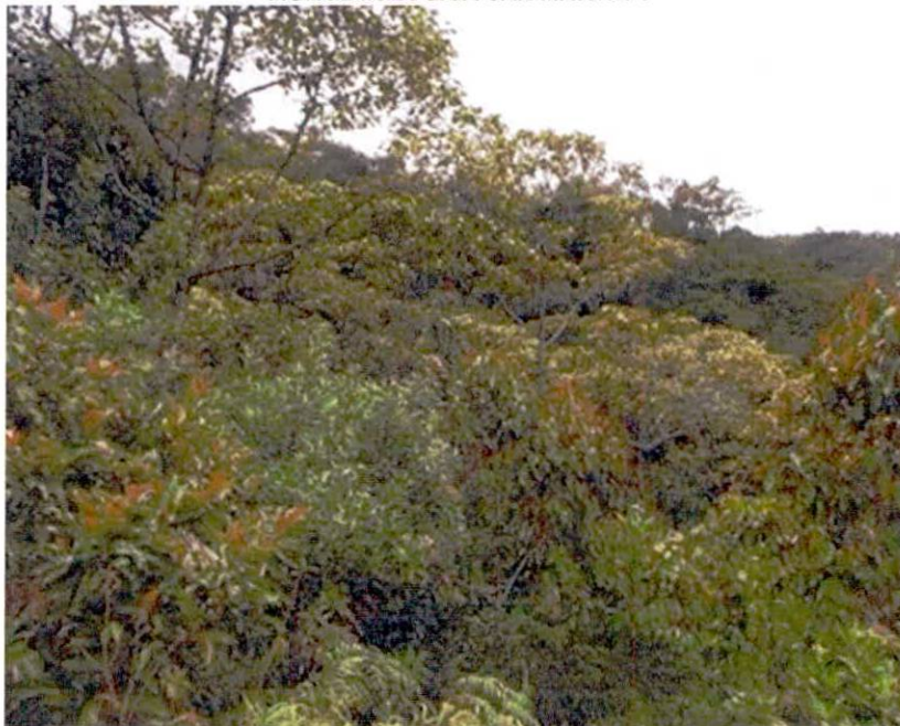
Figura 5. Zona de conservación del predio "SIN DIRECCION LA LILA" de la RNSC "FINCA AGROECOLOGICA SAN MARTIN".