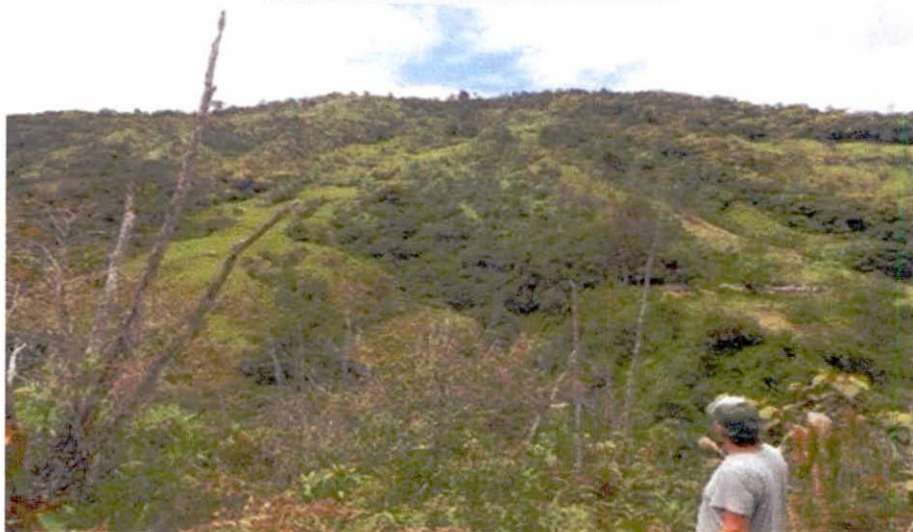
Figura 6. Zona de amortiguación y manejo especial del predio "SIN DIRECCION LA LILA" de la RNSC "FINCA AGROECOLOGICA SAN MARTIN".