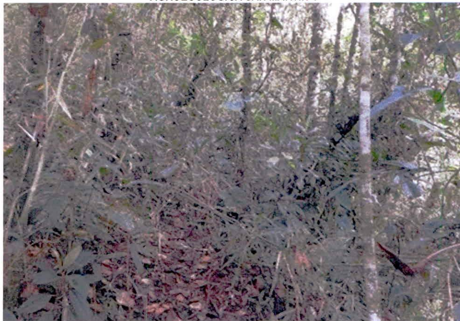
Figura 2. Composición de la flora en el predio "SIN DIRECCION LA LILA" de la RNSC "FINCA AGROECOLOGICA SAN MARTIN".