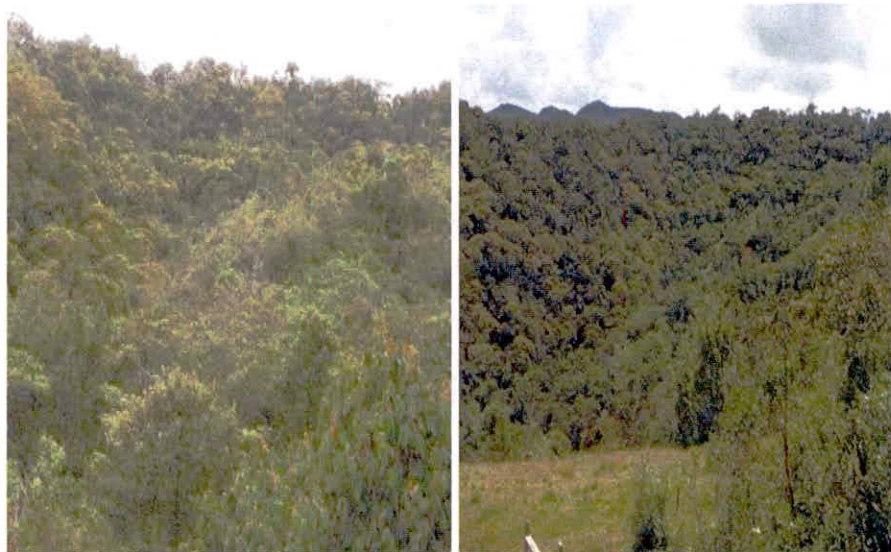
Figura 1. Muestra de ecosistema natural presente en el predio "SIN DIRECCION LA LILA" de la RNSC "FINCA AGROECOLOGICA SAN MARTIN"