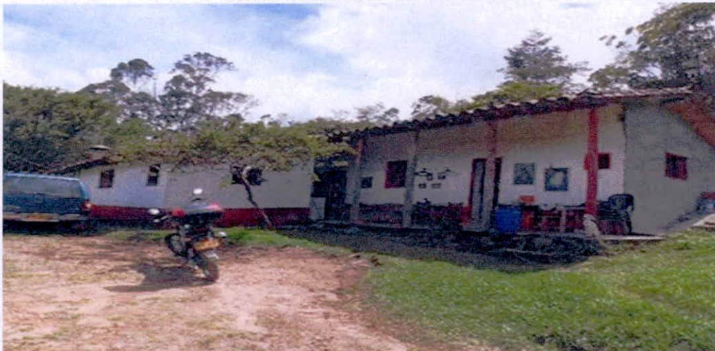
Figura 8. Zona de Uso Intensivo e Infraestructura del predio "SIN DIRECCION LA LILA" de la RNSC "FINCA AGROECOLOGICA SAN MARTIN".