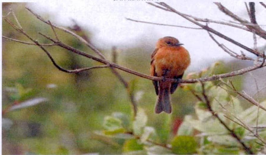
Figura 3. Fauna asociada al predio "SIN DIRECCION LA LILA" de la RNSC "FINCA AGROECOLOGICA SAN MARTIN".