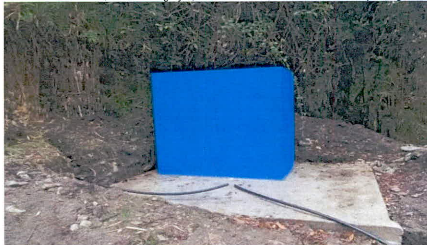
Figura 2. Desarenador campamento Diamante Fuente. Visita técnica 7 de marzo de 2023.

El desarenador esta adecuado, aproximadamente 50 mt abajo de la bocatoma, este cuenta con las siguientes dimensiones: de 1,70 mt de largo y 0,40 mt de ancho, el desarenador es tipo longitudinal.