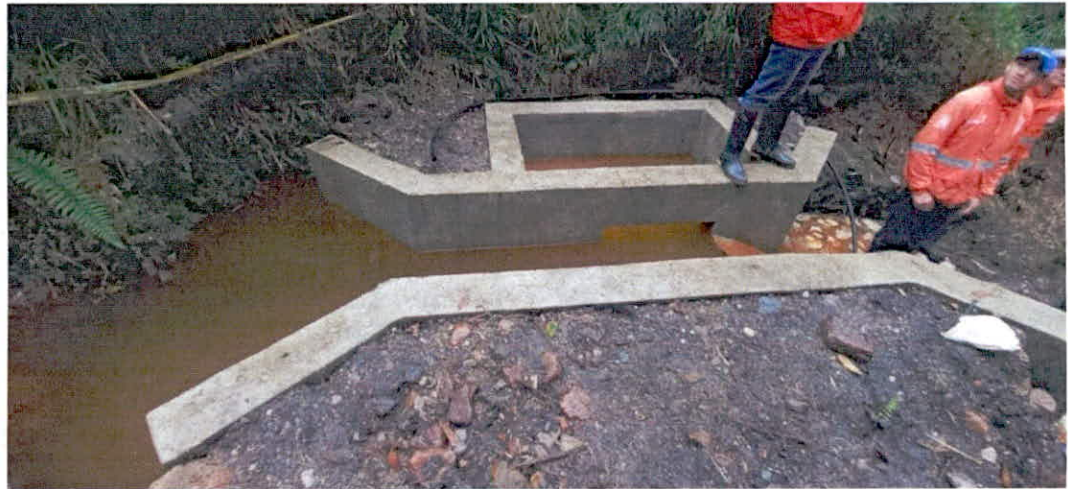
Figura 1. Bocatoma campamento Diamante Fuente. Visita técnica 7 de marzo de 2023.

controlado al afluente. La cámara de aducción presenta las siguientes dimensiones: 1,75 mt de largo por 0,80 mt de ancho.