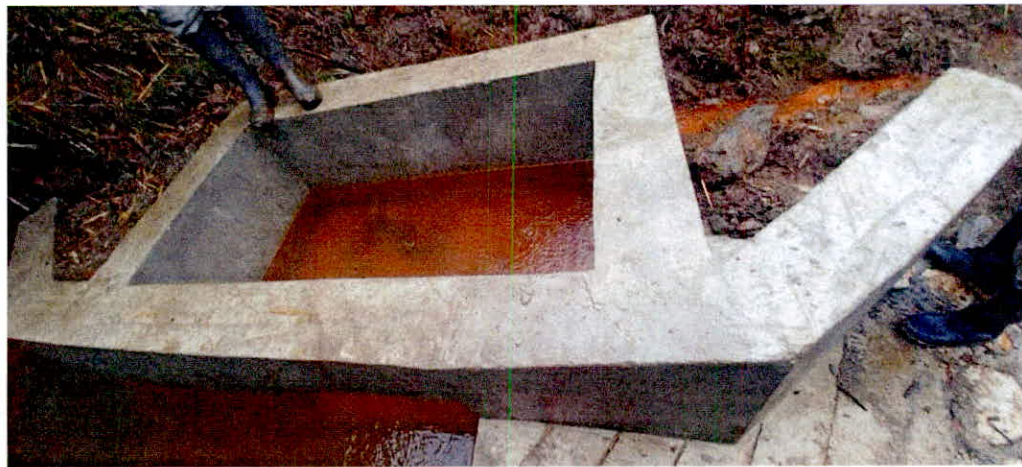
Figura 3. Cámara de aducción campamento Diamante Fuente. Visita técnica 7 de marzo de 2023.

Bocatoma: La estructura tipo canal parshall, se ubica ocupando el cauce de la fuente hídrica natural. El largo del vertedero es de 3,54 mt por 1,66 mt de ancho. La rejilla de captación de caudal a la cámara de captación presentará las siguientes dimensiones: largo de 0,70 mt con un ancho de 0,4 mt, conformado por una compuerta el cual dará paso controlado al afluente. La cámara de aducción presenta las siguientes dimensiones: 1,75 mt de largo por 0,80 mt de ancho.