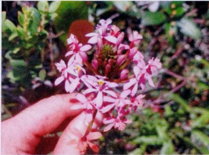
Figura 2. Registro de flora en la RNSC "EL BARRANQUERO". Fuente: radicado No. 20224600038932 del 08/04/2022.