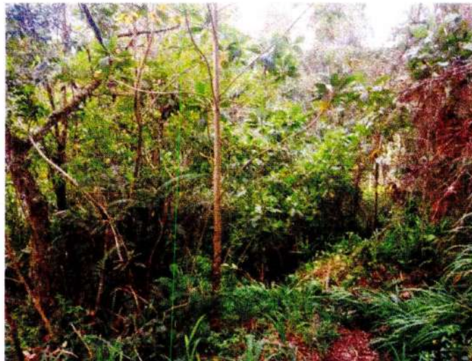
Figura 5. Vegetación en la zona de conservación de la RNSC "EL BARRANQUERO". Fuente: radicado No. 20224600038932 del 08/04/2022.