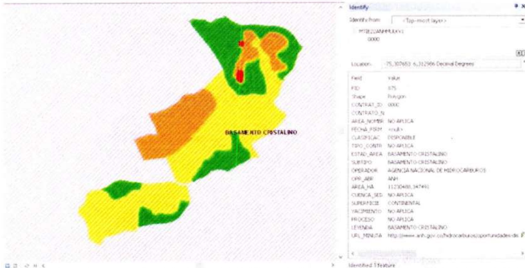
Figura 7. Traslape de los predios Lote # Vereda El Porvenir, inscrito bajo el folio de matrícula inmobiliaria No. 020-81668 y Lote # Hoy Vereda El Porvenir, inscrito bajo el folio de matrícula inmobiliaria No. 020-20641 con capa Mapa de Tierras de ANH con área de basamento cristalino. Fuente: GGCI.

Así mismo, también se informó sobre el traslape con capa de solicitud minera con expediente TBR-14561 (Figura 8) de acuerdo con shapefile de Solicitudes Mineras suministrada por la Agencia Nacional de Minería (Fuente ANM-2022), siendo pertinente continuar con el trámite de registro de la RNSC 202-20 "EL BARRANQUERO" ya que de acuerdo con el Memorando 186 del 19/10/2012 emitido por la Oficina Asesora Jurídica de PNN, es viable el registro cuando existan predios con contrato de concesión minera o título minero en fase de exploración, toda vez que el beneficiario no lleve a cabo "los usos mineros" y en consecuencia no afecten el área a ser registrada como RNSC.