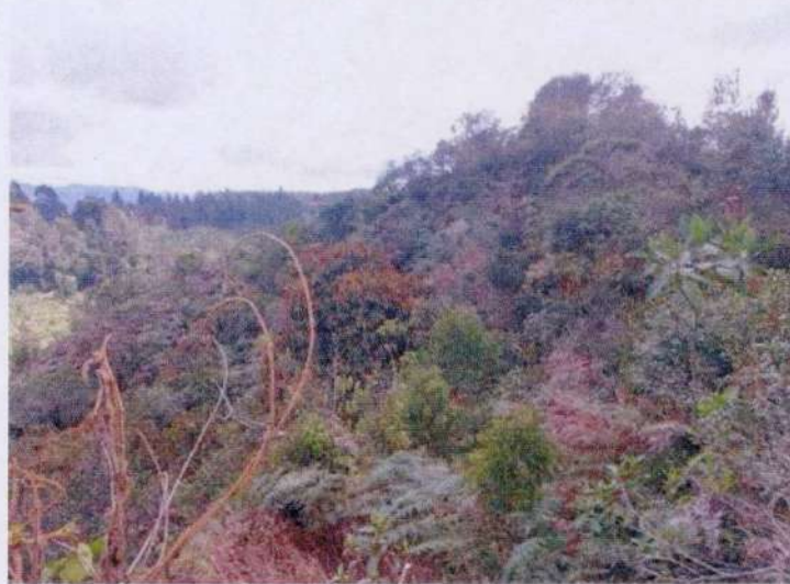
Figura 6. “Ecotono entre zona de [conservación] y zona de amortiguación” y manejo especial de la RNSC “EL BARRANQUERO”. Fuente: radicado No. 20224600038932 del 08/04/2022.

nacimientos de agua, humedales y cauces. Esta zona puede contener rastrojos o vegetación secundaria y puede estar expuesta a actividades agropecuarias y extractivas sostenibles, de regular intensidad.” 12