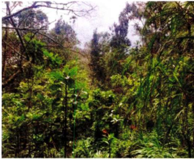
Figura 1. Vista de la zona de conservación RNSC "EL BARRANQUERO". Fuente: radicado No. 20204600107072 del 18/12/2020.

La RNSC "EL BARRANQUERO" se encuentra ubicada entre los 2000 y los 2200 msnm en la zona de vida de bosque muy húmedo – montano bajo perteneciente a la cuenca del río Magdalena, subcuenca del río Nare y microcuenca del río Negro. 5 De manera más específica se menciona que se encuentra "en la cuenca hidrográfica nivel 3 de la quebrada La Magdalena, afluente que desemboca en el Embalse y río Guatapé." 6