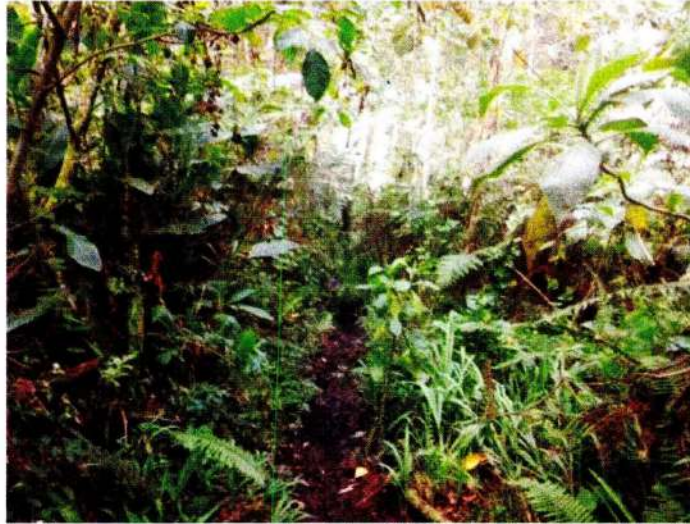
Figura 4. Vegetación en la zona de conservación de la RNSC "EL BARRANQUERO". Fuente: radicado No. 20224600038932 del 08/04/2022.

Esta zona corresponde a 0,8067 ha del área objeto de registro, es decir, 22,47%; "esta área (...) se destinará al cuidado de la muestra ecosistémica presente en [la RNSC "EL BARRANQUERO"], donde se vienen realizando actividades de enriquecimiento vegetal y preservación de los ecosistemas naturales, asociados a los nacimientos de agua y refugios para la fauna silvestre." 9 "Los fragmentos de bosque nativo de la reserva presentan un adecuado estado de conservación. En la parte sur se cuenta con una cobertura vegetal sobresaliente, con un bosque natural característico de la zona, con una riqueza considerablemente alta de especies de plantas nativas pertenecientes a las familias: Asteraceae, Bromeliaceae, Rubiaceae; Melastomataceae, Euphorbiaceae, Ericaceae, Orchidaceae, Araliaceae, Solanaceae y Lauraceae." 10