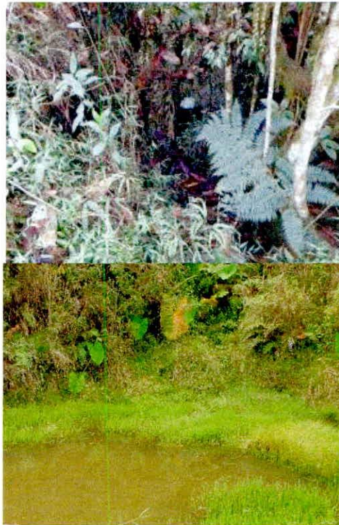
Figura 4. Zona de conservación RNSC "JIMENEZ".