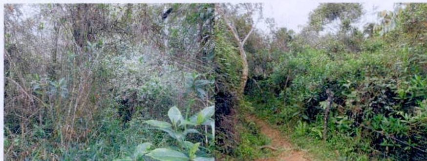
Figura 2. Flora observada de conservación RNSC "JIMENEZ".

"(...) En la zona de conservación también se encuentra un bosque, que cubre la totalidad de la reserva natural. Este cuenta con una vegetación secundaria en sucesión intermedia, con algunas plantas pioneras hacia los bordes (helechos marraneros del género Pteridium , yarumos, entre otros) y plantas de una mayor estructura hacia el interior (...)."