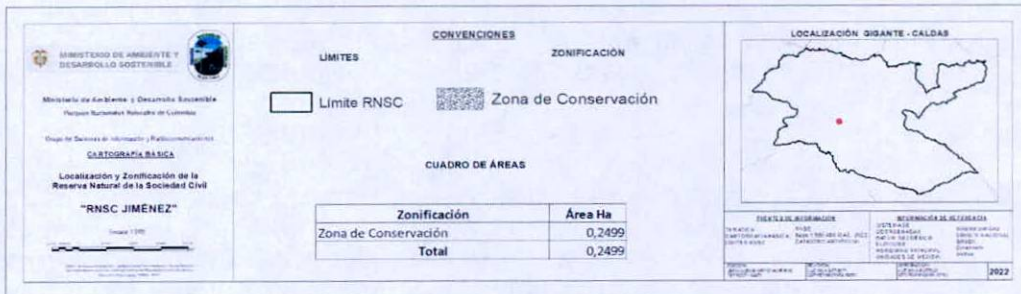
Figura 3. Zonificación de la Reserva Natural de la Sociedad Civil "JIMENEZ".