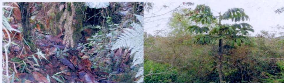
Figura 1. Muestra de ecosistema natural presente en la RNSC "JIMENEZ".

"(...) La RNSC "JIMENEZ" se encuentra localizada en la vereda Raudal, del Municipio de Santo Domingo, de acuerdo con la visita técnica realizada se encuentra localizada en la zona de vida bosque muy húmedo Premontano (bmh - PM) conforme con la clasificación propuesta por Holdridge. Esta información fue contrastada durante la visita técnica de campo (...)."