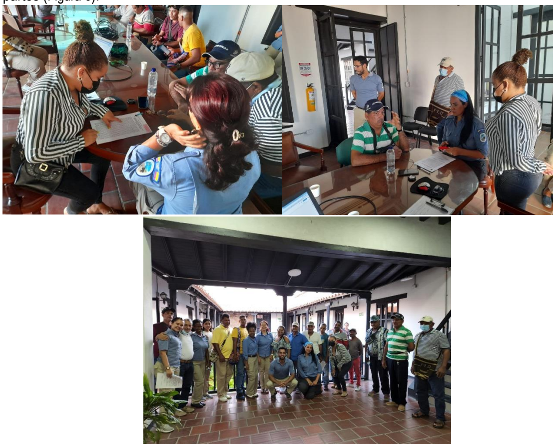
Figura 6. Registro Fotográfico - firma del Acuerdo de Conservación suscrito entre PNN y Oceanatours

Durante este periodo se avanzó en las acciones de seguimiento y acompañamiento por parte de PNN, se realizaron reuniones de socialización del Acuerdo de Conservación el cual fue suscrito el día 19 de agosto de 2022 (ver ayuda de memoria: – https://drive.google.com/file/d/1GBsnIU_Sv5JPTxR_HrIOiFSKEil5mDr/view?usp=sharing ), entre las partes (Figura 6).