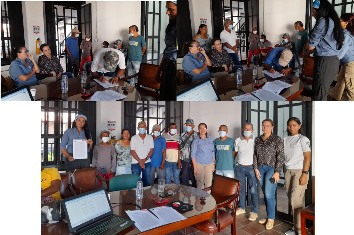
Figura 9. Registro fotográfico - Suscripción del Acuerdo de Conservación entre Nautitours y PNN

Durante este periodo se llevó a cabo la socialización y firma del Acuerdo de Conservación con Parques Nacionales, lo que muestra su grado de compromiso con el medio ambiente y en especial con el área protegida (Ver acuerdo: https://drive.google.com/file/d/1y0Tz1sMH_OZhsRNzXKneTSded9SwO7L-/view?usp=sharing ).