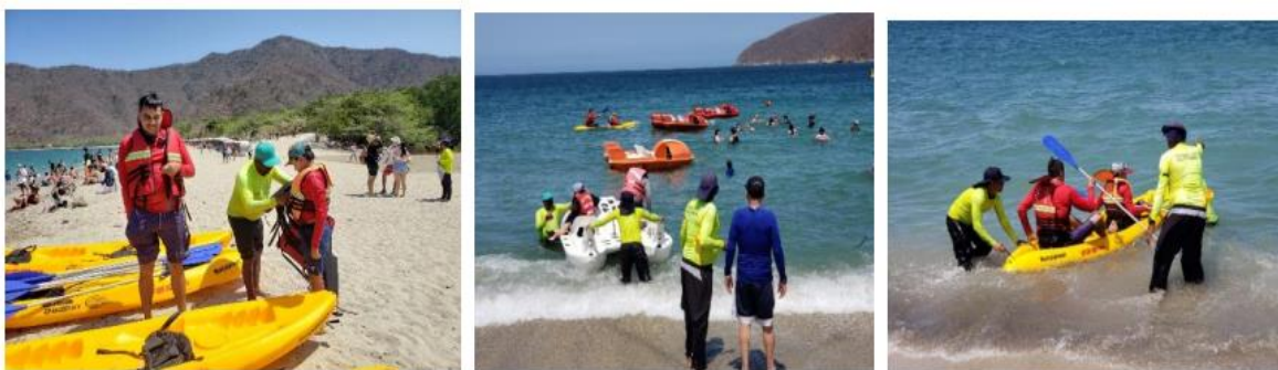
Figura 8. Registro Fotográfico – Operación de Deportes Náuticos – Nautitours - Bahía Concha

Cuentan con la Licencia de Explotación Comercial No 578, que los acredita ante la Dirección General Marítima como una empresa de Recreación y Deportes Náuticos.