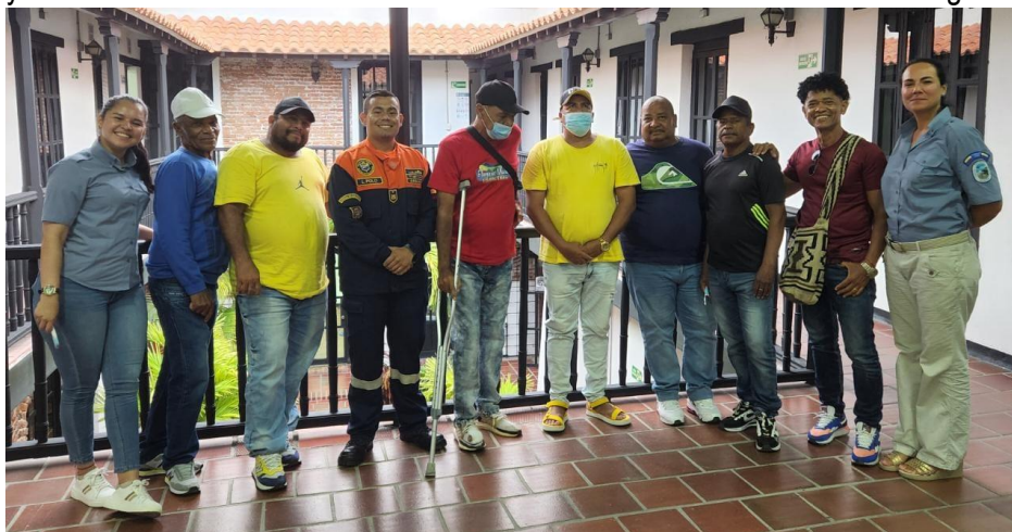
Figura 2) y la siguiente acta:

Durante el segundo semestre se realizaron reuniones de seguimiento al funcionamiento de la actividad y al Acuerdo de Conservación como se evidencia en el registro fotográfico (