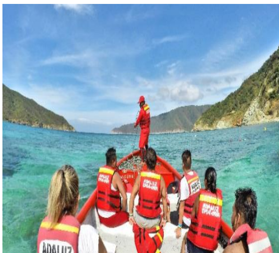
Figura 5. Vista general - Página web de Oceantour SAS