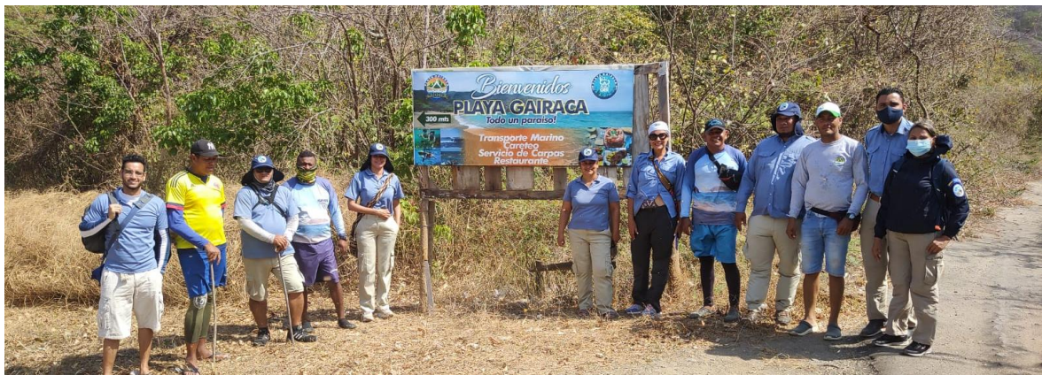
Tabla 7. Beneficiarios y Alternativas Productivas en Gayraca - PNNT.

A través de la aprobación del proyecto denominado ADMINISTRACIÓN DE LAS ÁREAS DEL SISTEMA DE PARQUES NACIONALES NATURALES Y COORDINACIÓN DEL SISTEMA NACIONAL DE ÁREAS PROTEGIDAS. NACIONAL: Parques Nacionales y el Ministerio de Ambiente y Desarrollo Sostenible, en aras de avanzar en el cumplimiento de la sentencia y de articular acciones que permitan potenciar los esfuerzos y recursos en la implementación de las estrategias para el Manejo del Área Protegida entre otras, el ecoturismo, formuló el proyecto denominado “INICIATIVAS PRODUCTIVAS PARA LA COMPENSACIÓN DE PESCADORES ARTESANALES Y EL FORTALECIMIENTO DEL ECOTURISMO EN EL PARQUE NACIONAL NATURAL TAYRONA –ETAPA II – SENTENCIA T- 606 DE 2015” con el objetivo de Implementar acciones para la consolidación de las alternativas productivas sostenibles en el sector de la Bahía Concha y Bahía de Gayraca que contribuyan a la disminución de presiones y fortalecimiento del ecoturismo como estrategia de conservación del Parque Nacional Natural Tayrona – PNNTAY. Dicho proyecto fue viabilizado por el Fondo Nacional Ambiental -FONAM para ser ejecutado en el 2do semestre del 2022 a fin de brindar alternativas productivas que permitan reemplazar la actividad de pesca artesanal, de manera que contribuya a la disminución de la presión que esta causa en los ecosistemas marinos del PNN Tayrona.