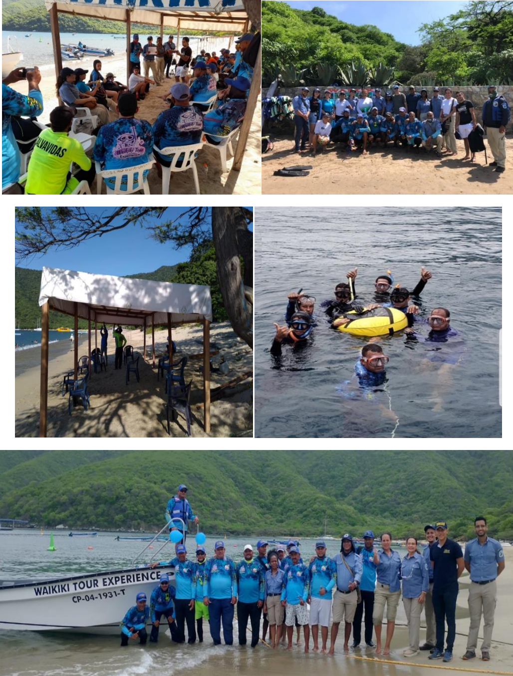
Figura 4. Registro Fotográfico Alternativa Productiva Transporte de pasajeros y Senderismo Subacuático – COOTRABAHIACON - PNNT.

PARQUES NACIONALES NATURALES DE COLOMBIA