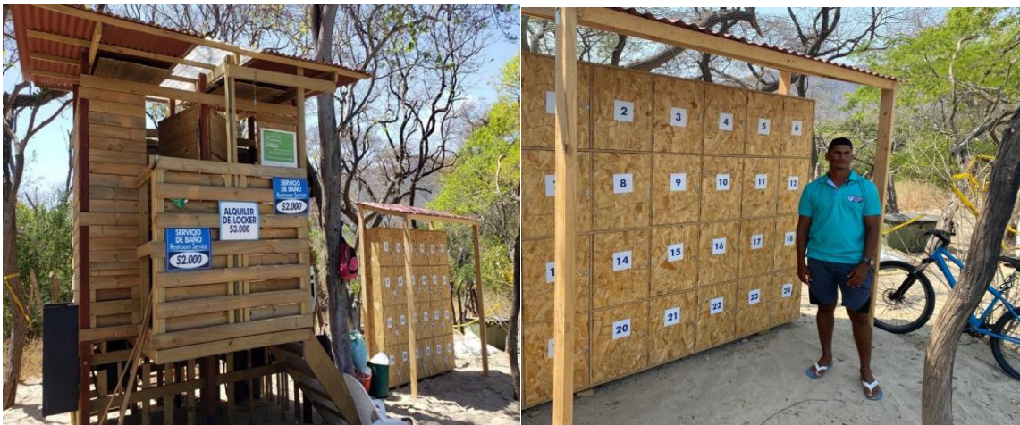
Figura 7. Vista General de Baños Secos y Lockers en el Sector de Bahía Concha - PNNT

Parques Nacionales, adelanto la construcción de dos baterías de baños secos ecológicos en la Playa de Bahía Concha (Figura 7) inversión que impacta positivamente la conservación de los recursos naturales del área protegida, contribuyendo al posicionamiento de la playa, y a su vez a que personas beneficiarias del Plan de Compensación puedan derivar sus ingresos para el mejoramiento de sus condiciones de vida y de sus familias, a través del alquiler de dichos baños ecológicos y lockers, con el fin de disminuir la presión por pesca en el Parque Nacional Natural Tayrona, mediante el cambio de actividad pesquera hacia una alternativa productiva enfocada a la instalación y puesta en marcha de sanitarios ecológicos que asimismo repercutan en la mejora en la prestación de servicios ecoturísticos.