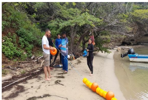
Figura 11. Instalación de Sistema de Boyas en el sendero subacuático del Playa del Medio – Bahía de Gayraca – PNNT

Se ha avanzado en la instalación del sistema de señalización marina en dos fases, la primera con la instalación del anclaje y boyas grandes y la segunda con la delimitación total del sendero con la ordenación de boyas de menor tamaño (ver: https://docs.google.com/document/d/12D3xchgZlpXinMCBmF1WwzDbUfAZWkRI/edit?usp=sharing&oid=105927075394208393385&rtpof=true&sd=true ). Para lo anterior PNN apporto el sistema de anclaje, cabos, boyas y apoyo la instalación del sistema junto con los beneficiarios de la alternativa productiva.