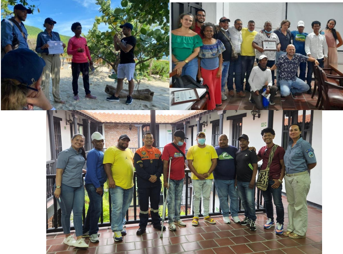
Figura 2. Registro fotográfico - Acciones de seguimiento y/o funcionamiento Alquiler de Carpas – Bahía Concha – PNNT

PARQUES NACIONALES NATURALES DE COLOMBIA