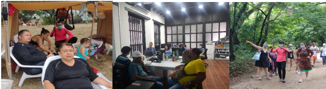
Figura 3. Imagen del alquiler de Carpas – ACPCOM - Bahía Concha - PNNT

En relación con el seguimiento de la actividad, se ha podido evidenciar que la actividad productiva, comparativamente con lo que generaba la actividad de pesca ha permitido la mejora de sus ingresos, pues según lo manifestado por los pescadores compensados, su ingreso en esa actividad iba de $600.000 a $1'000.000 al mes, mientras que la actividad de alquiler de carpas mantiene topes muy superiores, lo cual muestra la mejora en las condiciones de vida de estas personas y su núcleo familiar.