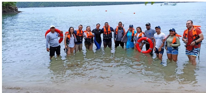
Figura 10. Registro Fotográfico Sendero Subacuático – Playa del Medio – PNNT, ASOGER

https://docs.google.com/presentation/d/1_FN6t5y9JuDkRnJxgA7cnckLIgMqsBIX/edit?usp=sharing&ouid=105927075394208393385&rtpof=true&sd=true ).