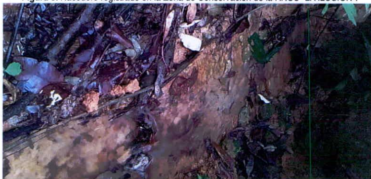
Figura 8. Nacedero registrado en la Zona de Conservación de la RNSC "LA ILUSIÓN".