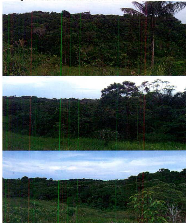
Figura 6. Vistas de la Zona de Conservación de la RNSC "LA ILUSIÓN".

Esta zona corresponde a 20,7165 ha, equivalentes al 28,88 % del área objeto de registro. Se encuentra conformada por la muestra de ecosistema natural de Bosques de Galería, Bosque Alto Denso Heterogéneo de Tierra Firme, Cananguchales y Fuentes Hídricas asociadas "ubicados en zona de lomerío (...) las especies arbóreas son de gran porte, aunque existe la disponibilidad para la conservación de estos bosques, actualmente hay presiones por parte de vecinos de la que invaden el predio con el fin de extraer las pocas maderas finas que quedan en los relictos de bosque" (Figuras 6, 7 y 8).