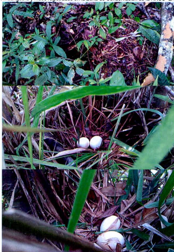
Figura 5. Madriguera y nidos registrados en la Zona de Conservación de la RNSC "LA ILUSIÓN".