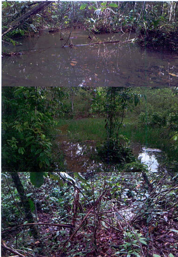
Figura 7. Cuerpos de agua registrados en la Zona de Conservación de la RNSC "LA ILUSIÓN".