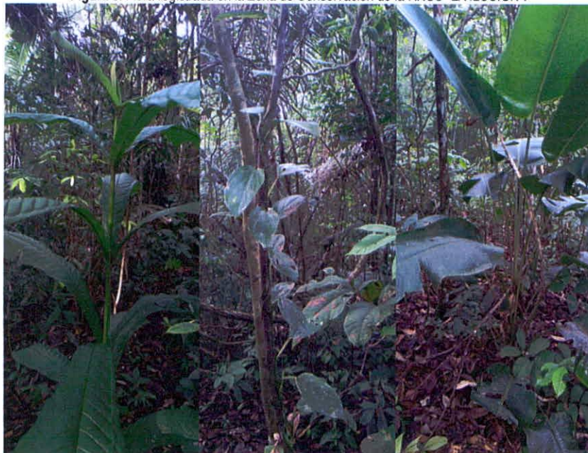
Figura 3. Flora registrada en la Zona de Conservación de la RNSC "LA ILUSIÓN".