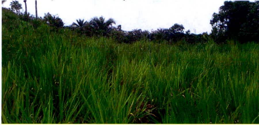
Figura 10. Vista de la Zona de Agrosistemas de la RNSC "LA ILUSIÓN".