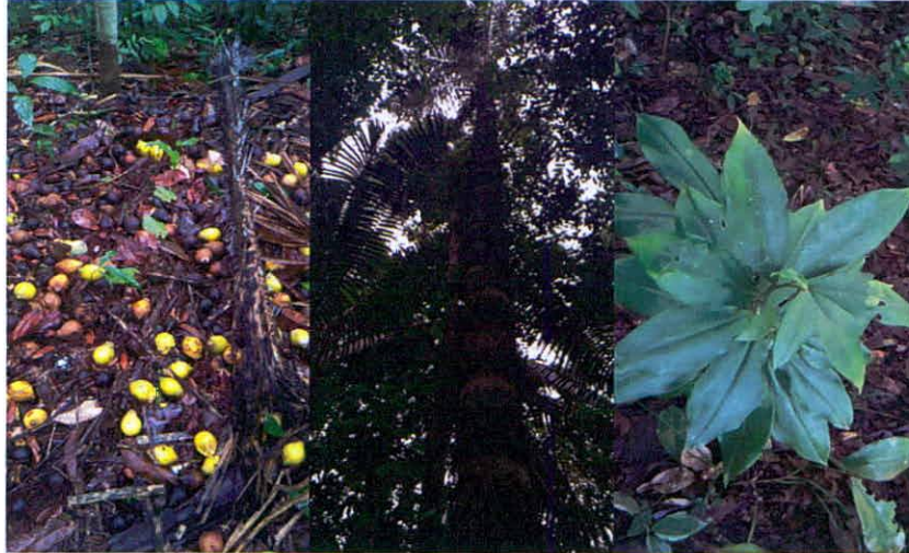
Figura 2. Flora registrada en la Zona de Conservación de la RNSC "LA ILUSIÓN".

"Según inventarios realizados en la zona es posible identificar 50 géneros agrupados en 18 familias", se reportan 58 especies vegetales. Las familias que se destacan por el mayor número de especies son Poaceae, Araceae, Arecaceae, Euphorbiaceae, Heliconiaceae y Myrtaceae. Algunas de las especies registradas durante la visita técnica se relacionan en las Figuras 2, 3 y 4.