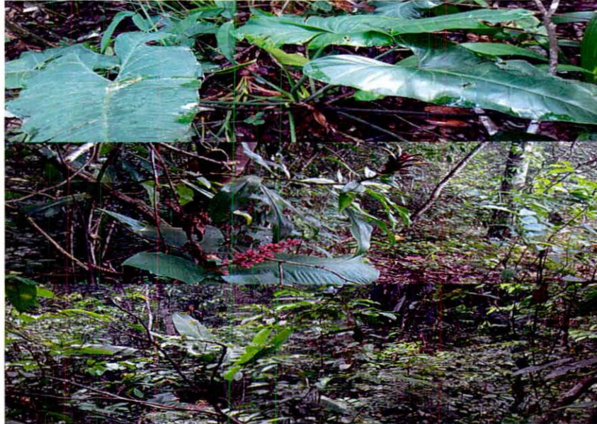
Figura 4. Flora registrada en la Zona de Conservación de la RNSC “LA ILUSIÓN”.