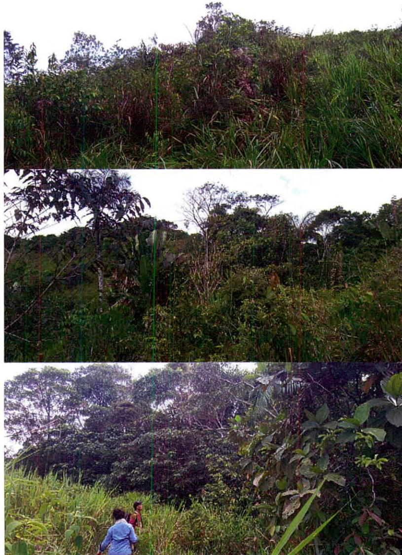
Figura 9. Vistas de la Zona de Amortiguación y Manejo Especial de la RNSC “LA ILUSIÓN”.