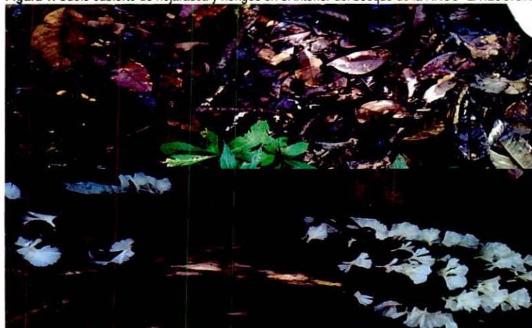
Figura 1. Suelo cubierto de hojarasca y hongos en el interior del bosque de la RNSC "LA ILUSIÓN".

De acuerdo con la reseña la muestra de ecosistema natural de la RNSC "LA ILUSIÓN" se halla clasificada "como bosque alto denso heterogéneo de tierra firme" y "(...) corresponde a la zona de vida Bosque Húmedo Tropical de acuerdo con la clasificación de Holdridge, y al zonobioma Húmedo Ecuatorial o Selvas del Piso"; "el predio La Ilusión se encuentra ubicado en el bioma húmedo tropical de la amazonia en el cual predominan dos ecosistemas: bosques naturales y pastos del zonobioma húmedo tropical de la amazonia, presenta un clima cálido muy húmedo, dentro de la unidad geomorfológica de lomerío fluvio- gravitacional. En la reserva predomina la cobertura de pastos limpios, vegetación secundaria o en transición y bosques fragmentados con vegetación secundaria." 3 Al interior de las coberturas boscosas se encuentra el suelo cubierto de hojarasca y, las condiciones de humedad presentes permiten que crezcan variedad de hongos (Figura 1).