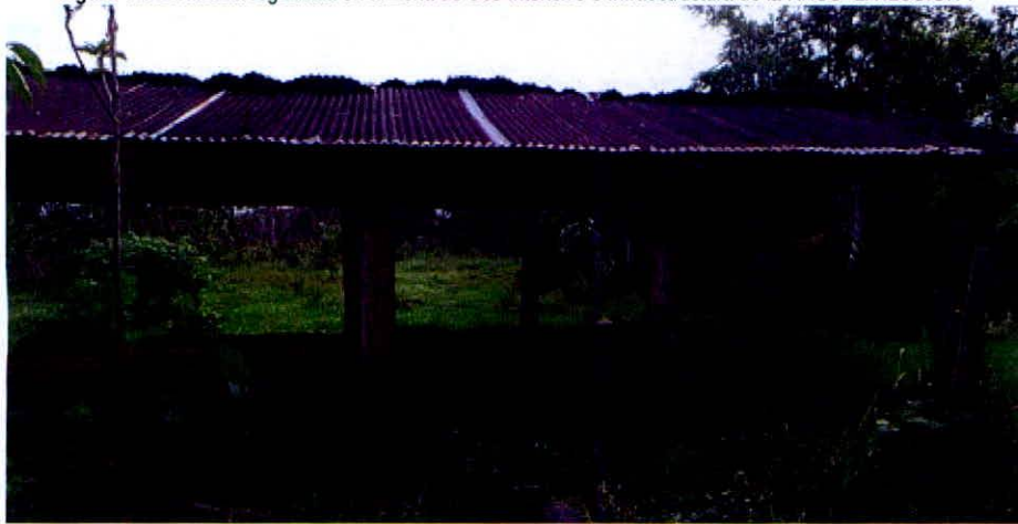
Figura 11. Enramada registrada en la Zona de Uso Intensivo e Infraestructura de la RNSC "LA ILUSIÓN".

Esta zona corresponde a 0,0069 ha, equivalentes al 0,01 % del área objeto de registro. Corresponde a una enramada elaborada en madera, con tejas de zinc y suelo cubierto de aserrín (Figura 11).