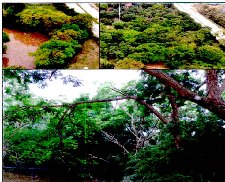
Figura 4. Zona de conservación identificada en la RNSC "EL KIOSCO".

5.1. ZONA DE CONSERVACIÓN: Esta zona corresponde a 0,4851 ha, equivalentes al 6,17% del área objeto de registro. Se encuentra conformada por la muestra de ecosistema de bosque de galería y representado en coberturas de bosque abierto bajo con estrato arbustivo en desarrollo, varios de estos sectores se encuentran cercados con el fin de reducir el impacto en ellos y la intención de los propietarios es una ampliación paulatina del área de conservación