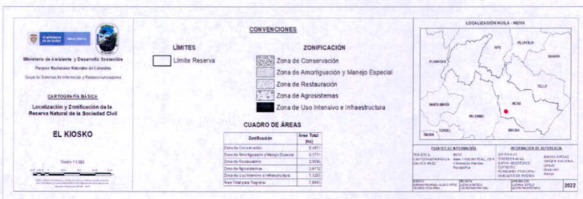
Figura 9. Zonificación propuesta para la RNSC "EL KIOSCO".