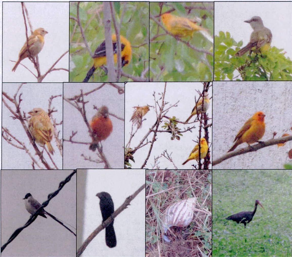
Figura 3. Algunos registros de fauna encontradas en los recorridos.