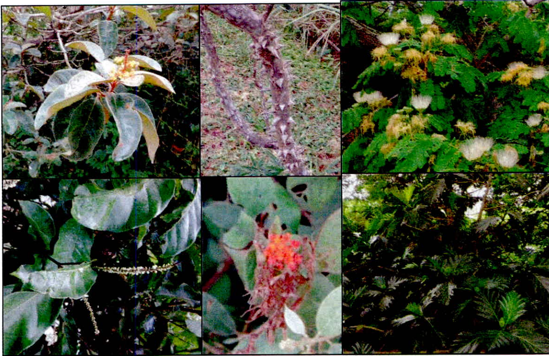
Figura 2. Parte de la vegetación encontrada en los recorridos al predio "El Kiosco".