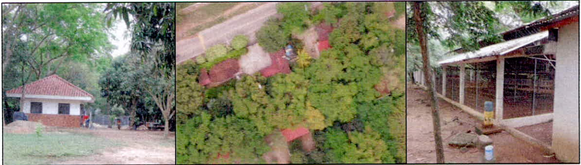
Figura 8. Aspecto de algunos sectores de uso intensivo e infraestructura en la RNSC "EL KIOSCO".

5.5. ZONA DE USO INTENSIVO E INFRAESTRUCTURA: Esta zona corresponde a 1,3255 ha. y cubre el 16,85% del área solicitada en registro, está conformada por la zona de vivienda, corrales para aves, construcciones para equipos de comunicaciones, senderos para los recorridos y manejo de las actividades de la finca y algunos espacios para contemplación de la naturaleza.