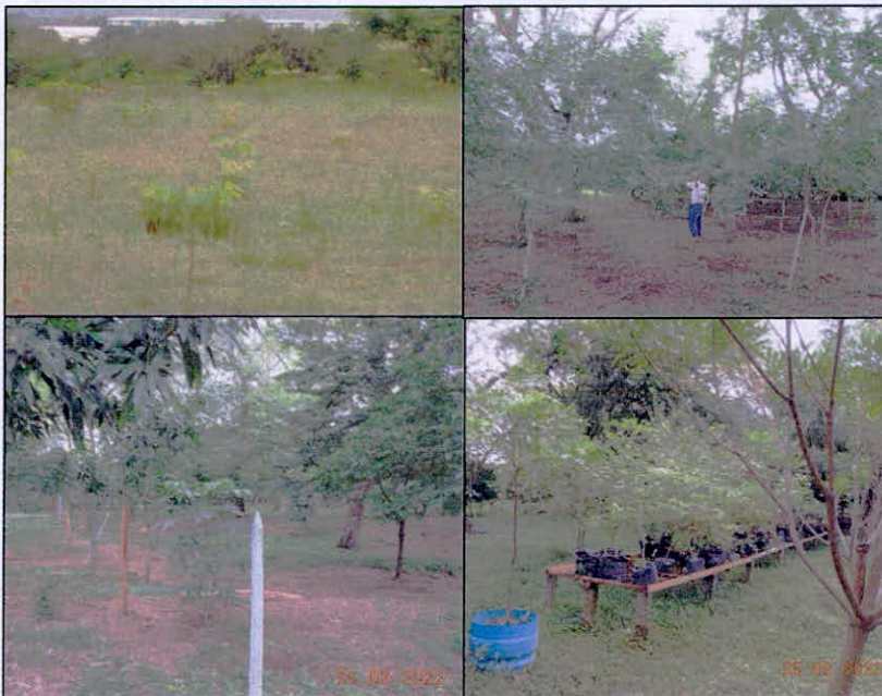
Figura 6. Aspecto de algunos sectores de restauración, se resalta la iniciativa de los propietarios de sembrar especies propias del bosque seco tropical y el mantenimiento y reproducción de los mismos.

5.3. ZONA DE RESTAURACIÓN: Comprende un área de 2,0096 ha. siendo el 25,55% del área solicitada en registro, y la conforman plantaciones de arboles propios de bosque seco tropical como dinde, payandé, iguá, cedro, chaparro, guásimos, entre otros. Son principalmente parches que buscan a mediano y largo plazo la conectividad y consolidación de las áreas de conservación. En un sector se encuentran arboles de mas de 8 metros de altura con poco desarrollo de los estratos arbustivo y herbáceo, sin embargo, se están realizando actividades de cercado y manejo para que se de con el tiempo un establecimiento de la vegetación natural. Asimismo, se incluye un área en la cual se han sembrado especies nativas y aun se encuentra en etapa de crecimiento de latizales y arbolitos de 1,2 metros en promedio. Se evidencia una búsqueda del desarrollo de esta actividad y se mantiene un vivero para el tutorado y reproducción de especies nativas con el fin de facilitar la siembra y potencial reemplazo de individuos.