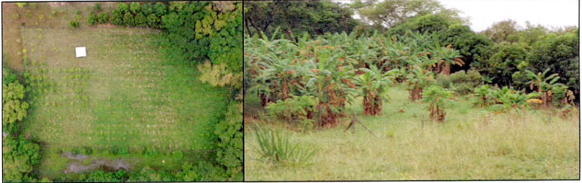
Figura 7. Aspecto de un sector de Agrosistemas de la RNSC "EL KIOSCO.

5.5. ZONA DE USO INTENSIVO E INFRAESTRUCTURA: Esta zona corresponde a 1,3255 ha. y cubre el 16,85% del área solicitada en registro, está conformada por la zona de vivienda, corrales para aves, construcciones para equipos de comunicaciones, senderos para los recorridos y manejo de las actividades de la finca y algunos espacios para contemplación de la naturaleza.