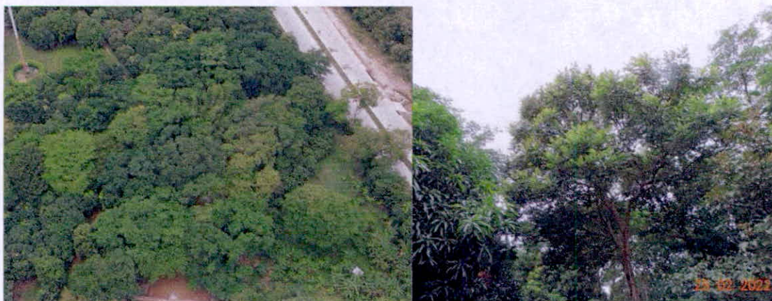
Figura 1. Muestra de ecosistema natural identificada en la RNSC "EL KIOSCO".

De acuerdo con la visita técnica realizada al predio "El Kiosco", este se encuentra localizado en un rango altitudinal entre los 470 y 480 metros sobre el nivel del mar y teniendo en cuenta lo evidenciado en los recorridos, la muestra ecosistémica pertenece a bosque de galería asociado a la quebrada El Salado, y se caracteriza por la presencia de varios parches de bosques abiertos bajos, con alturas promedio de 10 metros con algunos individuos de superiores a los 15 metros aproximadamente y varios individuos con DAP 1 superior a los 80 cms. (Figura 1).