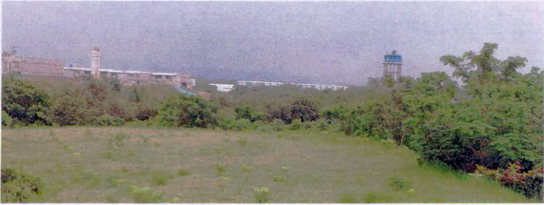
Figura 5. Aspecto de la zona de amortiguación para la RNSC "EL KIOSCO".

5.3. ZONA DE RESTAURACIÓN: Comprende un área de 2,0096 ha. siendo el 25,55% del área solicitada en registro, y la conforman plantaciones de arboles propios de bosque seco tropical como dinde, payandé, iguá, cedro, chaparro, guásimos, entre otros. Son principalmente parches que buscan a mediano y largo plazo la conectividad y consolidación de las áreas de conservación. En un sector se encuentran arboles de mas de 8 metros de altura con poco desarrollo de los estratos arbustivo y herbáceo, sin embargo, se están realizando actividades de cercado y manejo para que se de con el tiempo un establecimiento de la vegetación natural. Asimismo, se incluye un área en la cual se han sembrado especies nativas y aun se encuentra en etapa de crecimiento de latizales y arbolitos de 1,2 metros en promedio. Se evidencia una búsqueda del desarrollo de esta actividad y se mantiene un vivero para el tutorado y reproducción de especies nativas con el fin de facilitar la siembra y potencial reemplazo de individuos.