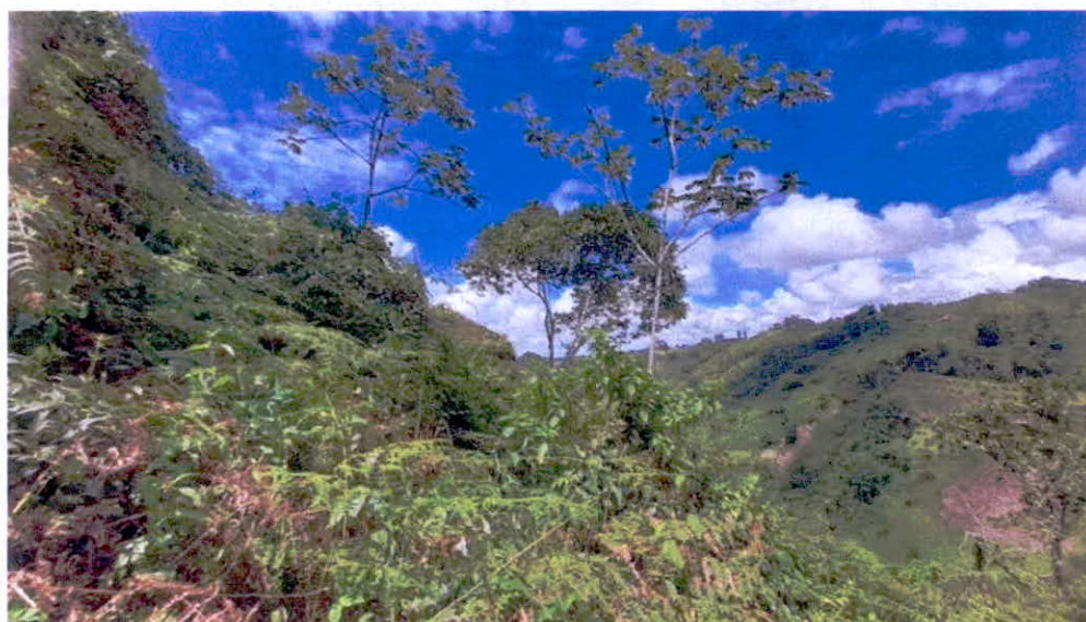
Imagen No. 7. Zona de restauración.

6.2. Zona de Restauración: Esta zona corresponde a 1,2944 ha equivalentes al 20,742% del área objeto de registro. Esta zona está conformada por un parche de vegetación secundaria que se encuentra en procesos de restauración no asistida; se localiza sobre áreas con fuertes pendientes; esta zona se dedicará a la realización de proyectos de restauración asistida y no asistida del ecosistema nativo.