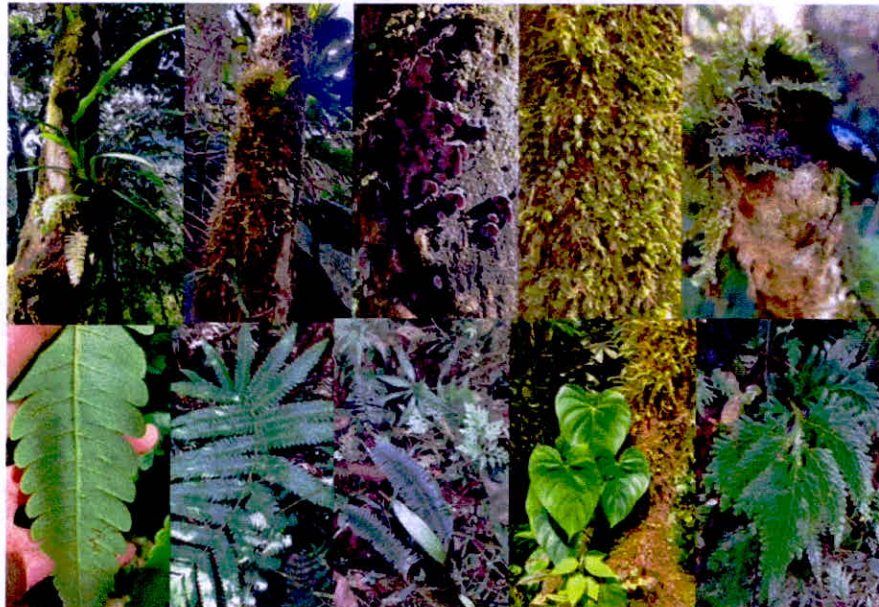
Imagen 3. Flora registrada en la RNSC 173-22 PINCHAQUE".