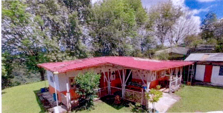
Imágenes No. 10 y11. Zona de Uso Intensivo e Infraestructura.