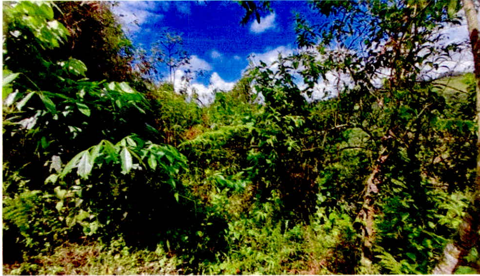
Imagen No. 8. Zona de Amortiguación y Manejo Especial.

franja de transición entre las zonas de conservación y restauración, y las zonas de agrosistemas e infraestructura respectivamente; está conformada por herbazales y vegetación arbustiva.