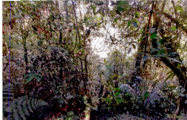
Imágenes No. 1 y 2: Muestra de ecosistema natural presente en el predio "La Pradera".