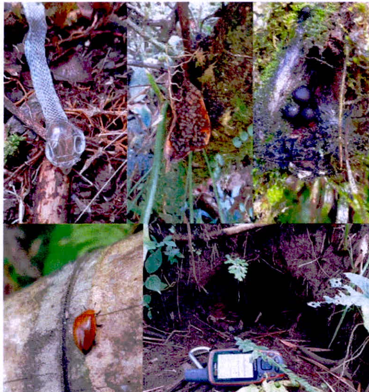
Imagen 4. Registros de fauna RNSC 173-22 PINCHAQUE".

Aves como perico de monte, barranquero, pava negra caucana, garza, alcaraván, colibrí, mirlo negro, mirlo mayera, azulejo, carpintero, garrapatero, copetón, tórtola, collarero, cucarachero, halcón reidor, yátaro o tucán esmeralda, águila, búho, tângara multicolor, saltarín amarillo, bichofue, azulejo palmero, atrapamoscas pechirrojo, entre otros. Anfibios como ranas, sapos, mariposas.