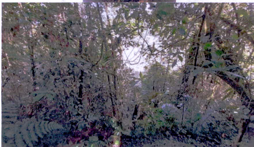
Imágenes No. 5 y 6. Zona de conservación.

6.2. Zona de Restauración: Esta zona corresponde a 1,2944 ha equivalentes al 20,742% del área objeto de registro. Esta zona está conformada por un parche de vegetación secundaria que se encuentra en procesos de restauración no asistida; se localiza sobre áreas con fuertes pendientes; esta zona se dedicará a la realización de proyectos de restauración asistida y no asistida del ecosistema nativo.