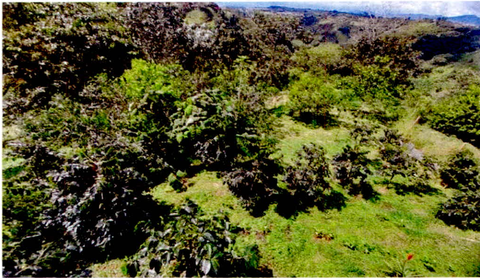
Imagen No. 9. Zona de Agrosistemas.

6.4. Zona de Agrosistemas: Esta zona corresponde a 1,6500 ha, equivalentes al 26,440% del área objeto de registro. Esta zona está dedicada principalmente al cultivo de café, frutales, cría de gallinas de pastoreo y lumbrecultura.