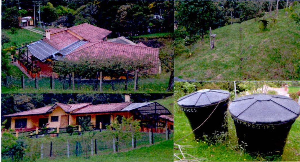
Figura 5. Vista general de la zona de uso intensivo e infraestructura en la RNSC "NASER".

POR MEDIO DE LA CUAL SE MODIFICA LA RESOLUCIÓN NO. 212 DEL 28 DE DICIEMBRE DE 2018 "POR MEDIO DE LA CUAL SE REGISTRA LA RESERVA NATURAL DE LA SOCIEDAD CIVIL "NASER" 105-18