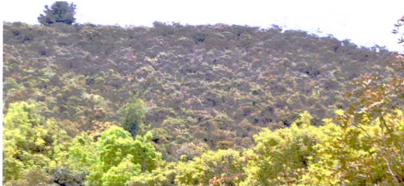
Figura 1. Muestra ecosistémica de bosque seco montano bajo (bs-MB) para el predio objeto de modificación del registro.