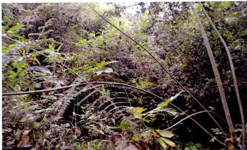
Figura 4. Vista general de uno de algunos sectores del área de conservación en la RNSC "NASER".

Estas áreas de conservación buscan la protección de especies propias del bosque seco montano bajo (bs-MB), generando un corredor de conectividad ecológica con algunos predios vecinos.