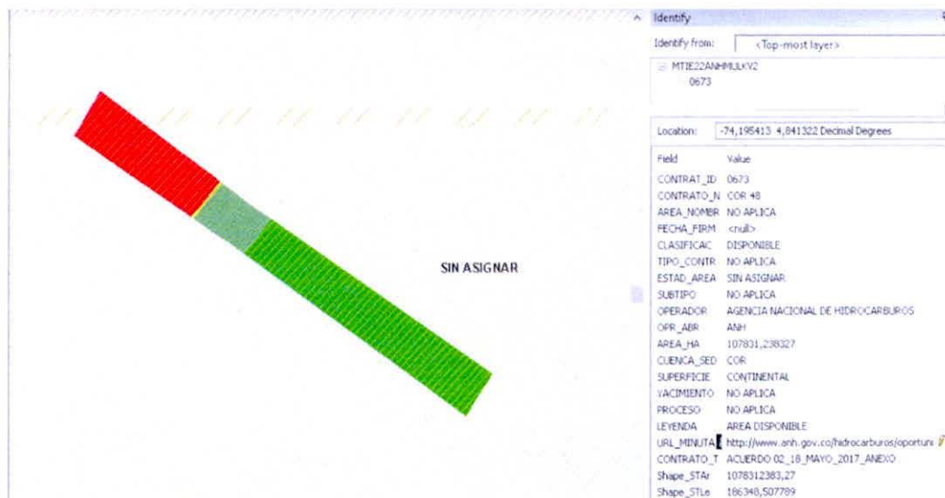
Figura 8. Traslape de la reserva "NASER" con un área sin asignar.

Por lo tanto, se considera viable continuar con la modificación del registro de la Reserva Natural de la Sociedad Civil "NASER"