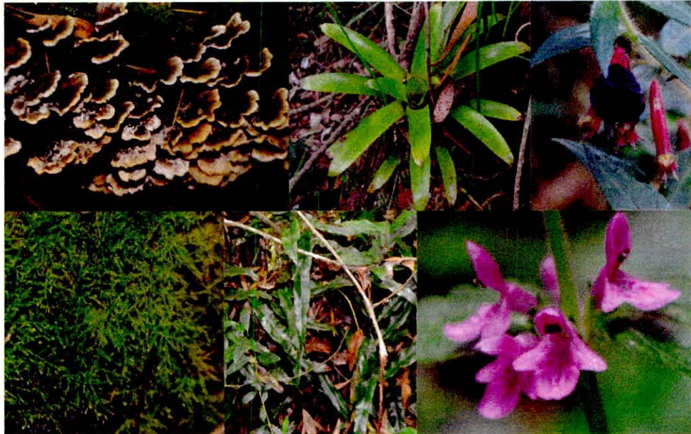
Figura 3. Muestra de vegetación presente en la RNSC.