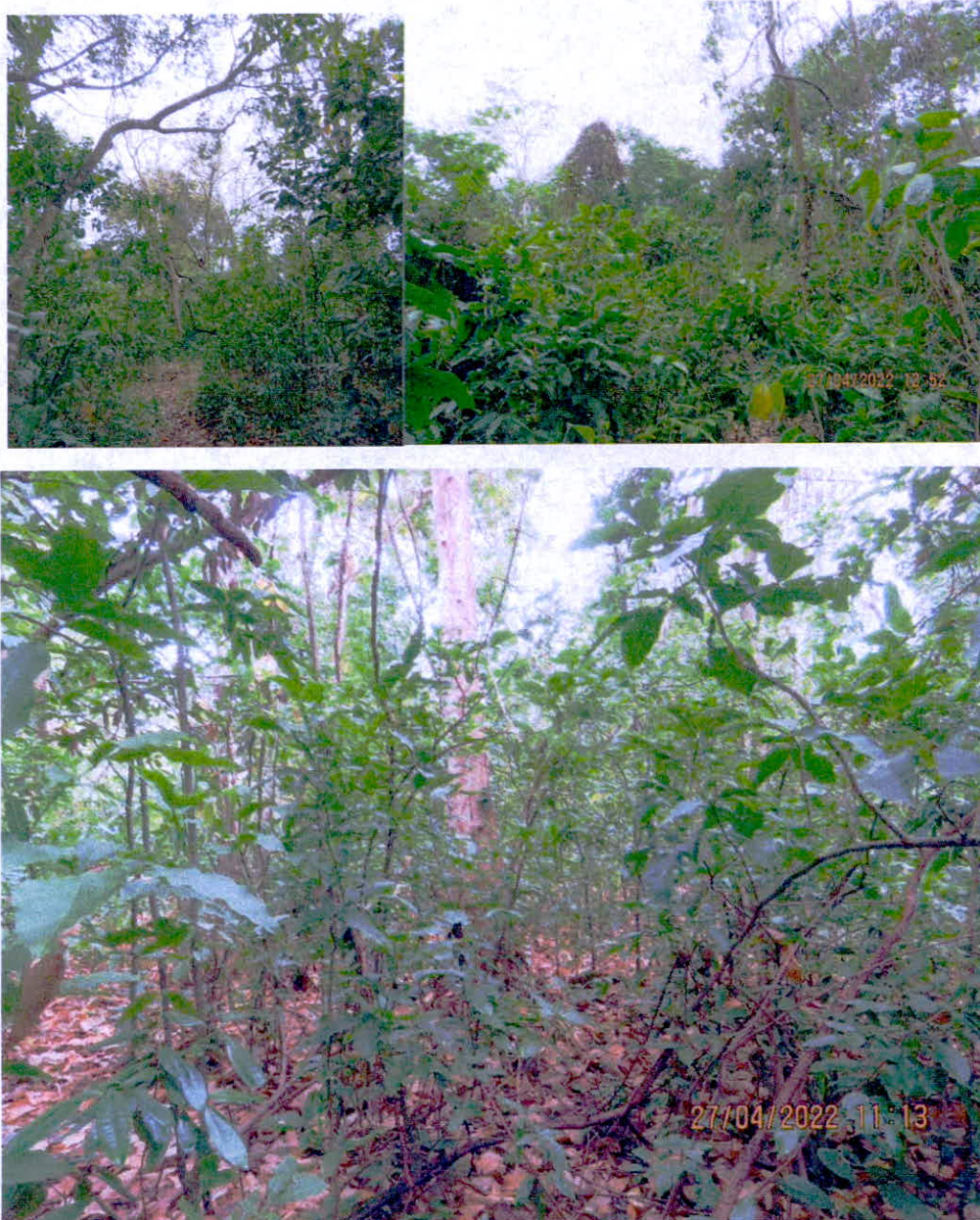
Figura 5. Zona de Amortiguación y Manejo Especial de la RNSC "FAUNA DE COLOMBIA SAN ANDRES ISLA"