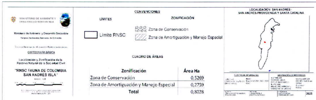
Figura 4. Zonificación de la Reserva Natural de la Sociedad Civil "FAUNA DE COLOMBIA SAN ANDRES ISLA".