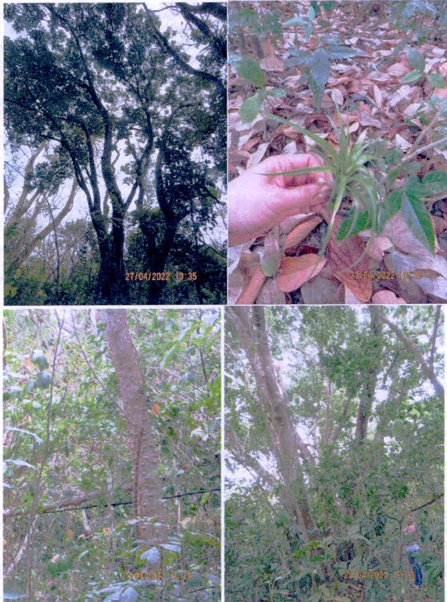
Figura 2. Registro de flora en la RNSC "FAUNA DE COLOMBIA SAN ANDRÉS ISLA"