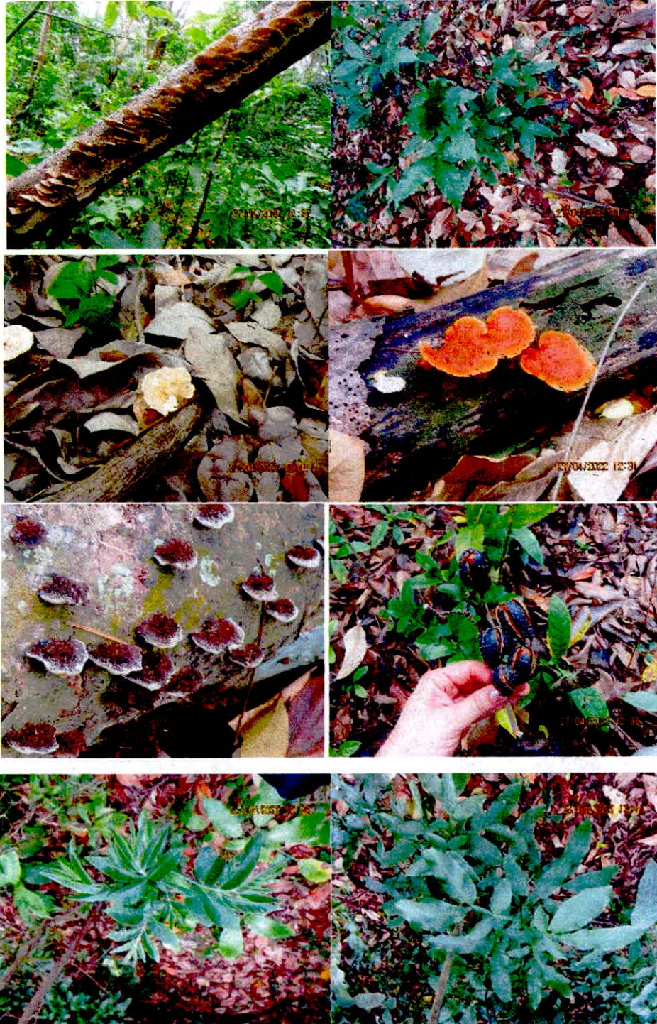
Continuación Figura 2. Registro de flora en la RNSC "FAUNA DE COLOMBIA SAN ANDRÉS ISLA"