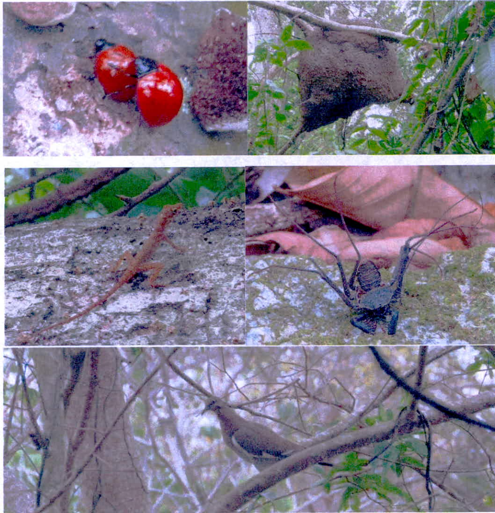
Figura 3. Registro de flora en la RNSC "FAUNA DE COLOMBIA SAN ANDRES ISLA"