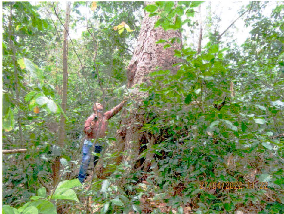
Continuación Figura 1. Vista de la muestra de ecosistema de transición entre el bosque seco - bosque húmedo tropical en la RNSC "FAUNA DE COLOMBIA SAN ANDRÉS ISLA"