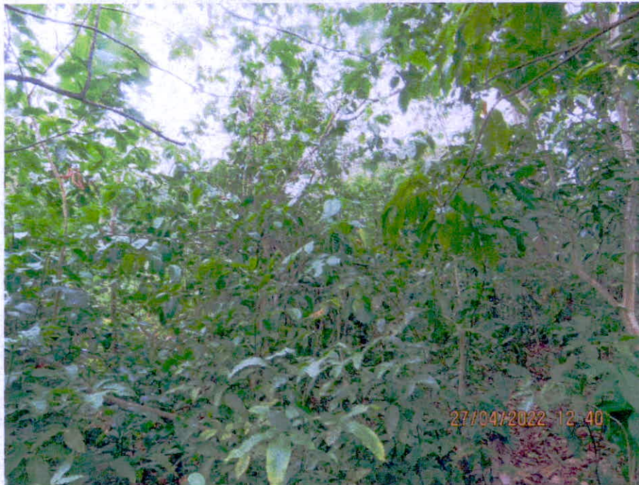
Figura 1. Vista de la muestra de ecosistema de transición entre el bosque seco - bosque húmedo tropical en la RNSC "FAUNA DE COLOMBIA SAN ANDRES ISLA"