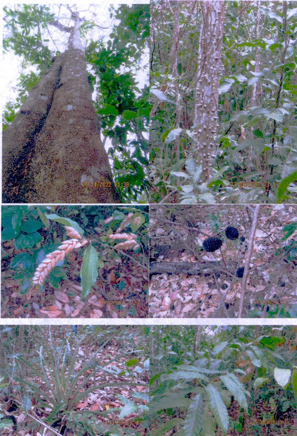
Continuación Figura 2. Registro de flora en la RNSC "FAUNA DE COLOMBIA SAN ANDRÉS ISLA"