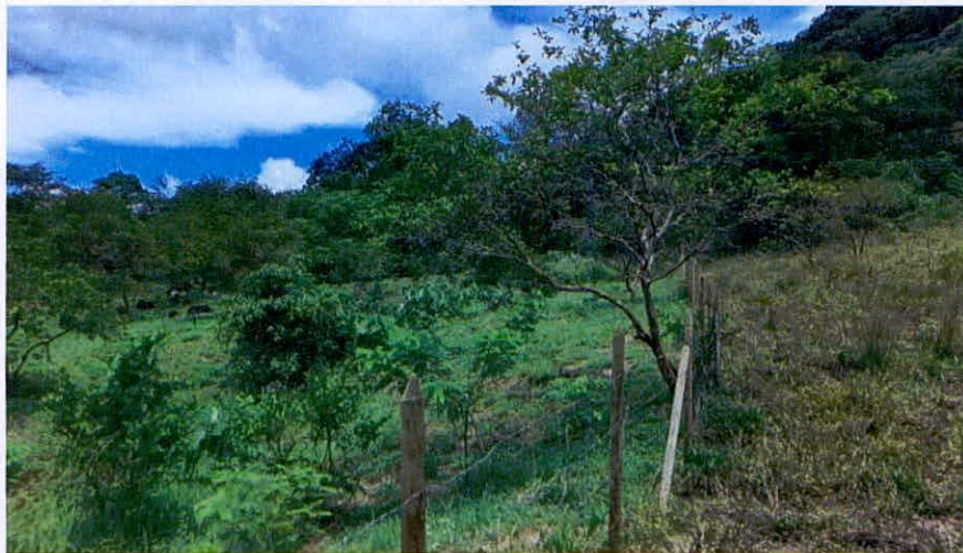
Imagen 17. Zona de restauración.

6.3. Zona de Restauración: Esta zona corresponde a 4,7237 ha equivalentes al 1,39 % del área objeto de registro. Esta zona está compuesta por áreas que años atrás fueron productivas, sin embargo, dejaron de usarse e iniciaron procesos de restauración asistida y no asistida del ecosistema natural presente.