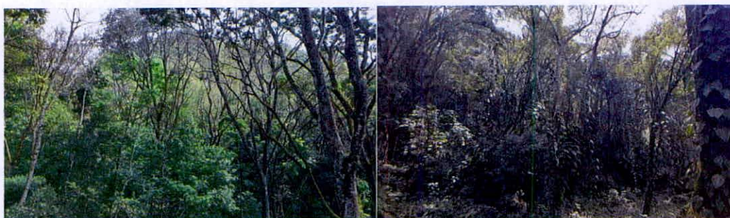
Imágenes 14 y 15. Zona de conservación.

6.1. Zona de Conservación: Esta zona corresponde a 169,6822 ha, equivalentes al 49,90% del área objeto de registro. Esta zona, está conformada por la muestra de ecosistema natural de Bosque Seco Tropical, la cual se encuentra en buen estado de conservación, caracterizada por la presencia de bosques densos a abiertos con alturas promedio en algunas zonas de 15 metros, y en otras alcanzando alturas hasta de 20 metros. La reserva, forma parte de la cuenca del Río Cauca; debido a su topografía, cuenta con drenajes que tributan sus aguas al río mencionado permitiendo la oferta de importantes servicios ecosistémicos como la regulación de ciclos hidrológicos y la protección de hábitats para especies de flora y fauna de alta importancia ecológica para la región.