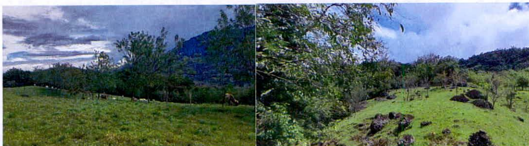
Imágenes 18 y 19. Zona de Agrosistemas.

6.5. Zona de Uso Intensivo e Infraestructura: Esta zona corresponde a 4,4020 ha, equivalentes al 1,29% del área objeto de registro. Esta zona está conformada por tres viviendas habitables, establos y vías de acceso hacia las zonas productivas.