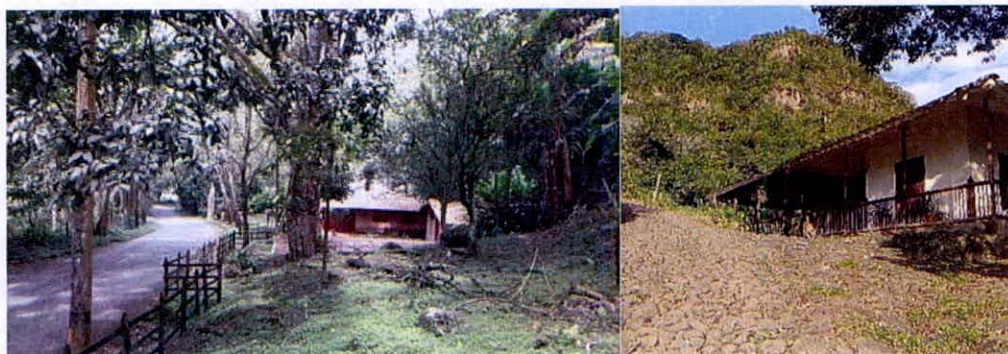
Imágenes 20 y 21. Zona de Uso Intensivo e Infraestructura.

6.5. Zona de Uso Intensivo e Infraestructura: Esta zona corresponde a 4,4020 ha, equivalentes al 1,29% del área objeto de registro. Esta zona está conformada por tres viviendas habitables, establos y vías de acceso hacia las zonas productivas.