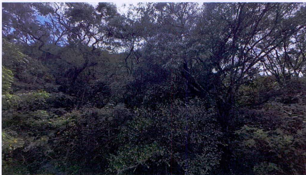
Imágenes 2 y 3. Muestra de ecosistema natural presente.