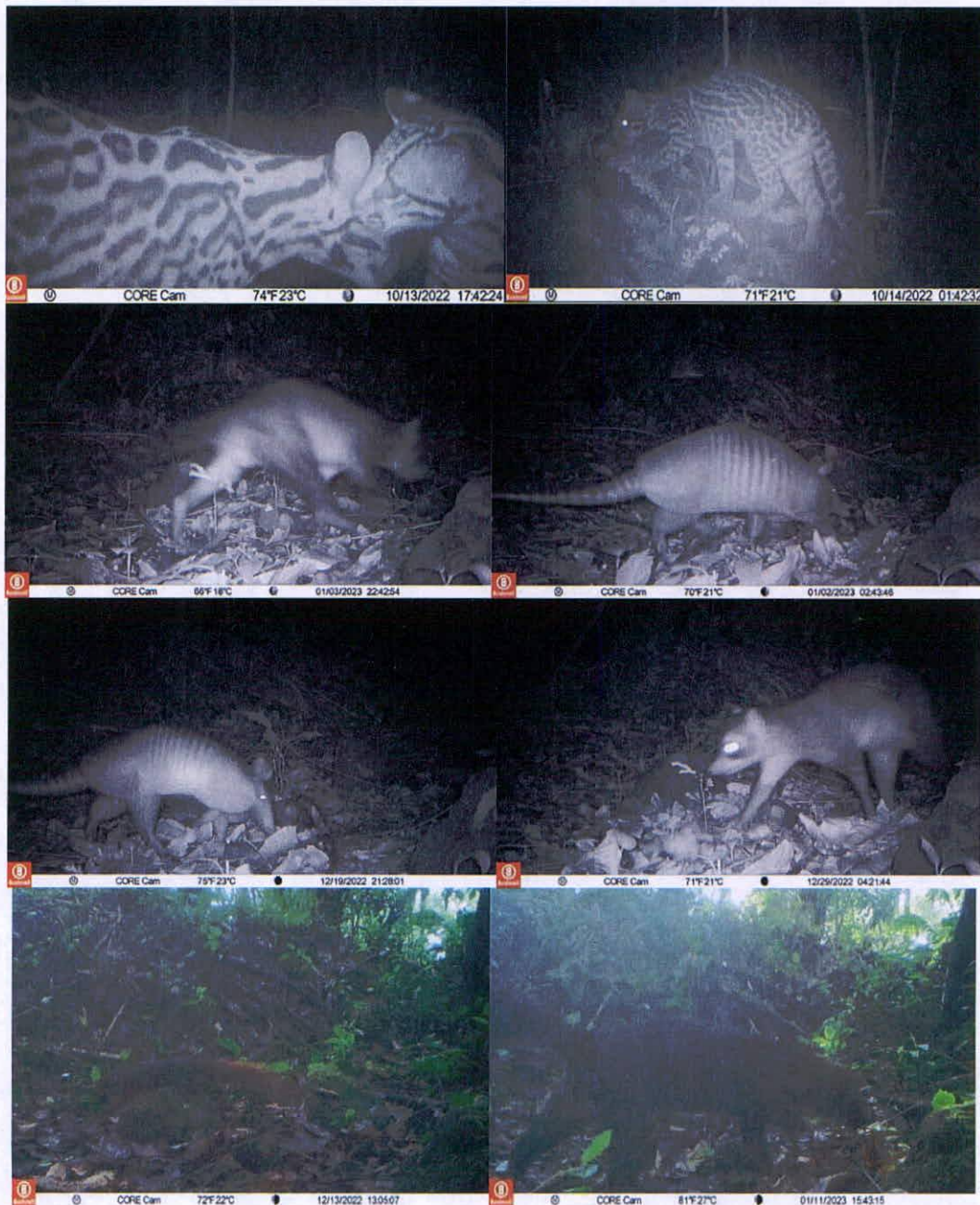
Tabla No. 3. Especies de mamíferos registrados en la RNSC "NATURA PEÑALTA 1". Fuente: Radicado No. 20224600038852 del 8/4/2022.