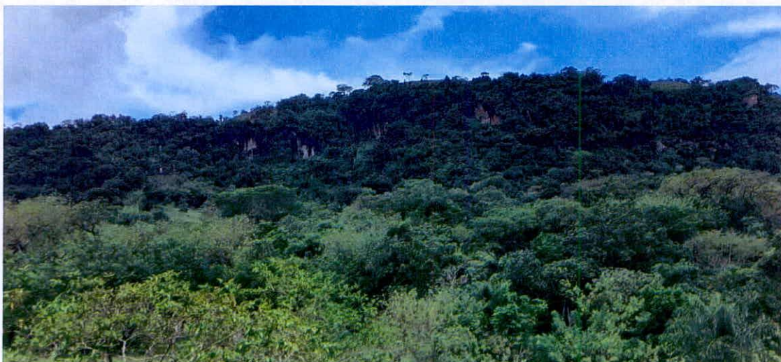
Imagen 1. Muestra de ecosistema natural presente.

La RNSC forma parte de la cuenca del Río Cauca, así mismo, dada su topografía moderada, fuertemente inclinada hasta escarpada en algunos sectores, cuenta con patrones naturales de drenaje de aguas hacia las partes bajas, las cuales drenan sus aguas hacia el Río mencionado. Estos cuerpos de agua, se encuentran aislados de los procesos productivos de la reserva, asimismo, se encuentran en proceso de restauración asistida y no asistida.