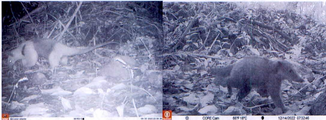
Imágenes 4 a la 13. Fauna registrada en la reserva.

Asimismo, se cuenta con los siguientes registros de aves: