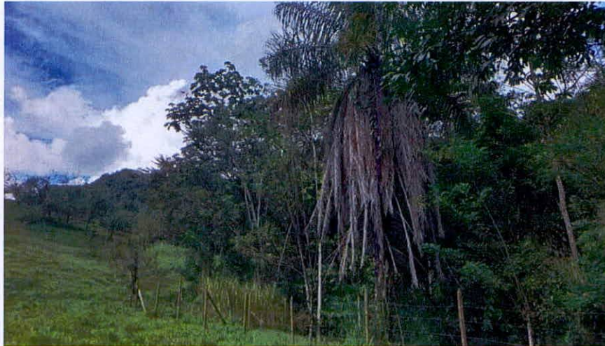
Imagen 16. Zona de amortiguación y manejo especial.

Restauración; y las zonas productivas o de uso intensivo. Está compuesta por pastos y especies arbustivas.