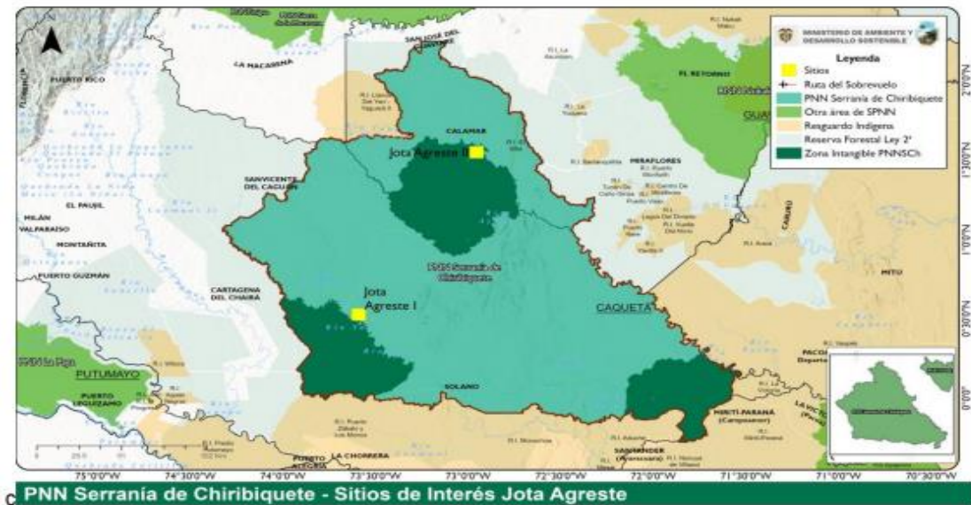
Figura 2. Ubicación de puntos de filmación al interior del PNN Serranía de Chiribiquete

4. En atención a la zonificación del área protegida, estas actividades se desarrollarían en las siguientes zonas de manejo: