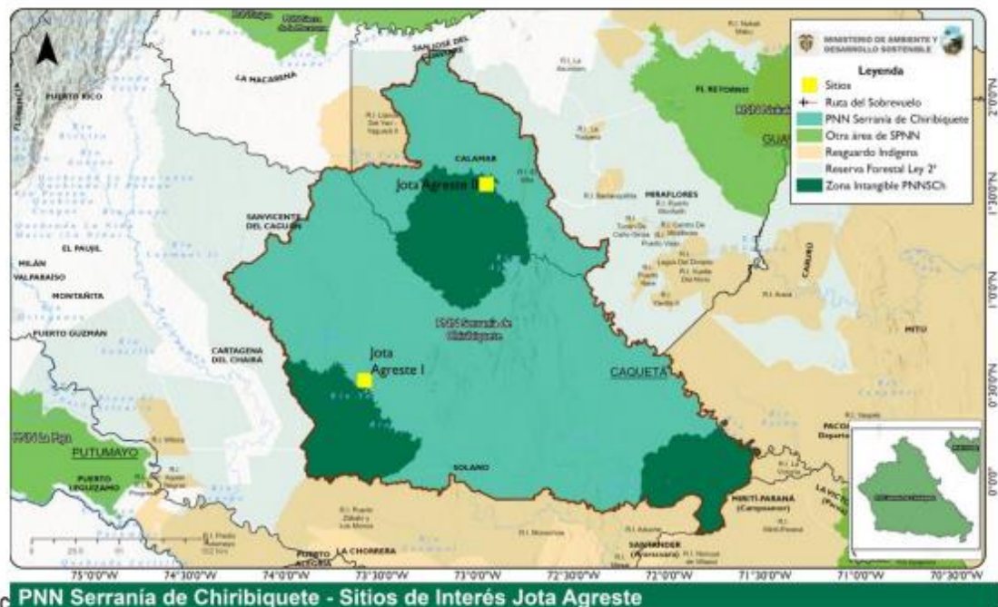
Figura 2. Ubicación de puntos de filmación al interior del PNN Serranía de Chiribiquete Fuente: SIG - PNNSch

El proyecto prevé que en el punto denominado Jota Agreste I será punto de aterrizaje y ubicación del campamento, y el punto denominado Jota Agreste II como punto de grabación, para así generar la documentación visual. Con el propósito de divulgar los hallazgos y preocupaciones científicas en relación con el arte rupestre de Chiribiquete, para inscribirlo dentro de un contexto arqueológico más amplio, que permita a mediano y largo plazo una mejor comprensión y preservación del territorio dada su importancia para el país y el mundo (Figura 2).