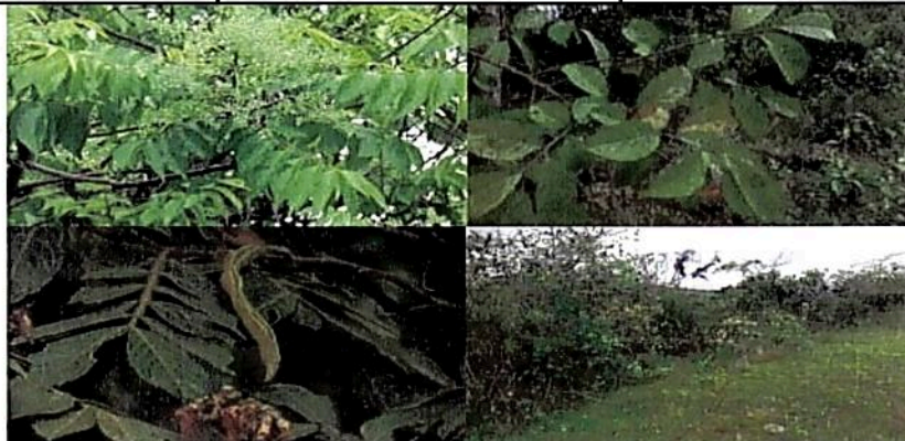
Figura 2. Flora observada durante la visita técnica realizada por la CAM, al predio "Sin Dirección Morrocoy"