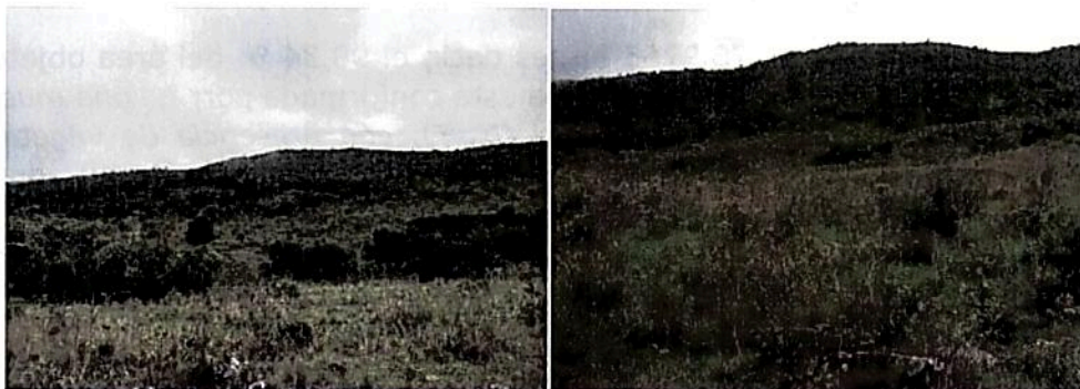
Figura 5. Zona de agrosistemas de la RNSC "MORROCOY"

Esta zona corresponde a 2,8541 ha, es decir, el 1,59 % del área objeto de registro. De acuerdo con la CAM, esta área está "conformada por potreros de pasto puntero, tiatino y pajonales en la cual se implementará ganadería no extensiva"