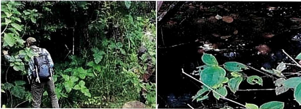
Figura 1. Predio "Sin Dirección Morrocoy", inscrito bajo FMI No. 200-89938

alta biodiversidad que obedece a la variedad de sus condicionantes abióticos como el relieve, suelo, hidrología y su complejidad biogeográfica.