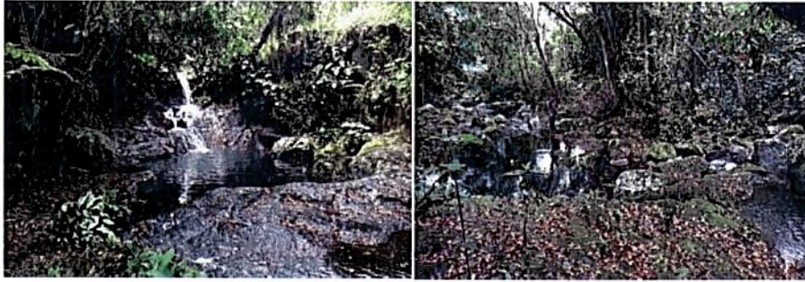
Figura 4. Muestra de ecosistema de la RNSC "MORROCOY"