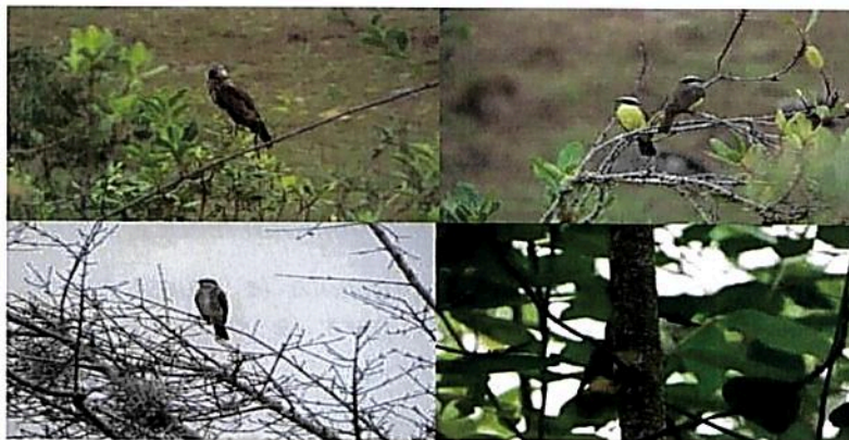
Figura 3. Fauna observada durante la visita técnica realizada por la CAM, al predio "Sin Dirección Morrocoy"